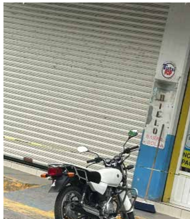
Sujetos desconocidos dispararon con armas de fuego contra la fachada de una dulcería

Procuraduría General de Justicia del Estado de Hidalgo para dar inicio con las investigaciones. Por su parte elementos de corporaciones de seguridad desplegaron un operativo para intentar localizar y asegurar a los responsables. Como se recordará, desde hace algunas semanas la seguridad del municipio fue asumida por el mando coordinado.