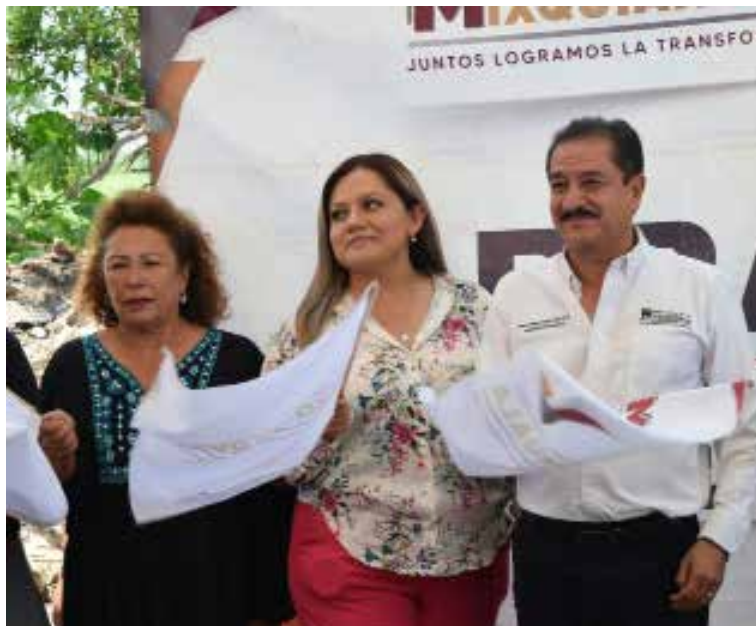
La pavimentación de esta vialidad busca mejorar la movilidad, la seguridad y las condiciones de tránsito para las familias de la zona.

Mixquiahuala de Juárez, Hidalgo.- Como parte de las jornadas de Arranques de Obra Pública 2026, autoridades municipales dieron el banderazo de inicio a la construcción de la pavimentación asfáltica de la Calle Altamirano, ubicada en la Séptima Demarcación.