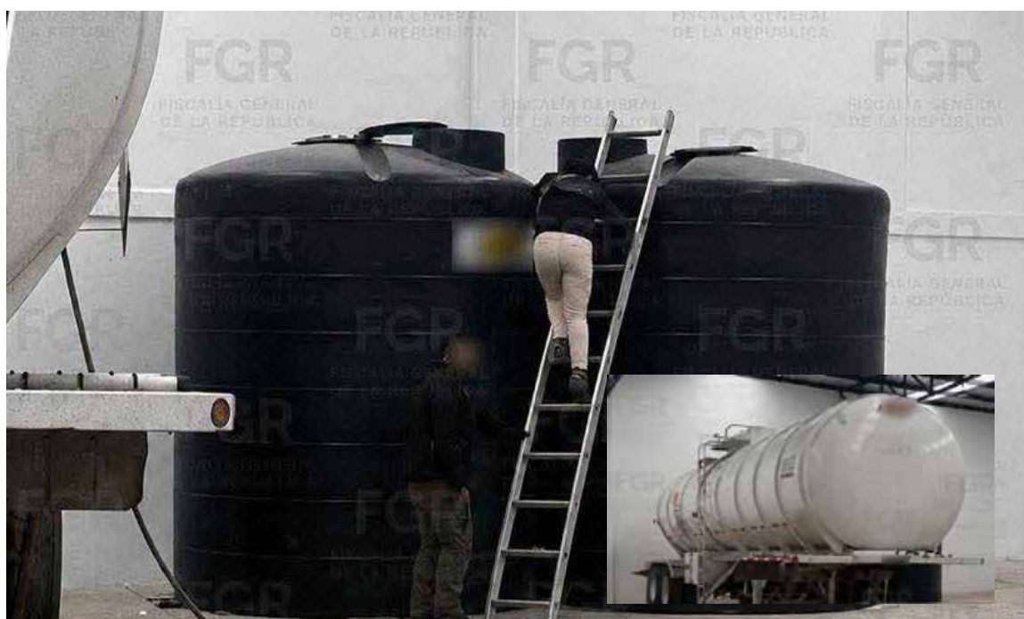
Todo lo asegurado quedó bajo resguardo del Ministerio Público Federal, que continuará con las investigaciones

Todo lo asegurado quedó bajo resguardo del Ministerio Público Federal, que continuará con las investigaciones correspondientes para deslindar responsabilidades.