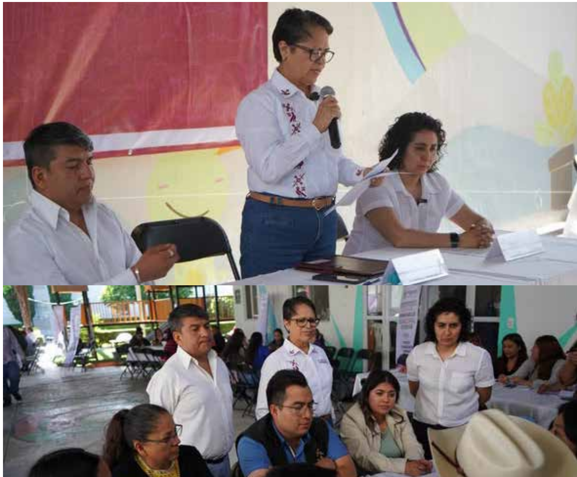
El Gobierno Municipal agradeció a todas y todos los ciudadanos, representantes de los diferentes sectores y participantes que contribuyeron con sus valiosas aportaciones

El Gobierno Municipal agradeció a todas y todos los ciudadanos, representantes de los diferentes sectores y participantes que contribuyeron con sus valiosas aportaciones reiterando que su participación es fundamental para consolidar un municipio con rumbo, visión y mejores oportunidades para todas las familias.