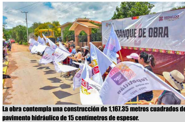
La obra contempla una construcción de 1,167.35 metros cuadrados de pavimento hidráulico de 15 centímetros de espesor.

perseverancia y el compromiso de la delegada para gestionar este proyecto en beneficio de las familias de la Cuarta Manzana. Asimismo, destacó que esta obra se realiza con recursos propios del municipio, provenientes del Fondo REFIS (Recursos Financieros), resultado del manejo responsable de los ingresos obtenidos por el pago oportuno del impuesto predial, el servicio de agua potable, las licencias de funcionamiento y otros servicios municipales, lo que permite seguir invirtiendo en infraestructura que mejora la calidad de vida de la población.