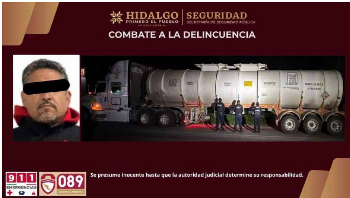
Tras realizar la inspección correspondiente, el operador no logró acreditar con la documentación requerida el origen ni el traslado legal del combustible

El conductor, el tractocamión y la carga asegurada quedaron a disposición de la Fiscalía General de la República, instancia que dará seguimiento a las investigaciones y determinará la situación legal del caso.