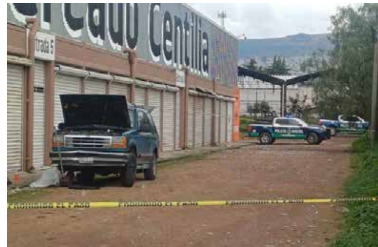
Un hombre perdió la vida y otro más resultó lesionado tras un ataque armado registrado al interior de un local comercial

De acuerdo con los primeros reportes, hasta el momento se desconoce la identidad de las víctimas. Tras la agresión, corporaciones de seguridad implementaron un operativo en la zona para tratar de localizar a los presuntos responsables.