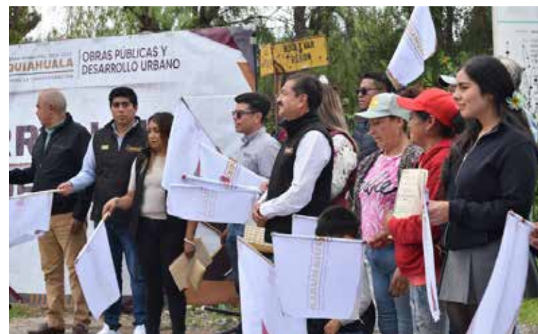
El Durazno expresaron su reconocimiento por la realización de esta obra

Con esta entrega, el Gobierno Municipal de Mixquiahuala de Juárez continúa impulsando proyectos de infraestructura