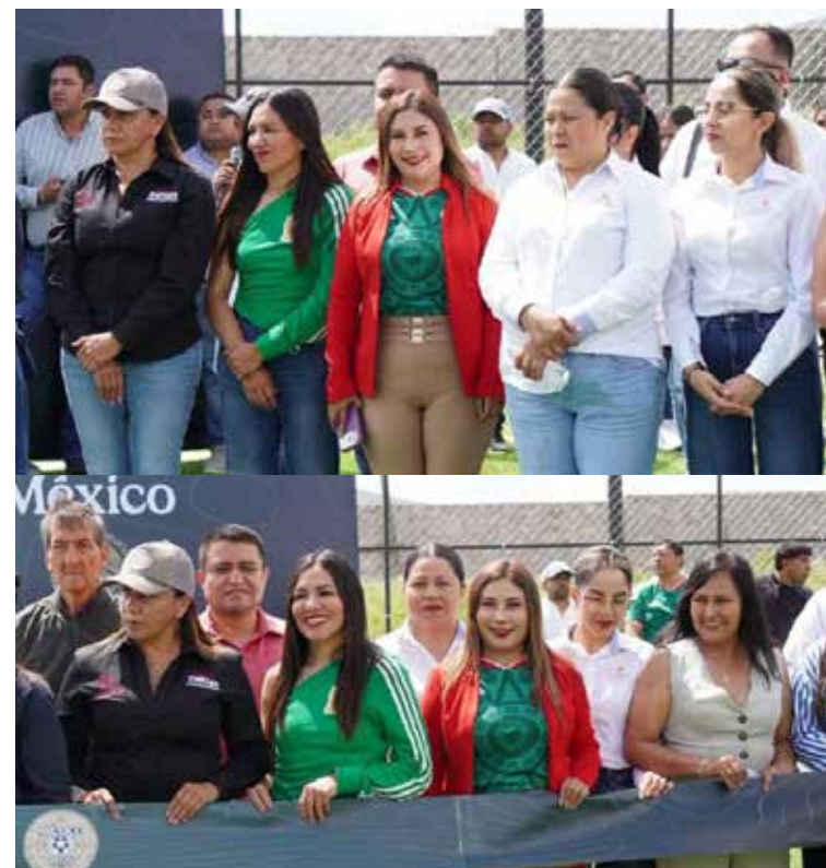
Con este proyecto, Tezontepec de Aldama se suma a los municipios que fortalecerán su infraestructura deportiva

Con este proyecto, Tezontepec de Aldama se suma a los municipios que fortalecerán su infraestructura deportiva, mediante acciones encaminadas a impulsar el bienestar y el desarrollo comunitario.