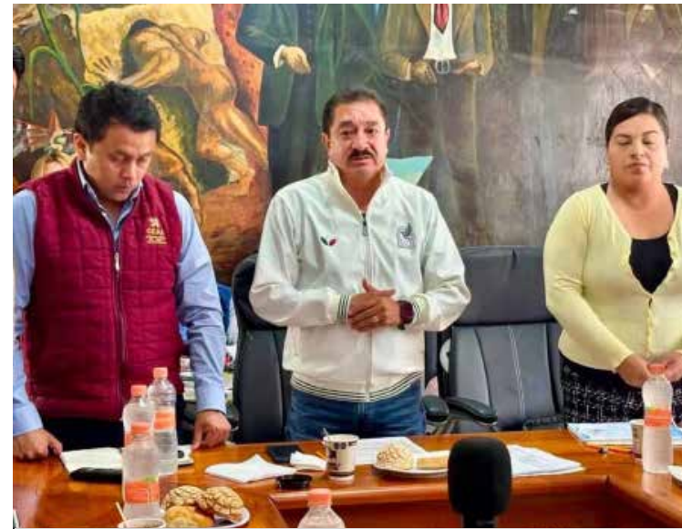
5ª Sesión Extraordinaria 2026 de la Junta de Gobierno de la Comisión de Agua Potable y Alcantarillado del Municipio de Mixquiahuala