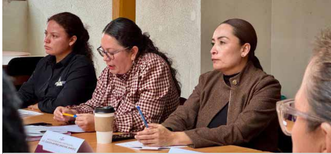
Integrantes del Cabildo avalaron el Reglamento Municipal de Protección Civil y Gestión Integral de Riesgos

Asimismo, las y los integrantes del Cabildo avalaron el Reglamento Municipal de Protección Civil y Gestión Integral de Riesgos, instrumento que actualiza el marco normativo para fortalecer las acciones de prevención, atención y mitigación de riesgos, con el propósito de proteger a la población y su patrimonio ante