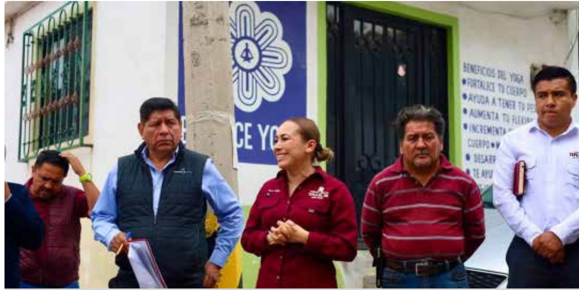
La alcaldesa reiteró que la participación ciudadana es un elemento fundamental para la toma de decisiones y la ejecución de proyectos

Con este tipo de reuniones, el Gobierno Municipal