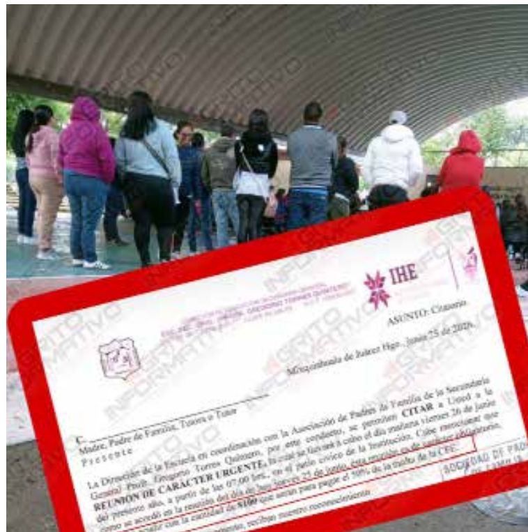
Las cosas no marchan bien en el comité de padres y dirección de la Escuela Secundaria General Profesor Gregorio Torres Quintero

Preocupados por la situación han alzado la voz para exigir la intervención de las autoridades educativas para que se audite y vigile la operación del comité y dirección del plantel.