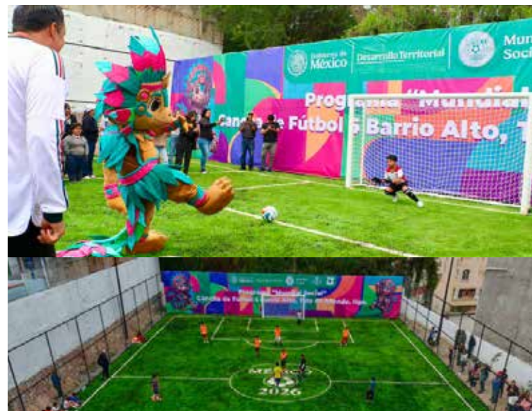
El gobierno municipal aportó el espacio donde se construyó la cancha, además de realizar trabajos complementarios de pintura, reforestación y rehabilitación de juegos infantiles

con la Comisión Nacional de Cultura Física y Deporte (CONADE), el Gobierno del Estado de Hidalgo, el gobierno municipal de Tula de Allende y la delegación de Barrio Alto. Durante su discurso, el alcalde mencionó que este tipo de obras son resultado de la suma de voluntades entre los tres órdenes de gobierno y hoy Tula resultó beneficiada con esta iniciativa. Además, dijo que contar con instalaciones dignas permite acercar a la gente al deporte, alejarla de conductas de riesgo y crear lugares de encuentro y bienestar para todos. De esta manera Tula de Allende se suma al proyecto impulsado por la presidenta Claudia