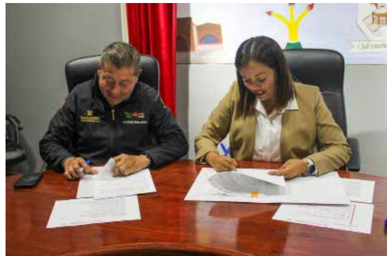
Convenio de colaboración con el Colegio de Estudios Científicos y Tecnológicos del Estado de Hidalgo

Autoridades municipales señalaron que este tipo de alianzas contribuyen a fortalecer la educación y generar mejores herramientas para el desarrollo de las nuevas generaciones en Chilcuautla.