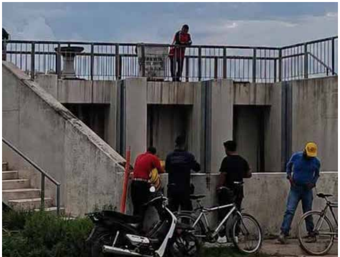
La mujer padecía epilepsia, condición que también será tomada en cuenta durante las indagatorias.

Asimismo, trascendió que la mujer padecía epilepsia, condición que también será tomada en cuenta durante las indagatorias.