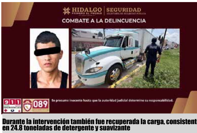
Durante la intervención también fue recuperada la carga, consistente en 24.8 toneladas de detergente y suavizante

(C5i), mediante el cual se informó sobre el robo de un tractocamión de carga ocurrido en aquella entidad. De manera inmediata, elementos de la policía estatal implementaron un operativo de búsqueda y localización en la zona metropolitana de Pachuca, logrando ubicar una unidad que coincidía con las características reportadas cuando circulaba sobre el bulevar Santa Catarina. Tras realizar la inspección, los agentes confirmaron que tanto el tractocamión como la caja seca contaban con reporte de robo vigente en el Estado de