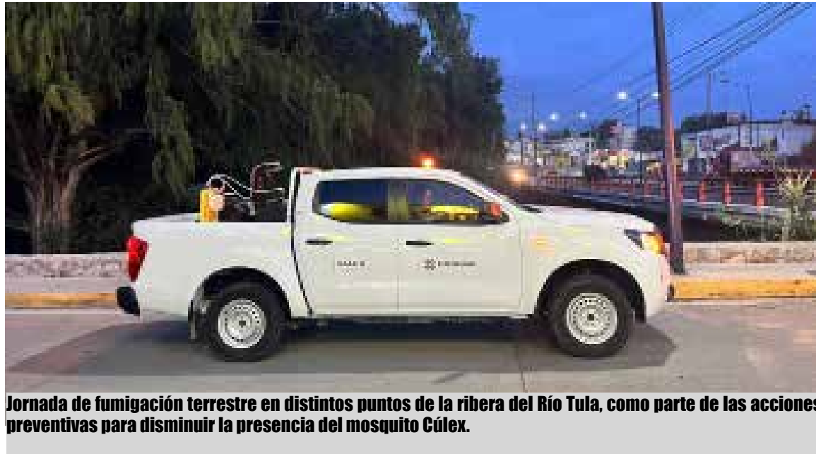
Jornada de fumigación terrestre en distintos puntos de la ribera del Río Tula, como parte de las acciones preventivas para disminuir la presencia del mosquito Cúlex.

la presa Endhó, lo que ha favorecido su reproducción y ha generado afectaciones en zonas cercanas al cauce del río. Los trabajos se llevaron a cabo en las colonias 20 de Noviembre, El Bondho, La Reforma, San Javier, Vista Hermosa y Centro, con el propósito de reducir la población de mosquitos y contribuir a la protección de la salud de los habitantes. Las autoridades también hicieron un llamado a la población para mantenerse informada a través de los canales