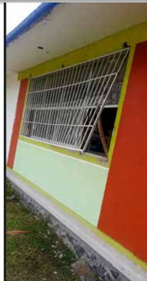
El robo provocó importantes afectaciones al funcionamiento del plantel, que brinda atención a niñas, niños y personas adultas mayores

situación que ha generado diversas reacciones entre habitantes y padres de familia. Hasta el momento, las autoridades no han informado sobre personas detenidas ni sobre la recuperación de los objetos robados.