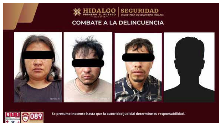
Aseguraron a cuatro personas presuntamente relacionadas con actividades ilícitas en el municipio y la región.

Asimismo, fue decomisada la camioneta en la que se trasladaban y tres equipos de telefonía celular vinculados con los hechos. Los individuos y los