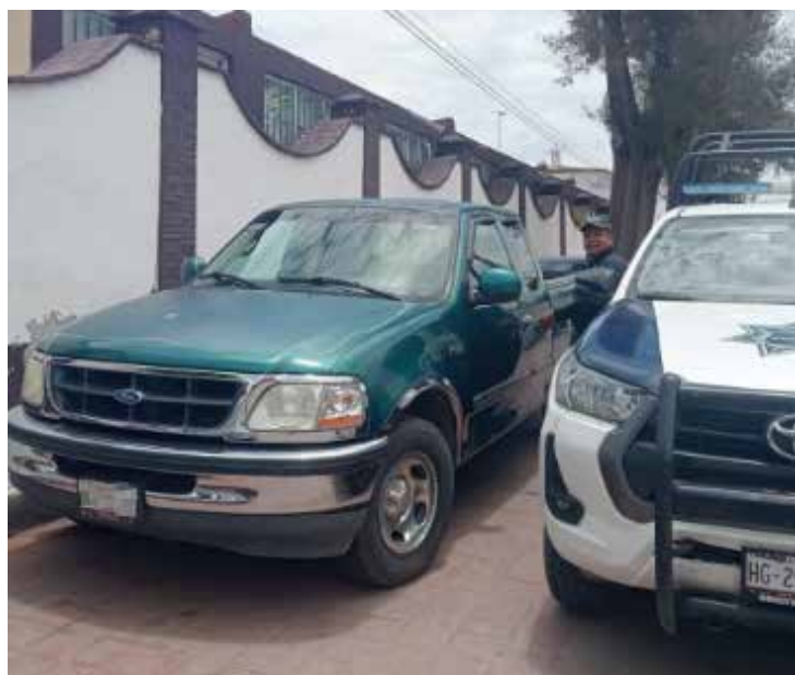
Policia detectó que el conductor de una camioneta se mostró nervioso quien posteriormente, descendió del vehículo para huir