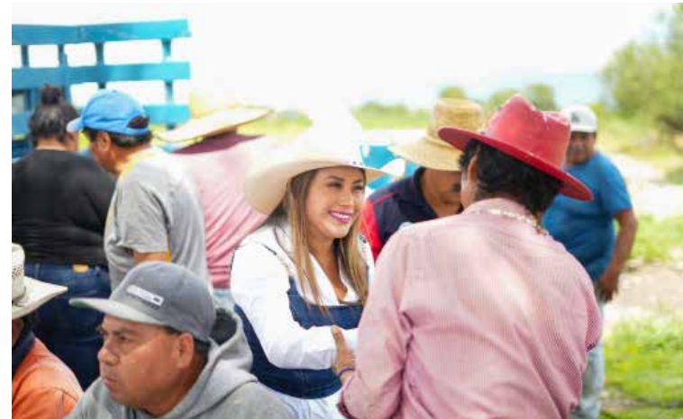
Las autoridades reiteraron su compromiso de mantener el trabajo coordinado con los habitantes de las diferentes comunidades

Con este tipo de apoyos, el gobierno municipal busca fortalecer la infraestructura comunitaria y atender necesidades prioritarias que contribuyan a mejorar la calidad de vida de los ciudadanos.