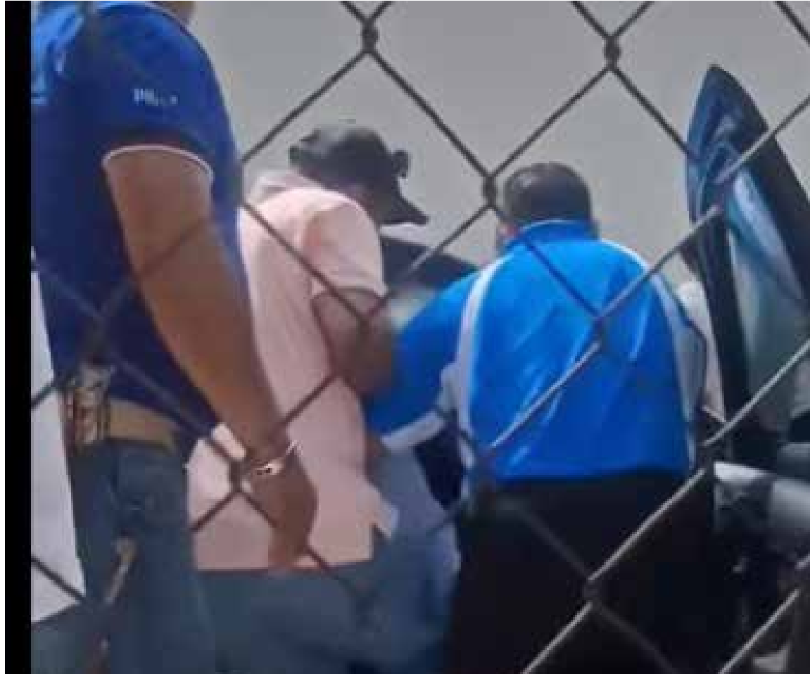
La comunidad deportiva, cuyos integrantes exigen que las autoridades investiguen los hechos y se aplique un castigo ejemplar

La agresión ha generado indignación entre la comunidad deportiva, cuyos integrantes exigen que las autoridades investiguen los hechos y se aplique un castigo ejemplar contra el responsable para evitar que este tipo de actos de violencia vuelvan a repetirse en las canchas.