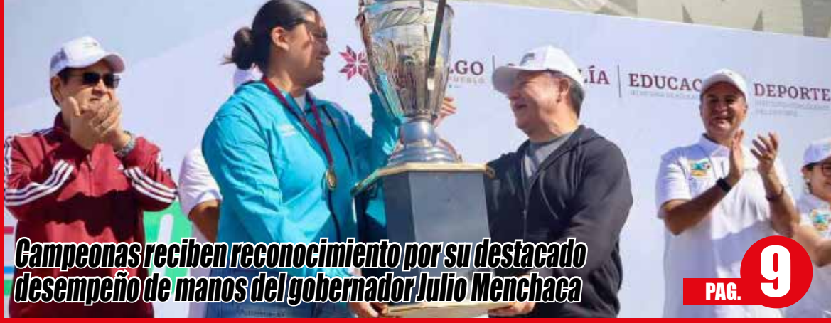
Campeonas reciben reconocimiento por su destacado desempeño de manos del gobernador Julio Menchaca