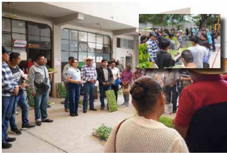
A través de la reciente entrega de plántulas y semillas de hortalizas, se benefició a 178 familias de las comunidades de El Jardín, Xochitlán, El Moreno, La Ranchería y la Zona Centro

A través de la reciente entrega de plántulas y semillas de hortalizas, se benefició a 178 familias de las comunidades de El Jardín, Xochitlán, El Moreno, La Ranchería y la Zona Centro, promoviendo la creación y fortalecimiento de huertos familiares, que ayudan a la economía familiar.