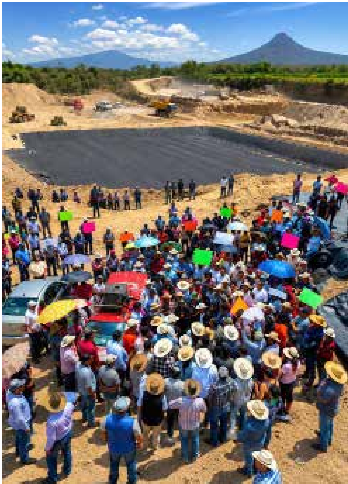
Los representantes ciudadanos señalaron que la inconformidad surgió debido a la falta de una consulta previa a la población y por el riesgo que, aseguran, representaba el proyecto para los mantos acuíferos de la región.

Con estos acuerdos, los habitantes que participaron en la movilización consideraron que su exigencia fue escuchada y celebraron que el proyecto quedara sin efecto, al menos en los términos establecidos en la minuta firmada este martes.