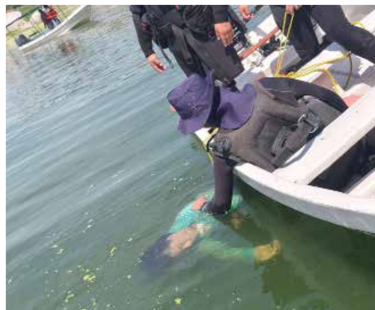
Cuerpos de emergencia y voluntarios participaron en las labores de búsqueda, logrando ubicar a las víctimas

Las autoridades continúan con las investigaciones para esclarecer las circunstancias de este lamentable hecho.