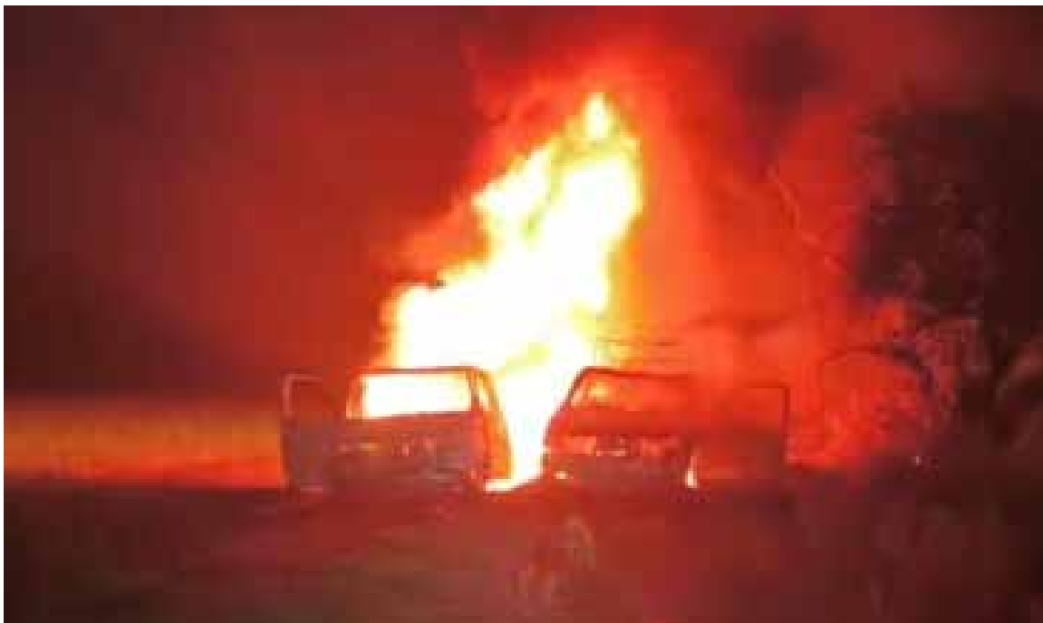
Hasta el momento no se ha informado sobre personas lesionadas y serán las autoridades competentes quienes determinen las causas del incendio

Hasta el momento no se ha informado sobre personas lesionadas y serán las autoridades competentes quienes determinen las causas del incendio y confirmen la situación en el lugar.