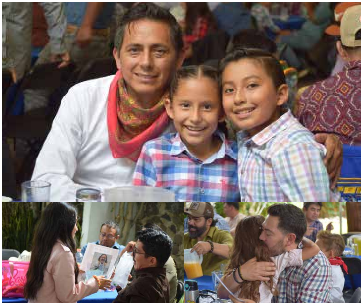
Colegio Calipedia Jean Piaget celebró el Día del Padre con una divertida tarde vaquera

Progreso de Obregón.- En un ambiente de alegría, convivencia y unión familiar, el nivel primaria del Colegio Calipedia Jean Piaget celebró el Día del Padre con una divertida tarde vaquera, donde los festejados fueron los protagonistas de una jornada llena de sorpresas. Ataviados con la temática de vaqueros y vaqueras, padres de familia participaron en diversas actividades organizadas especialmente para reconocer su esfuerzo y dedicación. Durante el evento, los alumnos les dedicaron emotivos cantos y les entregaron obsequios elaborados por ellos mismos como muestra de