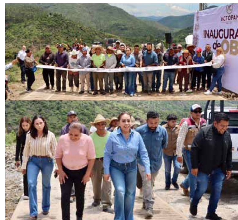
Cuéllar Cano recordó que con esta ya son 69 obras inauguradas en lo que va de su administración

Concluyó destacando que todas estas obras no serían posible sin el apoyo del Ayuntamiento; “porque la presidencia propone; pero las y los regidores, los síndicos son quienes aprueban los recursos para ejecutarlas”, finalizó.