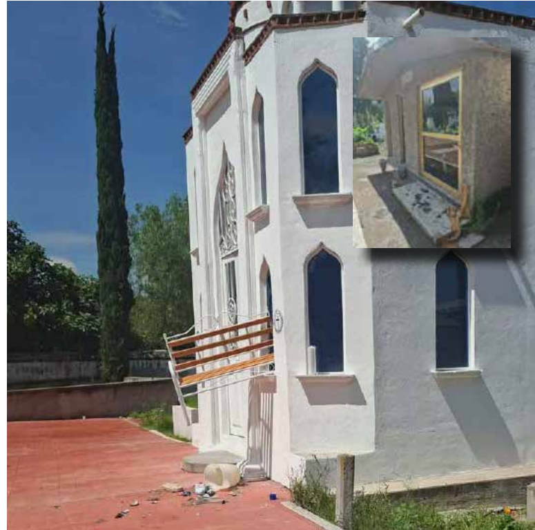
Los responsables provocaron afectaciones materiales en varias estructuras funerarias, dejando una escena que causó molestia y tristeza entre familiares de personas sepultadas

En medio de la polémica, diversas voces señalan que estos acontecimientos tendrían su origen en la confrontación de grupos antagónicos al gobierno municipal, los cuales buscan generar inestabilidad y descontento social en el municipio. Sin embargo, ciudadanos han manifestado que ninguna disputa justifica acciones que atenten contra la dignidad de los fallecidos y el sentimiento de las familias que acuden al panteón para honrar la memoria de sus seres queridos.