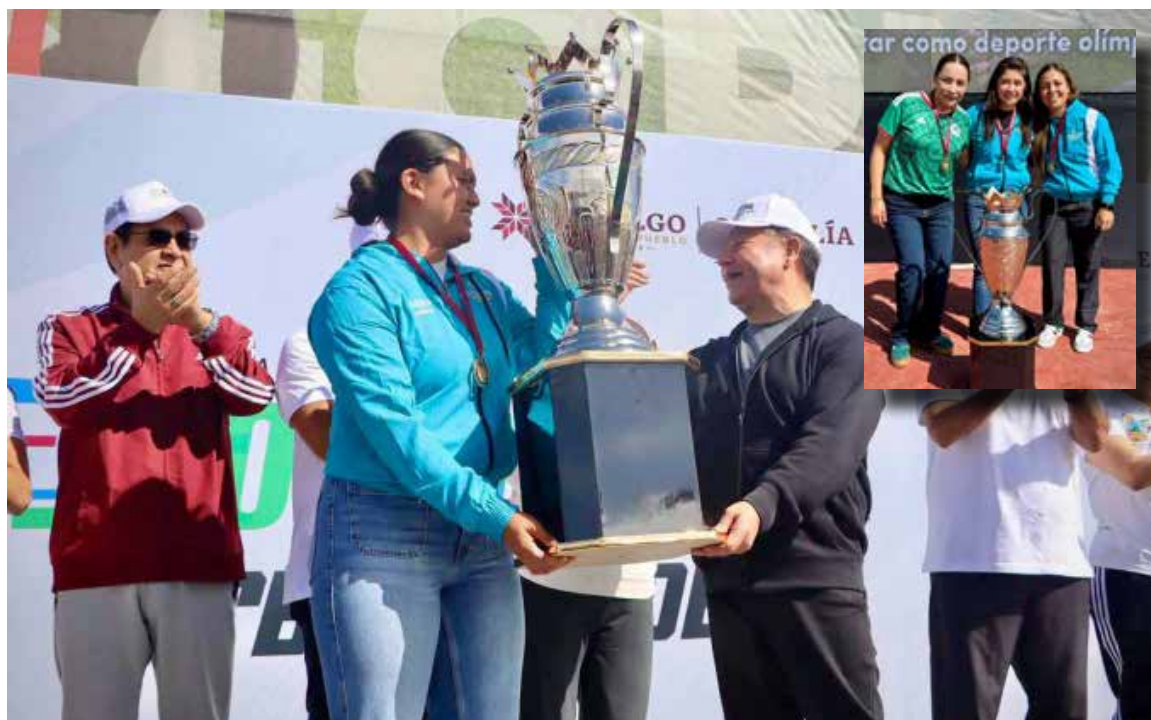
El reconocimiento destacó el esfuerzo, la disciplina y el talento de las jugadoras que lograron coronarse campeonas estatales tras una destacada participación

Con este logro, las campeonas continúan poniendo en alto el nombre de Atitalaquia y refrendan el potencial deportivo de la región