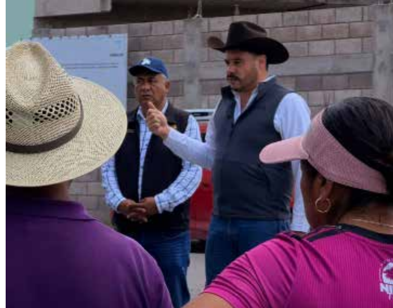
El alcalde destacó que escuchar de manera directa las necesidades de la población permite impulsar acciones que respondan a las demandas reales

de la población permite impulsar acciones que respondan a las demandas reales y urgentes de cada comunidad. Con estas acciones, el Gobierno Municipal de Tetepango continúa fortaleciendo la participación ciudadana y trabajando para brindar calles más seguras, iluminadas y con mejores condiciones para todas y todos.