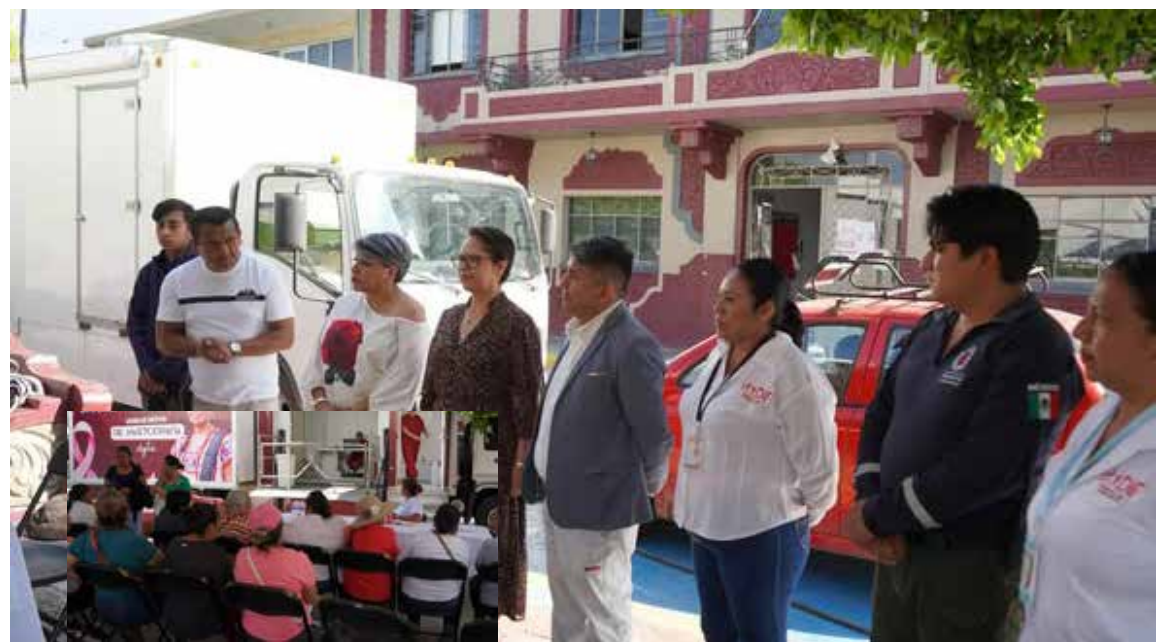
El Gobierno Municipal agradece la participación de las beneficiarias, así como el respaldo de las instituciones involucradas para hacer posible esta iniciativa

El Gobierno Municipal agradece la participación de las beneficiarias, así como el respaldo de las instituciones involucradas para hacer posible esta iniciativa, reafirmando su compromiso de seguir impulsando acciones que promuevan el bienestar y la salud de las familias progresenses.