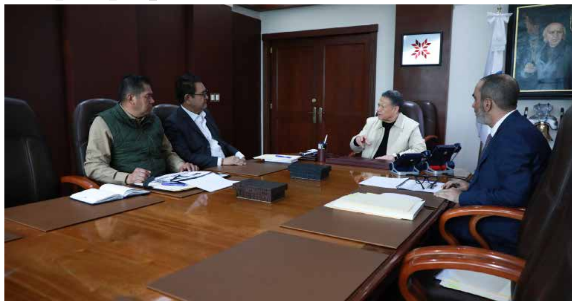
Durante la reunión semanal, se detalló que en el municipio de Tizayuca fue rescatado ileso un hombre que había sido privado de su libertad

A la par, en Atotonilco de Tula y Tezontepec de Aldama se aseguraron 18 mil 835 litros de hidrocarburo ilegal, tres camionetas pick up, una van y diversos contenedores; también se detuvo a un hombre y fueron clausuradas dos tomas clandestinas conectadas a mangueras de alta presión que atravesaba el drenaje a un ducto de Petróleos Mexicanos. Además, derivado de una denuncia anónima al 089, se dio a conocer que se evitó el traslado de más de 10 kilos de marihuana mediante un servicio de paquetería exprés; mientras que, en nueve municipios más, gracias a los operativos permanentes, se arrestaron a 12 personas y se incautaron 2 mil 141 dosis de