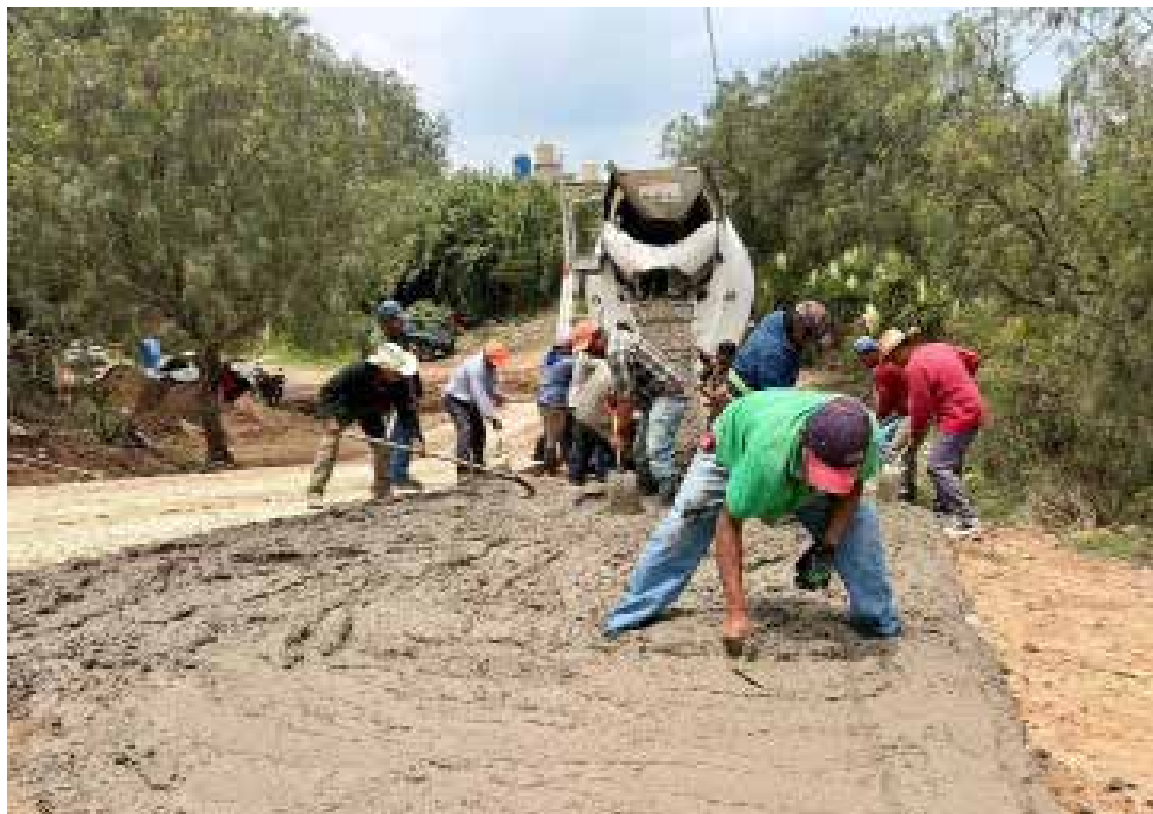
Trabajos de pavimentación de la calle Prolongación Lázaro Cárdenas, en la comunidad Melchor Ocampo "El Salto".

Autoridades municipales señalaron que este tipo de acciones forman parte de las estrategias para fortalecer la infraestructura y atender las necesidades de las comunidades.