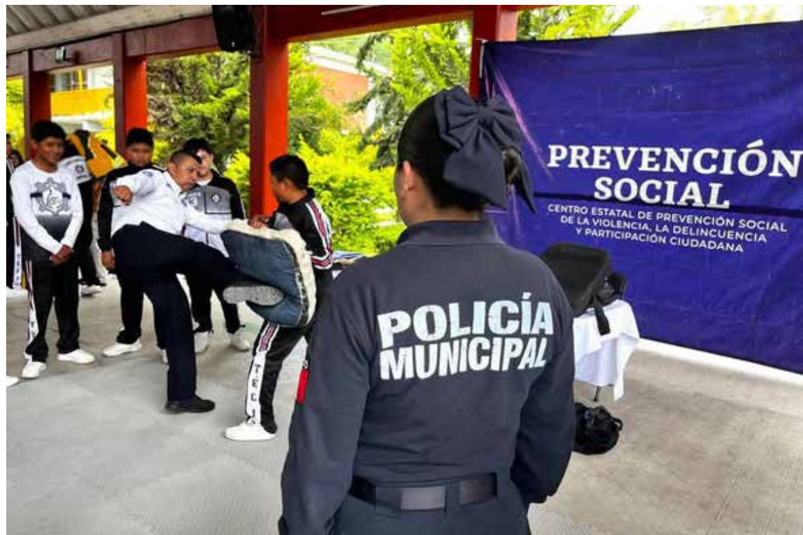
La jornada fue organizada por Seguridad Pública y Tránsito Municipal, en coordinación con el Centro Estatal de Prevención

con el Centro Estatal de Prevención, e incluyó actividades lúdicas, dinámicas de educación vial y espacios informativos sobre los servicios de apoyo disponibles ante situaciones de riesgo. Durante el evento se instalaron módulos del C5i, Policía Violeta, Unidad Canina K-9, Bomberos y otras áreas especializadas, donde las y los estudiantes interactuaron con personal de las distintas corporaciones.