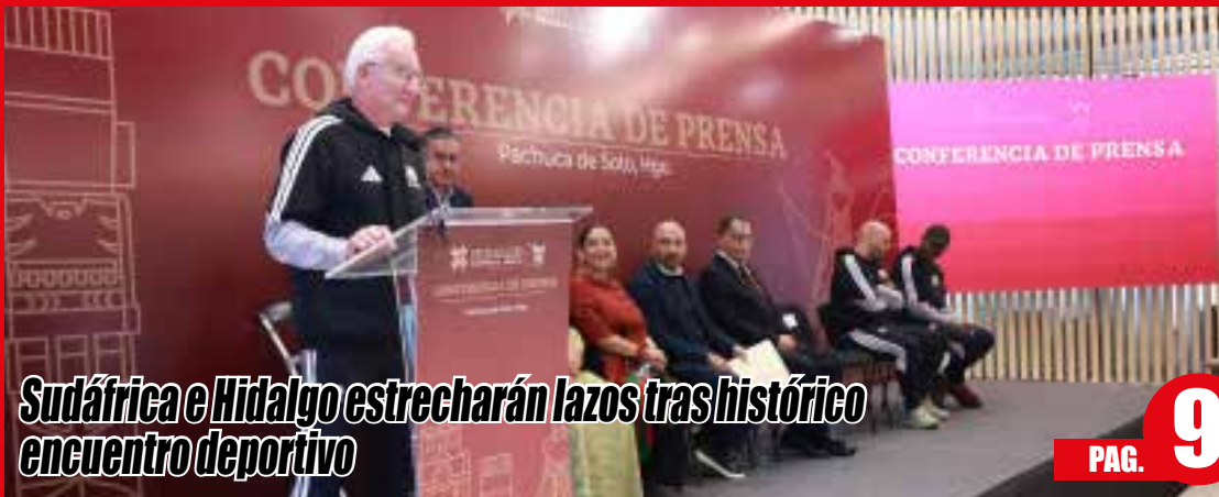
Sudáfrica e Hidalgo estrecharán lazos tras histórico encuentro deportivo