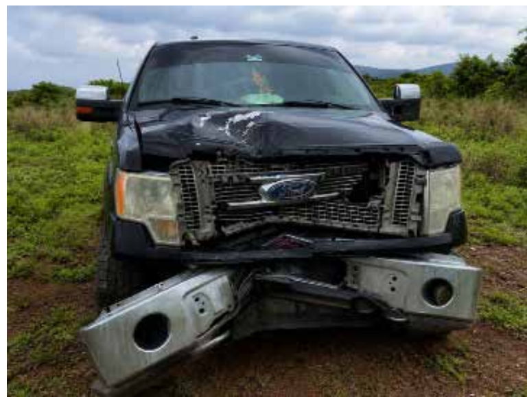
Tras el accidente, presuntamente el conductor habría abandonado la unidad y se retiró del lugar

Lobo color negro con placas de circulación del estado de Michoacán. Tras el accidente, presuntamente el conductor habría abandonado la unidad y se retiró del lugar antes de la llegada de las autoridades, sin que hasta el momento se reportara su localización. Elementos de seguridad pública implementaron un perímetro de resguardo en la zona y dieron aviso