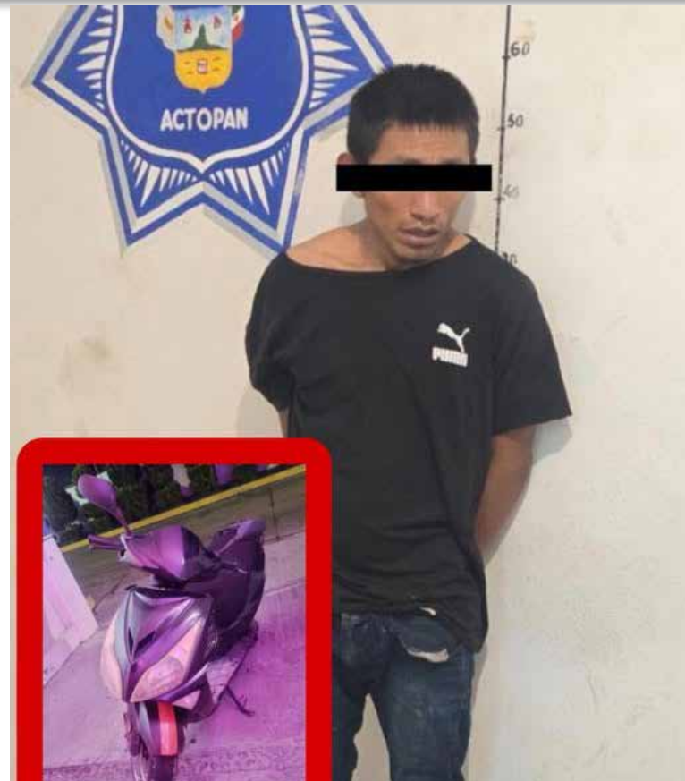
Realizaron el aseguramiento de un masculino que circulaba en una motocicleta la cual resultó con reporte de robo