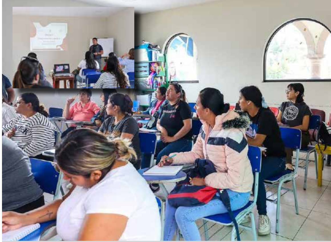
Durante el curso, las y los participantes aprenderán técnicas fundamentales de primeros auxilios

brindan herramientas prácticas para la atención inicial de emergencias mientras llegan los servicios especializados. Durante el curso, las y los participantes aprenderán técnicas fundamentales de primeros auxilios, fortaleciendo sus capacidades para responder de manera adecuada en distintos escenarios y contribuir a la seguridad de sus comunidades. Con estas acciones, el municipio continúa impulsando actividades enfocadas en la prevención y la capacitación ciudadana, fomentando una cultura de protección y respuesta responsable ante cualquier eventualidad.