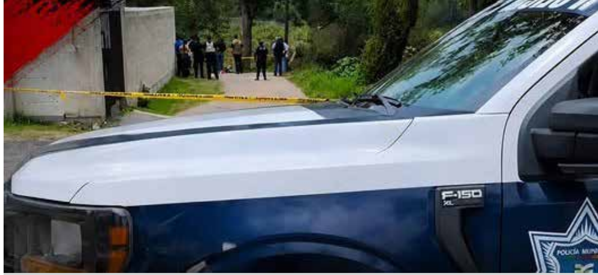
Las víctimas se encontraban en un camino de terracería cercano al panteón de la localidad cuando fueron atacadas

La zona fue acordonada y se dio aviso a la Procuraduría General de Justicia del Estado de Hidalgo. Posteriormente, peritos y agentes de investigación realizaron las diligencias correspondientes y ordenaron el traslado de los cuerpos al Servicio Médico Forense para los estudios de ley.