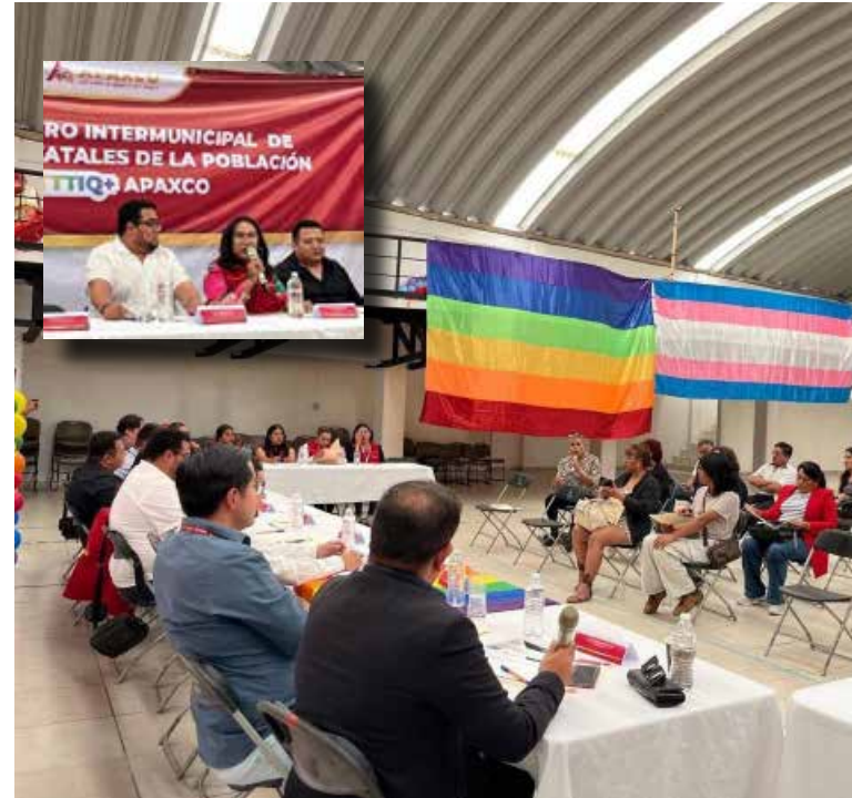
El DIF Atitalaquia reafirma su compromiso de promover una atención basada en la igualdad, la dignidad y el respeto a los derechos de todas las personas

la participación de representantes del Valle del Mezquital y del presidente del Congreso LGTBTTIQ+ del Estado de México, quienes compartieron herramientas y propuestas orientadas a fortalecer las políticas de inclusión y respeto a la diversidad. Con estas acciones, el DIF Atitalaquia reafirma su compromiso de promover una atención basada en la igualdad, la dignidad y el respeto a los derechos de todas las personas, contribuyendo a la construcción de una sociedad más incluyente y equitativa.