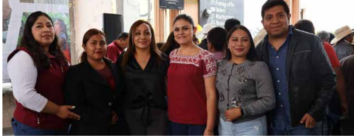
Las autoridades reiteraron que este tipo de acciones buscan brindar herramientas y conocimientos que permitan mejorar el rendimiento de los cultivos