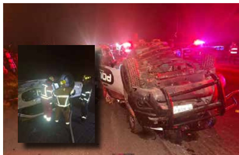
Paramédicos acudieron al sitio localizando dentro de la unidad policiaca el cuerpo, lamentablemente ya sin signos vitales, del oficial de la Policía