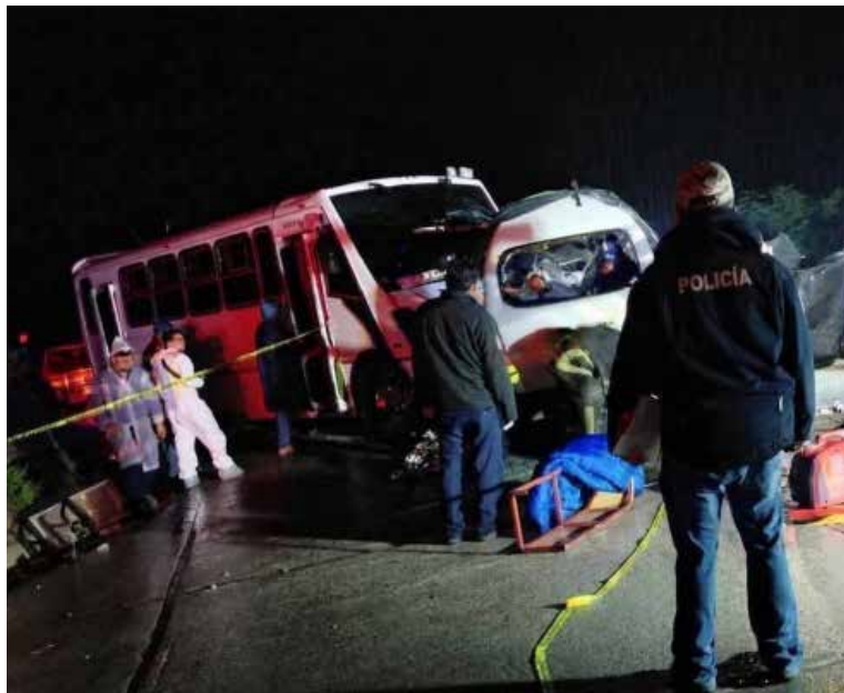
Los primeros reportes indican que el saldo preliminar es de cuatro personas fallecidas y seis lesionadas

Cardonal, Hidalgo.- Un trágico accidente se registró este sábado en la zona de las Grutas de Tolantongo, donde al menos dos vehículos se vieron involucrados en accidente, entre ellos una unidad de transporte que trasladaba turistas. De acuerdo con información preliminar, el percance movilizó a numerosas corporaciones de emergencia de la región. Ambulancias de Ixmiquilpan, Alfajayuca y Cardonal acudieron al lugar para brindar atención a las víctimas. Asimismo, equipos especializados de rescate se trasladaron a la zona con herramientas de extracción hidráulica y equipo de rescate vertical debido a las condiciones del terreno