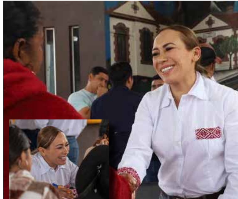
Las autoridades municipales destacaron que estos ejercicios de participación ciudadana permiten identificar prioridades y fortalecer la elaboración de políticas pública

Con estas actividades, el Gobierno Municipal reafirma su compromiso de impulsar una planeación incluyente, basada en el diálogo y la colaboración entre ciudadanía y autoridades.