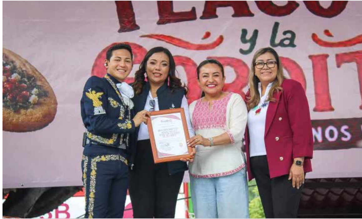
Autoridades municipales y representantes del ámbito cultural participaron en la clausura del festival

Autoridades municipales y representantes del ámbito cultural participaron en la clausura del festival, destacando la importancia de preservar y promover las costumbres gastronómicas como parte del patrimonio de la región.