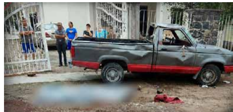
El accidente ocurrió a la altura de la colonia Lázaro Cárdenas, en las inmediaciones del canal ubicado en la entrada de la comunidad de Remedios