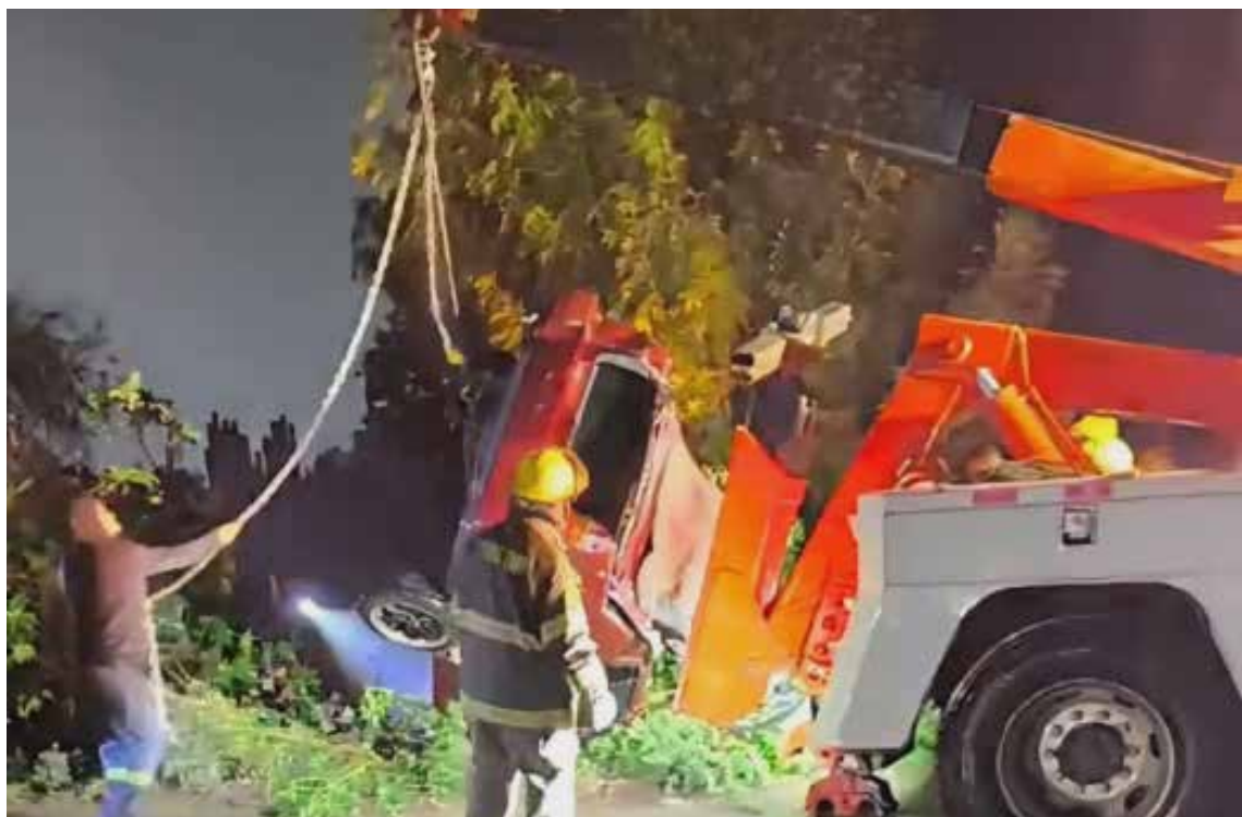
Las autoridades correspondientes se encargaron de las diligencias para el levantamiento del cuerpo

Las autoridades correspondientes se encargaron de las diligencias para el levantamiento del cuerpo e iniciaron las investigaciones para esclarecer lo ocurrido.