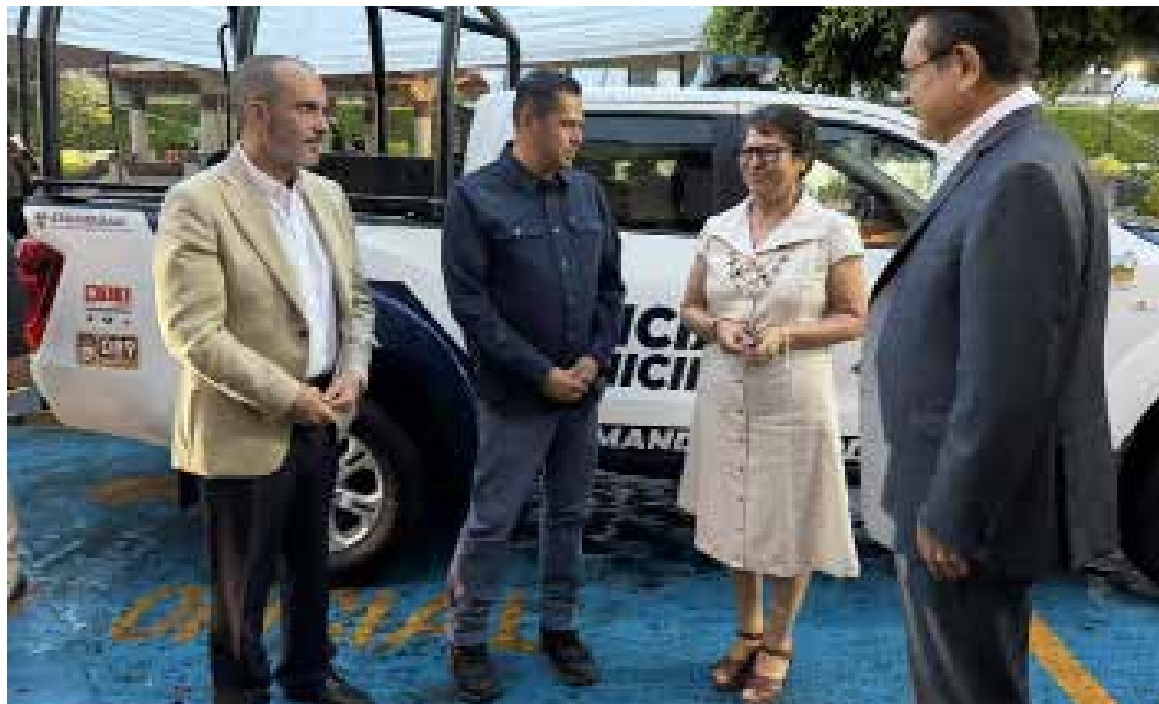
Durante el evento se realizó el nombramiento del nuevo titular de la Dirección de Seguridad Pública Municipal

Con la adhesión de Progreso de Obregón al Mando Coordinado, se busca fortalecer la coordinación entre los distintos órdenes de gobierno en materia de seguridad pública, así como mejorar las estrategias para la prevención y combate de la delincuencia en beneficio de la población.