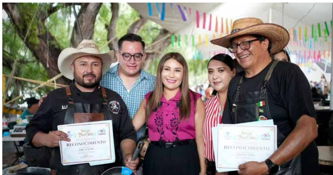
La actividad reunió a participantes y asistentes en un espacio dedicado a promover las tradiciones culinarias

Autoridades y público reconocieron el esfuerzo de quienes participan en la preservación de la gastronomía tradicional, considerada un elemento importante del patrimonio cultural de la comunidad.