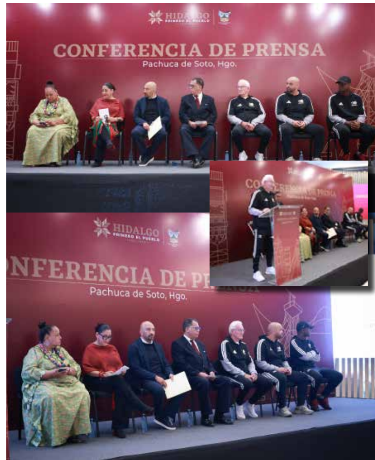
Hidalgo se consolida como un escaparate internacional de unidad y competitividad, resultado de la estrategia de internacionalización del gobernador Julio Menchaca Salazar.