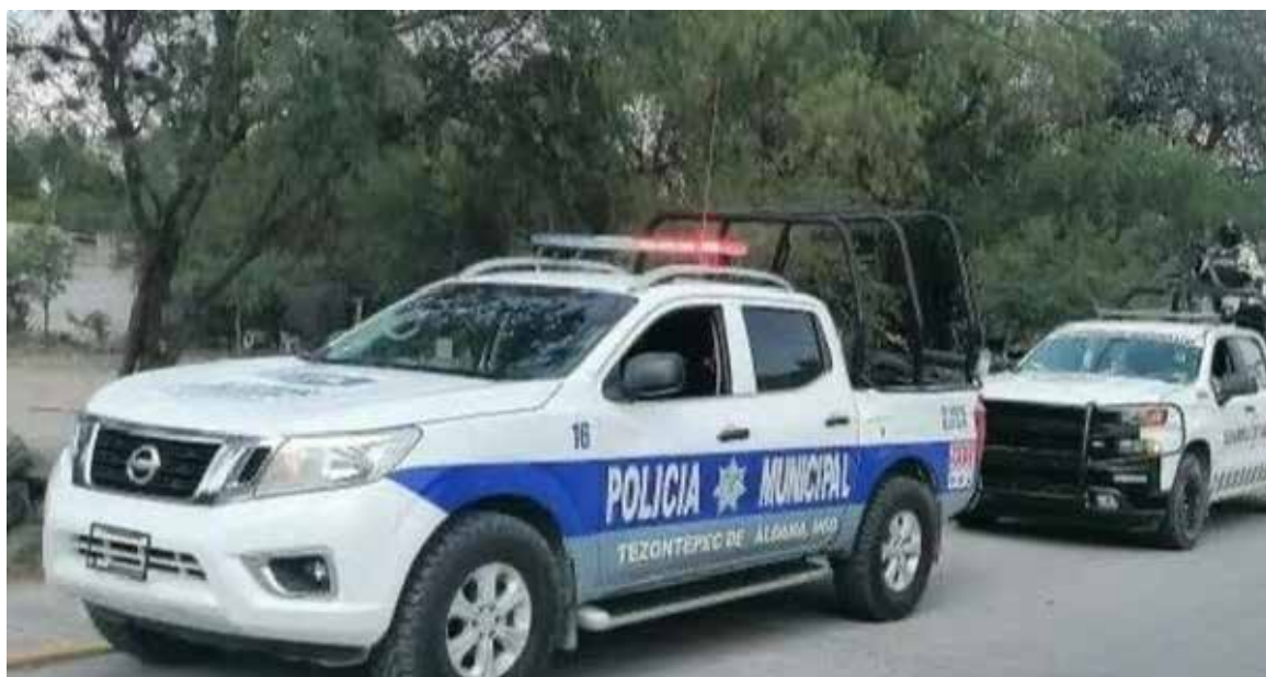
Las autoridades informaron que la víctima presentaba diversas lesiones y en el lugar fueron localizados indicios que ya son analizados como parte de las investigaciones

La zona fue acordonada para permitir las diligencias de la Procuraduría General de Justicia del Estado de Hidalgo, instancia que inició una carpeta de investigación para esclarecer los hechos y determinar las circunstancias en las que ocurrió el fallecimiento.