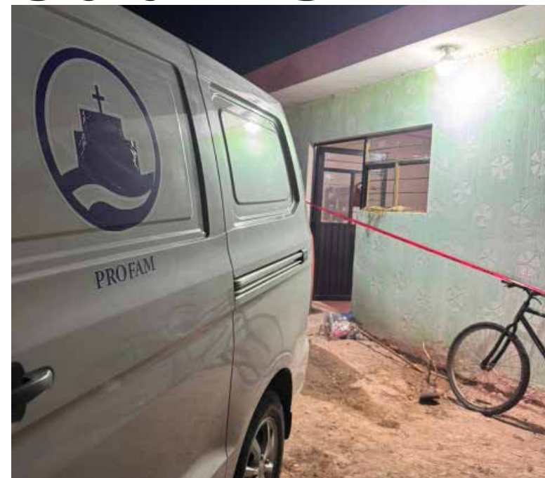
Sujetos desconocidos habrían ingresado al domicilio y atacado a la víctima cuando se encontraba en una de las habitaciones

Elementos de seguridad acordonaron la zona en espera del personal de servicios periciales de la Procuraduría General de Justicia del Estado de Hidalgo para realizar las diligencias correspondientes para esclarecer los hechos.