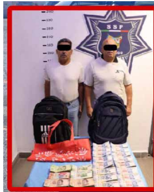
De acuerdo con la información oficial, la víctima había realizado retiros en sucursales bancarias ubicadas en una plaza comercial de la ciudad

Uno de ellos abordó un autobús con destino a la