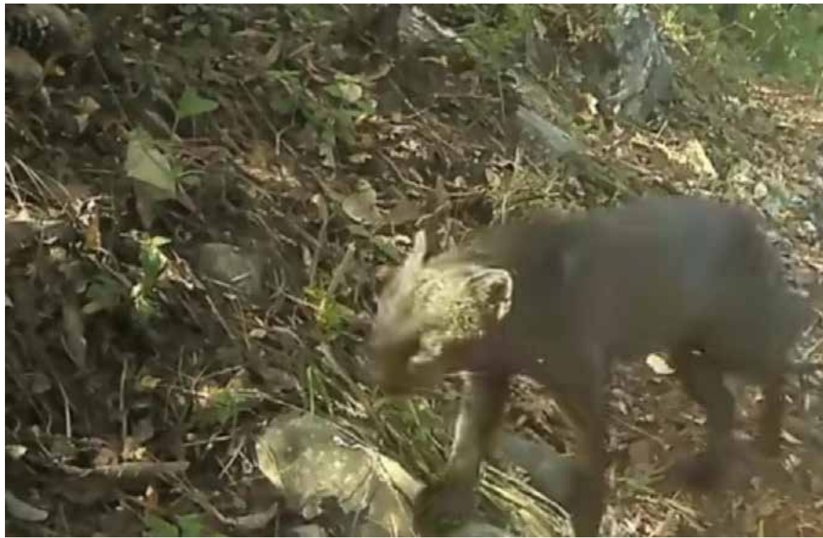
El avistamiento fue posible gracias al monitoreo permanente mediante cámaras trampa instaladas en distintos puntos

Este hallazgo reafirma la riqueza natural de Zimapán y la importancia de continuar impulsando acciones de protección y conservación de la biodiversidad en la región.