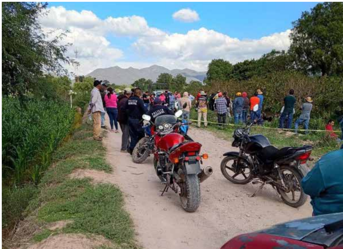
Sujetos desconocidos habrían ingresado al domicilio y atacado a la víctima cuando se encontraba en una de las habitaciones