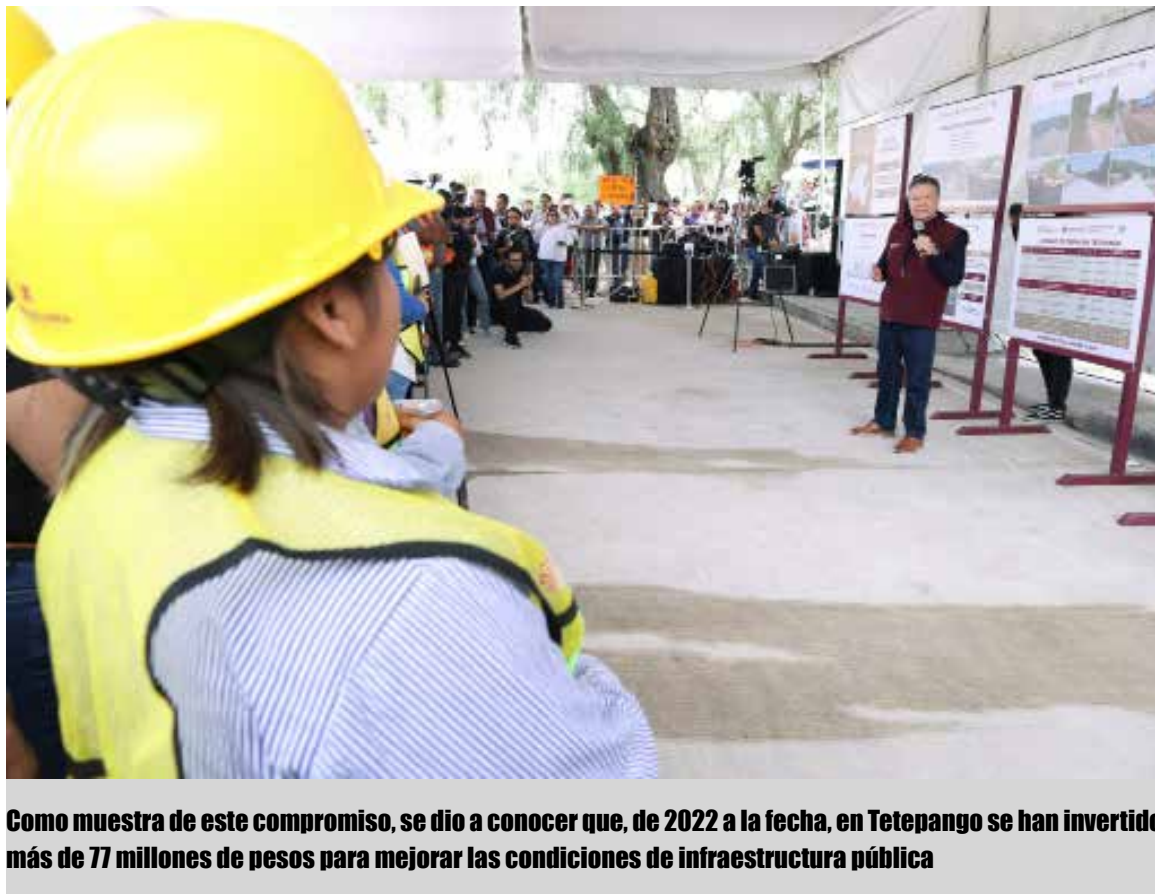
Como muestra de este compromiso, se dio a conocer que, de 2022 a la fecha, en Tetepango se han invertido más de 77 millones de pesos para mejorar las condiciones de infraestructura pública

Tetepango. - Como parte de las Rutas de la Transformación, en días pasados el gobernador Julio Menchaca Salazar sostuvo una gira de trabajo en Tetepango para supervisar la pavimentación hidráulica en el libramiento Xitri-Rojo Gómez, donde se invirtieron 21 millones 540 mil 533 pesos, a fin de mejorar la movilidad y la conectividad regional.