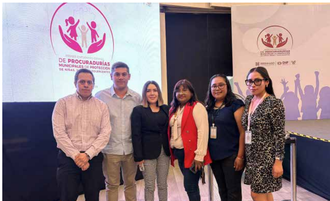
Autoridades destacaron que este tipo de encuentros contribuyen a consolidar acciones conjuntas orientadas a garantizar entornos más seguros

Autoridades destacaron que este tipo de encuentros contribuyen a consolidar acciones conjuntas orientadas a garantizar entornos más seguros, inclusivos y favorables para el desarrollo integral de la infancia y adolescencia.