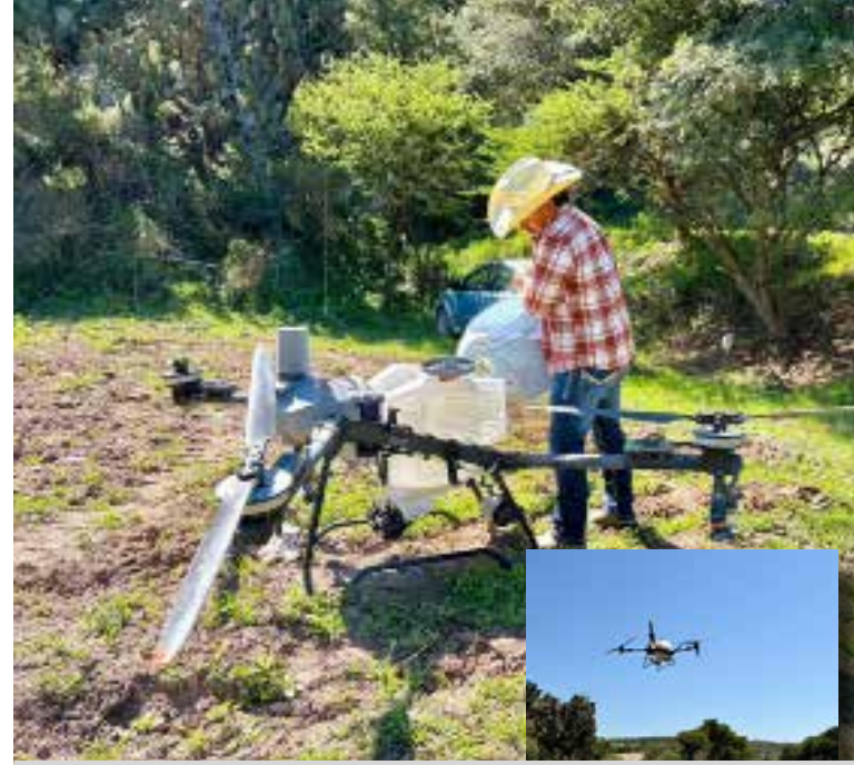
Agropecuario, el Gobierno Municipal de Tepeji del Río continúa impulsando el uso de nuevas tecnologías en beneficio de las y los productores del municipio.

Asimismo, la administración municipal reiteró su compromiso de continuar trabajando de manera coordinada con las y los productores para impulsar el desarrollo agropecuario de Tepeji del Río y generar mejores condiciones para el crecimiento del sector.