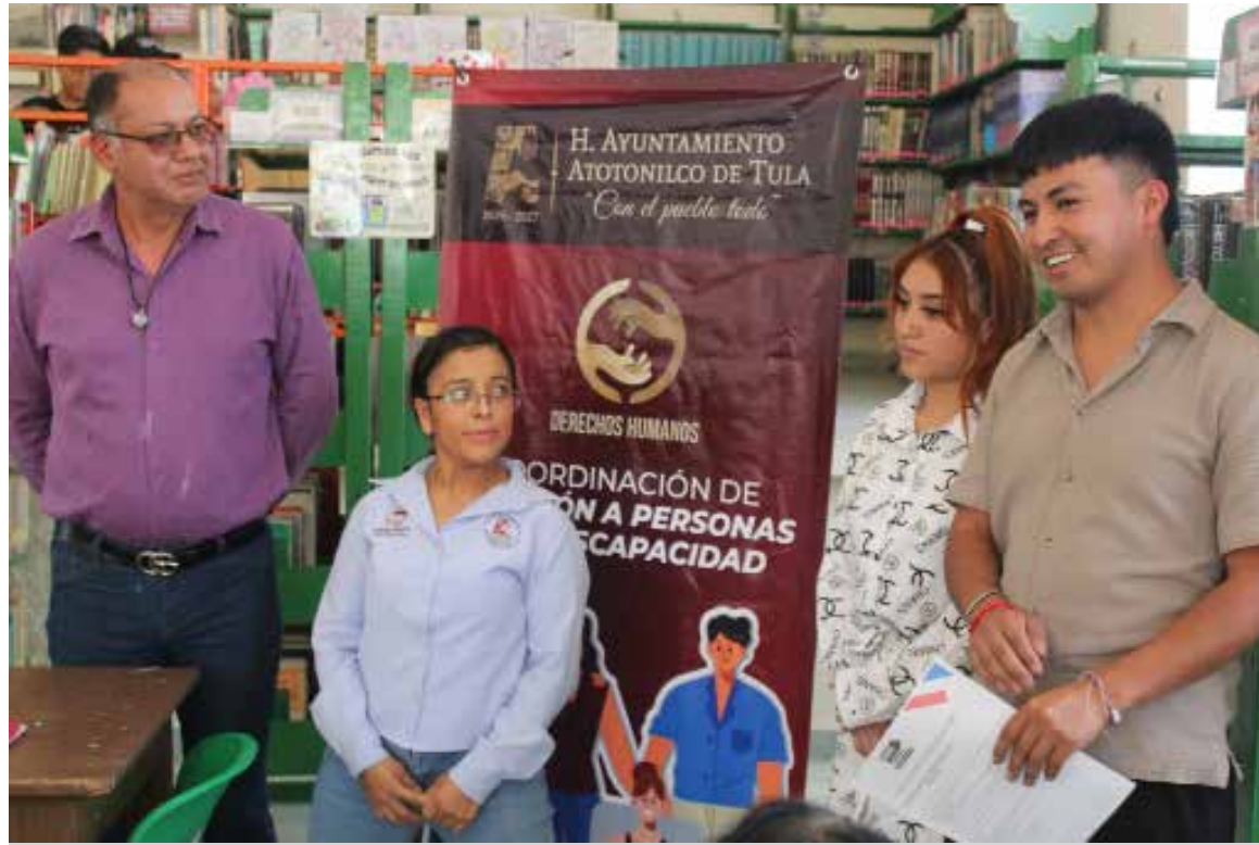
Autoridades municipales destacaron la importancia de continuar impulsando espacios de capacitación

Autoridades municipales destacaron la importancia de continuar impulsando espacios de capacitación que permitan a las y los participantes adquirir nuevas habilidades y herramientas para su desarrollo personal y económico.