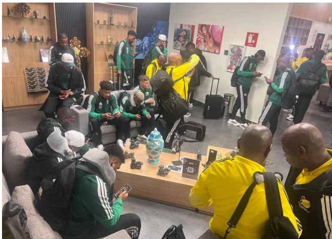
Con su llegada, Hidalgo se coloca nuevamente en los reflectores internacionales al recibir a una selección nacional

Con su llegada, Hidalgo se coloca nuevamente en los reflectores internacionales al recibir a una selección nacional que se prepara para importantes compromisos en el escenario mundial.