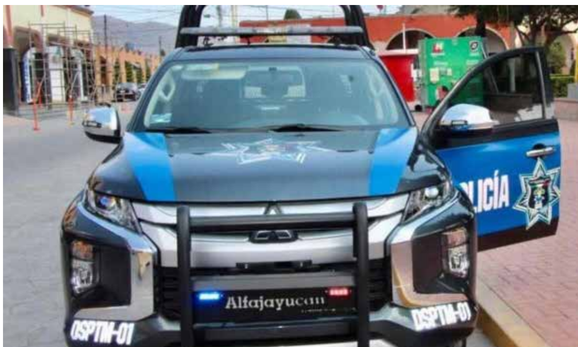
Tras la agresión, el presunto responsable se retiró del lugar a bordo de una motocicleta