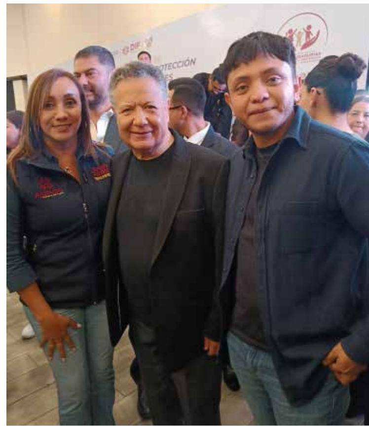
Primer Encuentro Estatal de Procuradurías Municipales de Protección de Niñas, Niños y Adolescentes.

que contribuyan al bienestar de niñas, niños y adolescentes, así como a la construcción de entornos más seguros e incluyentes. Autoridades municipales reafirmaron su compromiso de continuar trabajando en acciones orientadas a proteger y fortalecer el desarrollo integral de las nuevas generaciones en Ajacuba.