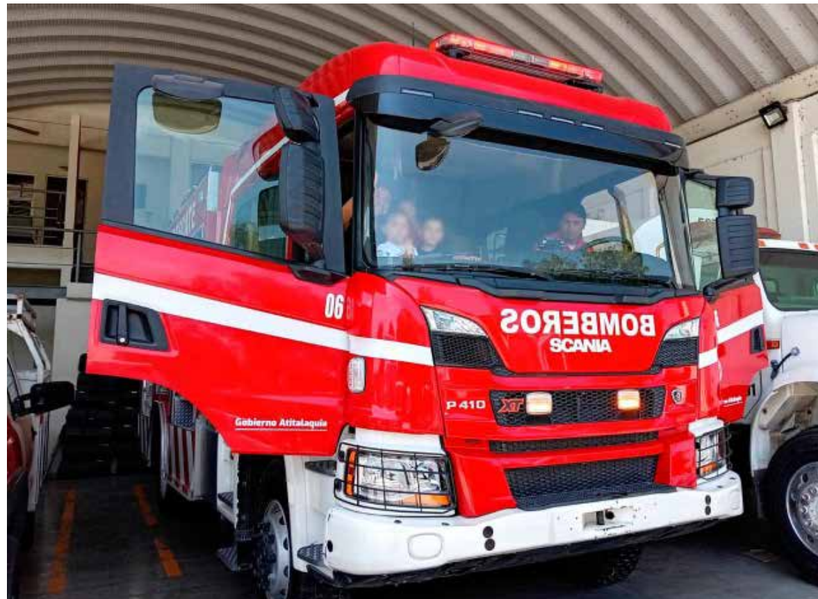
El Gobierno de la Transformación de Atitalaquia impulsa estos encuentros porque sabe que la seguridad también se construye con cercanía, valores y educación

el departamento de Bomberos de Atitalaquia. En compañía del personal, jugaron con el equipo, aprendieron sobre prevención y descubrieron la importancia de la labor que realizan todos los días para proteger al pueblo. Asimismo, se trabajó en coordinación con el área de Proximidad Social de la Policía Municipal de Atitalaquia, fortaleciendo la confianza y el vínculo entre las instituciones y la comunidad desde la primera infancia. El Gobierno de la Transformación de Atitalaquia impulsa estos encuentros porque sabe que la seguridad también