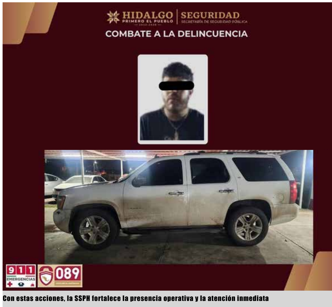
Con estas acciones, la SSPH fortalece la presencia operativa y la atención inmediata

un arma larga de alto poder tipo fusil calibre .223, un arma corta calibre 9 milímetros y municiones. Además, fueron aseguradas 372 dosis de hierba verde seca con características de la marihuana, 66 dosis de presunta cocaína y la camioneta en la que el sujeto se transportaba, quedando todo a disposición de la autoridad ministerial para el seguimiento de las investigaciones. Con estas acciones, la SSPH fortalece la presencia operativa y la atención inmediata ante situaciones que representan riesgo para la población.