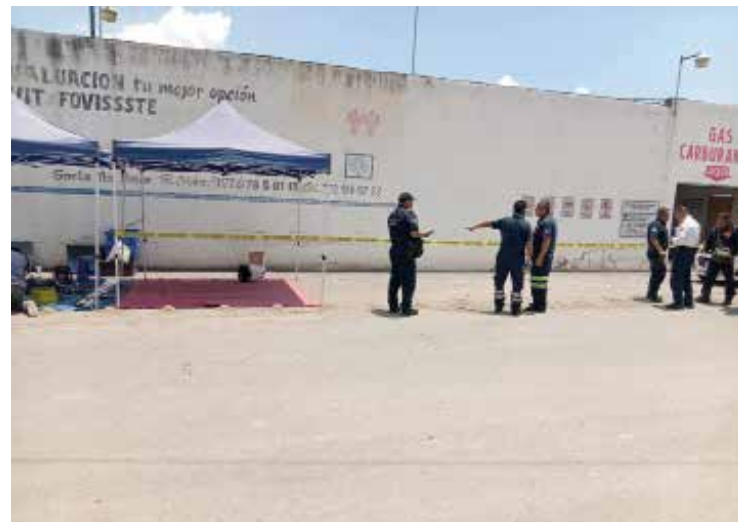
En el mismo hecho también resultó herido un trabajador de la estación, identificado como despachador de la planta.

elementos de la Policía médica especializada. Por su parte, autoridades ya arribaron al sitio para atender la situación y acordonar el área, mientras se realizaban las primeras diligencias.