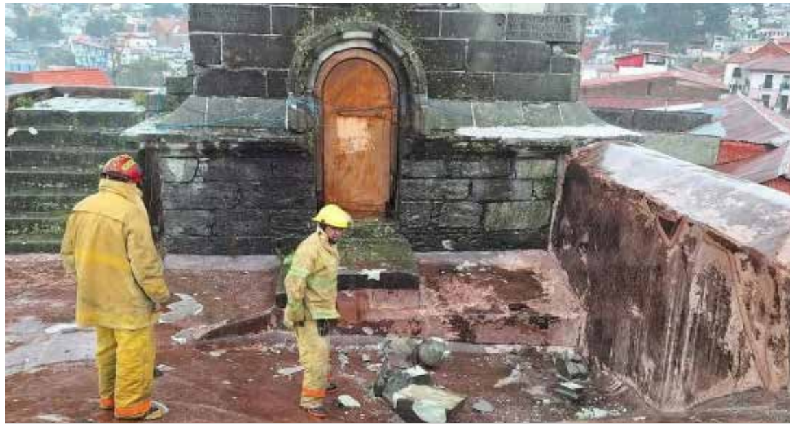
Se indicó que el sistema de protección contra descargas eléctricas habría sido retirado de forma temporal debido a trabajos de mantenimiento y remodelación

La zona permanece bajo vigilancia preventiva mientras se evalúan los daños ocasionados por el fenómeno.