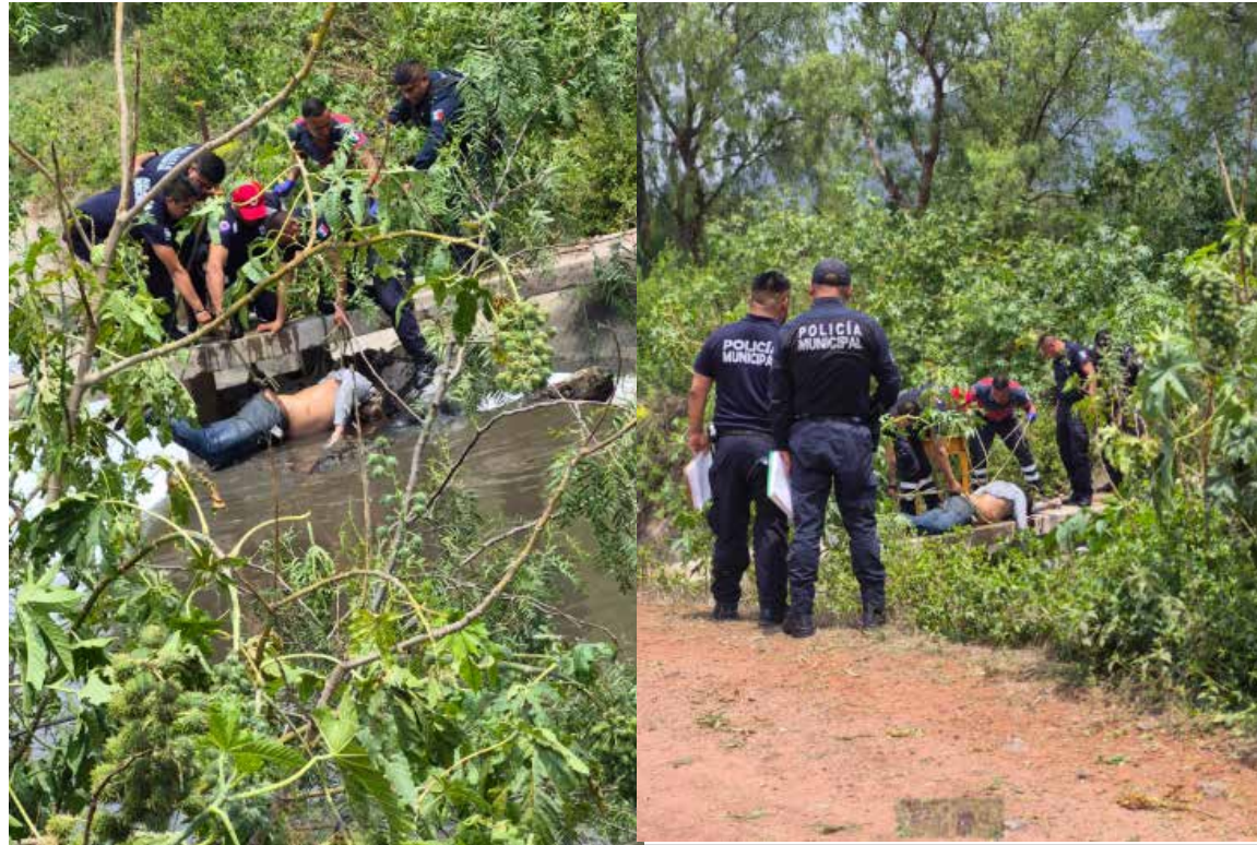
Cuerpo sin vida de una persona del género masculino que se encontraba dentro de la corriente de agua del Canal Requena

Autoridades acudieron al sitio para realizar la extracción del cuerpo de la corriente de aguas negras y esperar la llegada de los peritos especializados de la Procuraduría General de Justicia del Estado de Hidalgo para iniciar con los indagatorias correspondientes.