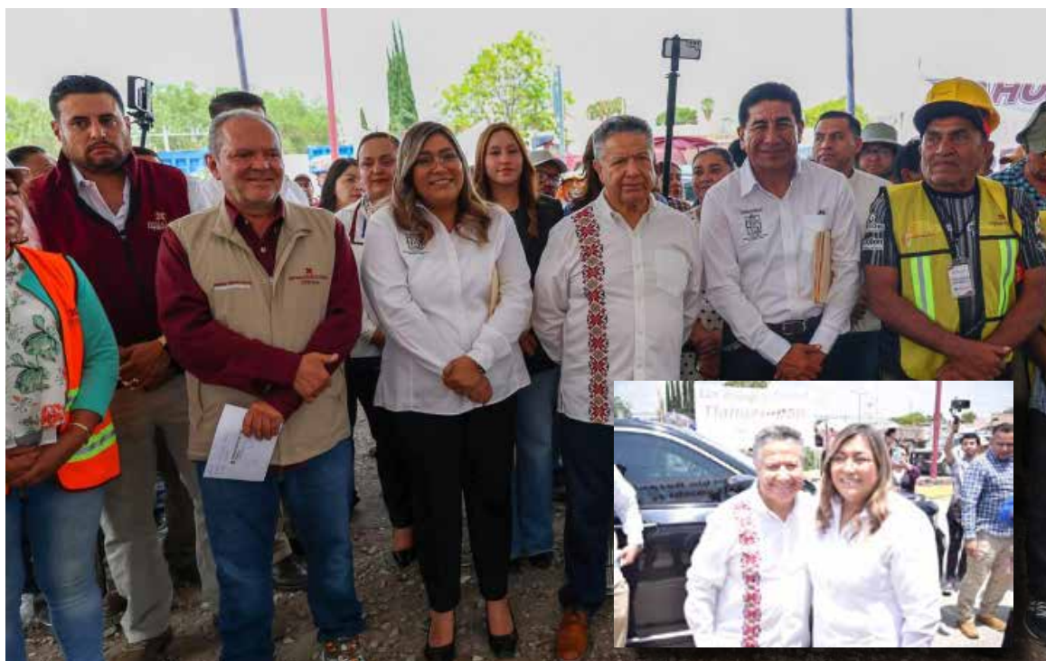
Durante la inauguración de esta importante obra, autoridades destacaron que este proyecto contribuye al desarrollo vial y a una mejor movilidad

220 pesos y 97 centavos, destinada a trabajos de pavimentación, alumbrado público, señalamiento horizontal y construcción de banquetas. A esta acción se suma la aportación del Gobierno Municipal por más de 1.6 millones de pesos para complementar la obra y mejorar su entorno urbano. Durante la inauguración de esta importante obra, autoridades destacaron que este proyecto contribuye al desarrollo vial y a una mejor movilidad para las familias del municipio.