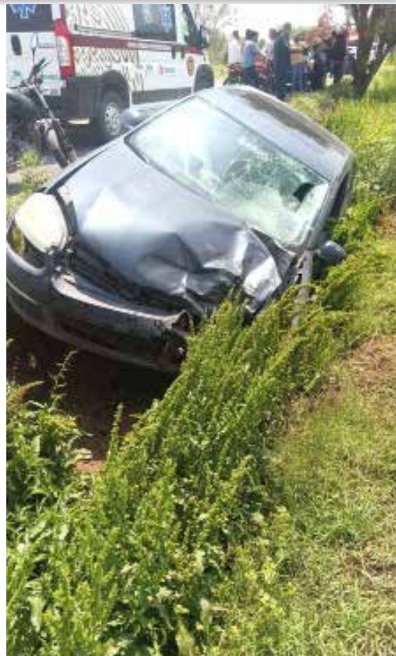
Autoridades localizaron al conductor de la motocicleta tendido en el piso sin signos vitales y abandonado el automóvil responsable