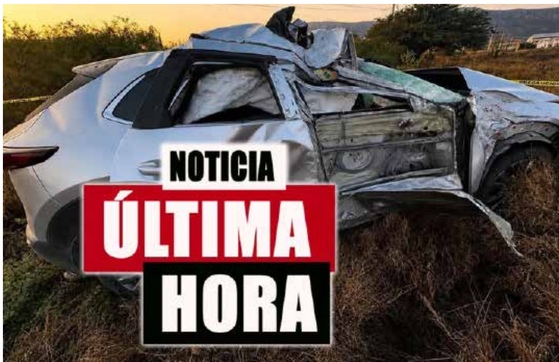
En el vehículo viajaban al menos cinco personas; no obstante, al momento de la llegada de los servicios de emergencia únicamente fueron encontrados tres masculinos.

El fuerte impacto ocasionó además afectaciones en la red eléctrica y cortes de energía en la zona. Al lugar acudieron elementos de Seguridad Pública Municipal, Protección Civil, Policía Estatal y trabajadores de CFE para realizar las maniobras y atender la emergencia