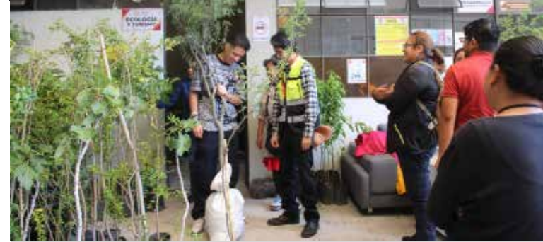
Con estas acciones, el Gobierno Municipal continúa promoviendo el cuidado, conservación y aprovechamiento sustentable de los recursos naturales