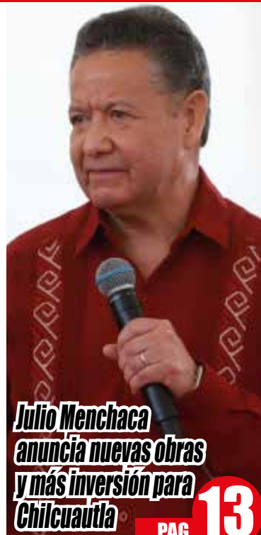
Julio Menchaca anuncia nuevas obras y más inversión para Chilcuautla