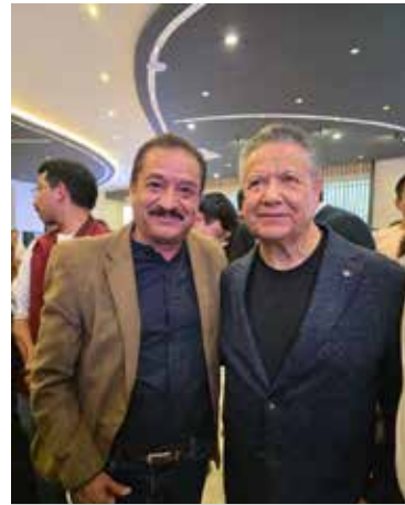
Autoridades municipales destacaron la importancia de mantener el trabajo coordinado entre municipios para impulsar acciones y proyectos

Con estas acciones, el Gobierno Municipal de Mixquiahuala de