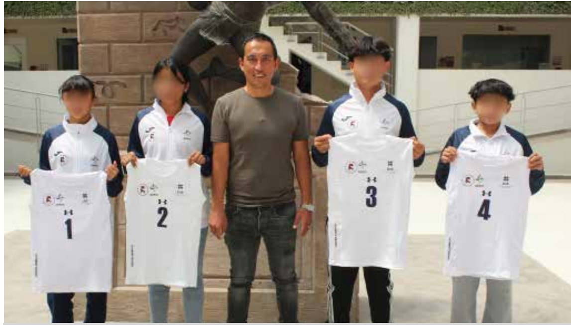
Las y los atletas competirán en la disciplina de atletismo en las ramas femenil y mixta

como parte del programa "Equipando Campeones Atotonilquenses", impulsado por la administración de la presidenta municipal Yocelyn Tovar Mendoza. Las y los atletas competirán en la disciplina de atletismo en las ramas femenil y mixta, llevando consigo el talento y esfuerzo de la niñez deportista del municipio. Autoridades señalaron que estas acciones buscan fortalecer el deporte y respaldar a las nuevas generaciones.