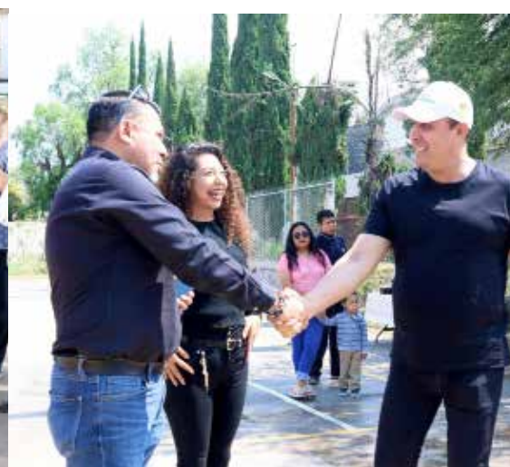
Las autoridades señalaron que estas obras fueron realizadas a través del presupuesto participativo