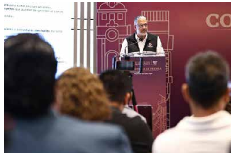
De acuerdo con el Servicio Meteorológico Nacional, se prevé que 2026 sea uno de los años más calurosos registrados

en gran parte del territorio hidalguense. El funcionario alertó particularmente sobre los riesgos geológicos en la región Otomí-Tepehua, donde existe alta probabilidad de deslaves y rodamiento de piedras debido a las características montañosas del terreno. Además, recordó que desde el 15 de mayo inició oficialmente la temporada de ciclones en el océano Pacífico y el 1 de junio comenzará en el Atlántico, con un pronóstico de entre 18 y 21 ciclones en el Pacífico y de 11 a 15 en el Atlántico, algunos de los cuales podrían afectar indirectamente a Hidalgo mediante precipitaciones extremas. Ante este panorama, el subsecretario subrayó que la