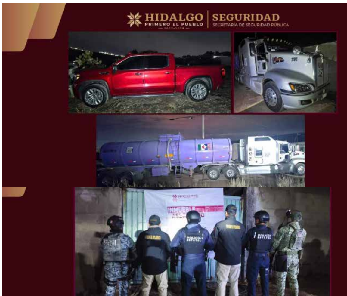
De acuerdo con el reporte oficial, en el inmueble fue localizada una cisterna de concreto adaptada para almacenar diésel

De acuerdo con el reporte oficial, en el inmueble fue localizada una cisterna de concreto adaptada para almacenar diésel, con capacidad aproximada de 10 mil litros, además de 16 contenedores de mil litros cada uno utilizados para el resguardo del combustible.