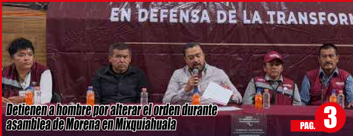
Detienen a hombre por alterar el orden durante asamblea de Morena en Mixquiahuala