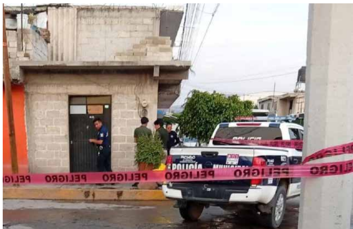
La zona fue acordonada y se solicitó la intervención de personal de la Procuraduría General de Justicia del Estado

Progreso de Obregón.- La tarde del pasado domingo se reportaron detonaciones de arma de fuego sobre la calle Santos Degollado, en el municipio de Progreso de Obregón, Hidalgo. De acuerdo con los primeros reportes, un hombre perdió la vida tras ser atacado a balazos; de manera preliminar, se presume que los hechos podrían estar relacionados con una riña. Paramédicos acudieron al lugar para brindar apoyo; sin embargo, confirmaron que la persona ya no contaba con signos vitales. La zona fue acordonada y se solicitó la intervención de personal de la Procuraduría General de Justicia del Estado de Hidalgo para realizar las diligencias correspondientes. Elementos de la Dirección de Seguridad Pública implementaron un operativo en la zona para tratar de localizar al presunto responsable, mientras las autoridades ya investigan lo ocurrido para esclarecer los hechos.