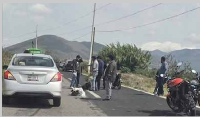
Automovilistas que circulaban por la zona informaron sobre la presencia de unidades de rescate, lo que generó reducción momentánea en la circulación

Automovilistas que circulaban por la zona informaron sobre la presencia de unidades de rescate, lo que generó reducción momentánea en la circulación. Por ello, se exhortó a los conductores a manejar con precaución.