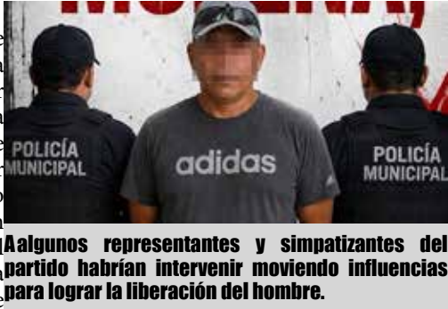
Algunos representantes y simpatizantes del partido habrían intervenir moviendo influencias para lograr la liberación del hombre.

Mixquiahuala de Juárez.- Una persona fue detenida por elementos de la Policía Municipal luego de presuntamente alterar el orden público durante la instalación del Consejo Municipal en Defensa de la Transformación de Morena, realizada este sábado en el municipio de Mixquiahuala.