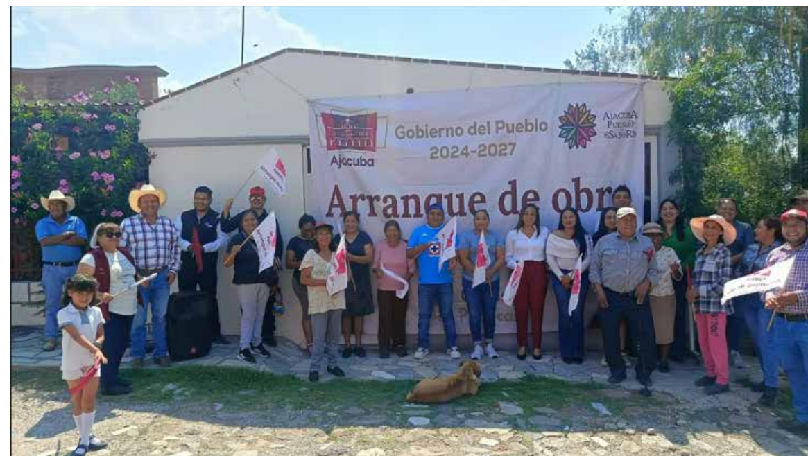
Durante el evento, la alcaldesa señaló que el objetivo de la administración es fortalecer la infraestructura básica y mejorar los servicios públicos

Asimismo, hizo un llamado a la participación ciudadana y al trabajo coordinado entre gobierno y sociedad