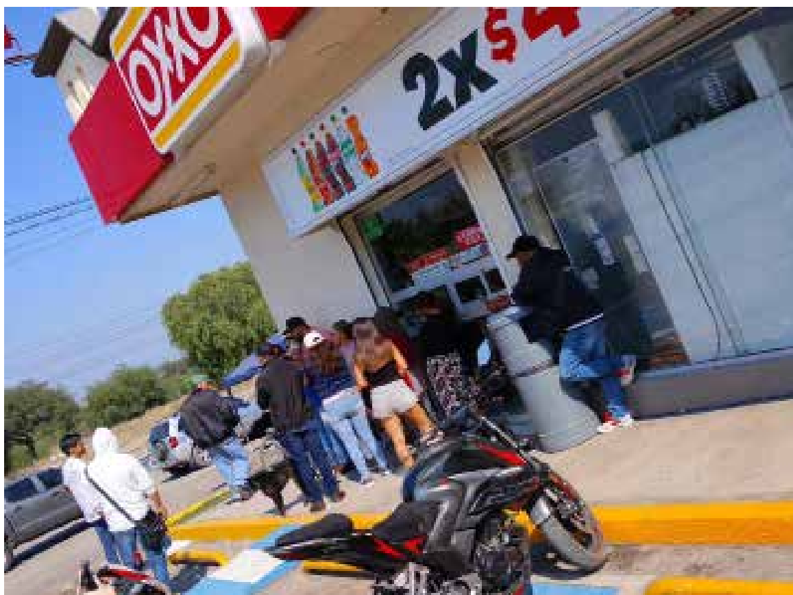
En el sitio, se informó a las autoridades que integrantes del comité de la feria mantenían bloqueado el acceso al establecimiento mientras solicitaban una cooperación económica para la realización de la feria.

Las autoridades no reportaron personas detenidas ni incidentes mayores derivados de la manifestación.