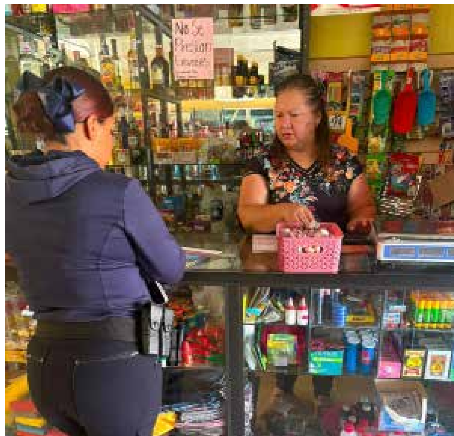
Durante los recorridos de proximidad, se brindó orientación directa sobre el método “Tocar, Mirar y Girar”, herramienta para identificar billetes apócrifos y fortalecer la prevención.

Las autoridades municipales señalaron que estas acciones buscan mantener cercanía con la ciudadanía y proteger la economía local.