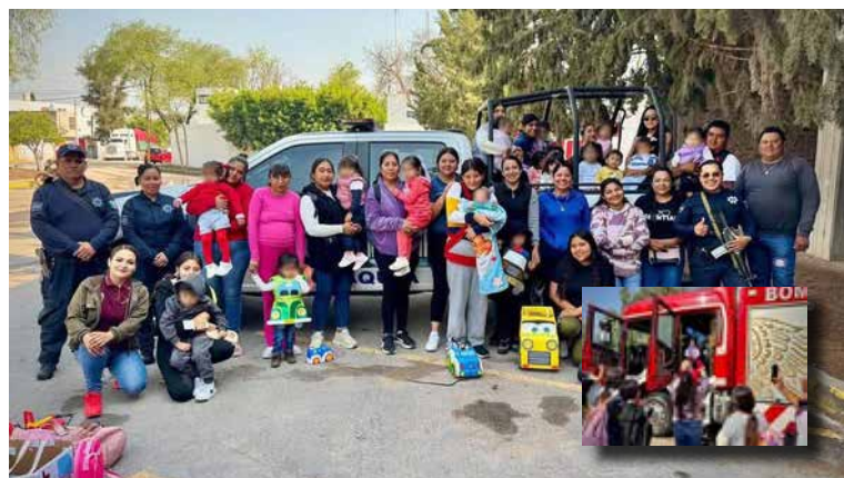
En coordinación con Protección Civil y Bomberos de Atitalaquia, también se realizó una demostración del camión de bomberos

Durante la jornada, las niñas y niños participaron en dinámicas de pase de lista, ejercicios de orden cerrado y recorridos por las instalaciones, donde pudieron conocer las unidades policiales