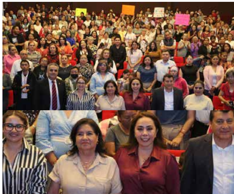
Conocer para Sanar una campaña integral permanente y profundamente humano, pensado para acompañar a nuestras familias

Conocer para Sanar, agregó, será una política pública de esta administración que habrá de trabajarse de manera permanente a través del DIF Municipal, con mucha sensibilidad, cercanía y responsabilidad, porque hablar de salud mental, emociones, y de procesos personales, debe dejar de ser un tema escondido.