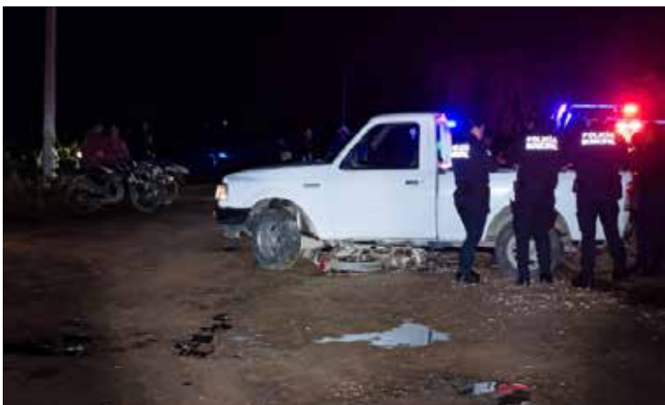
El impacto fue tan fuerte que la motocicleta terminó atorada debajo de una unidad tipo Pick Up