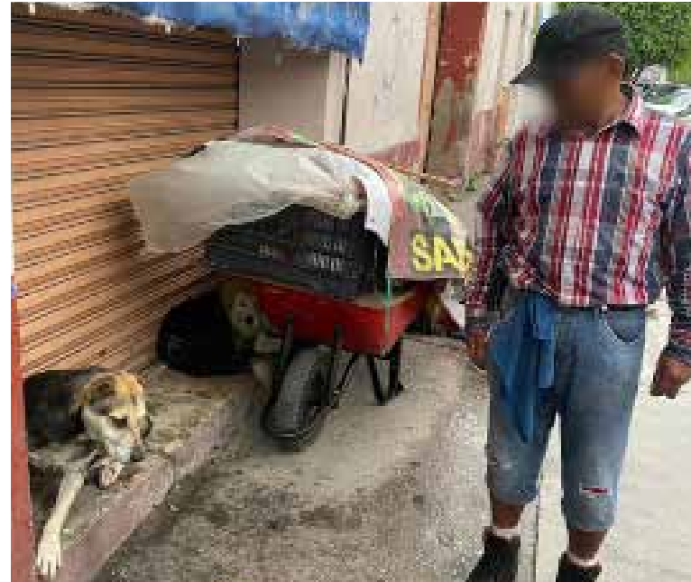
Como resultado de las acciones, tres caninos fueron resguardados y posteriormente entregados a asociaciones rescatistas