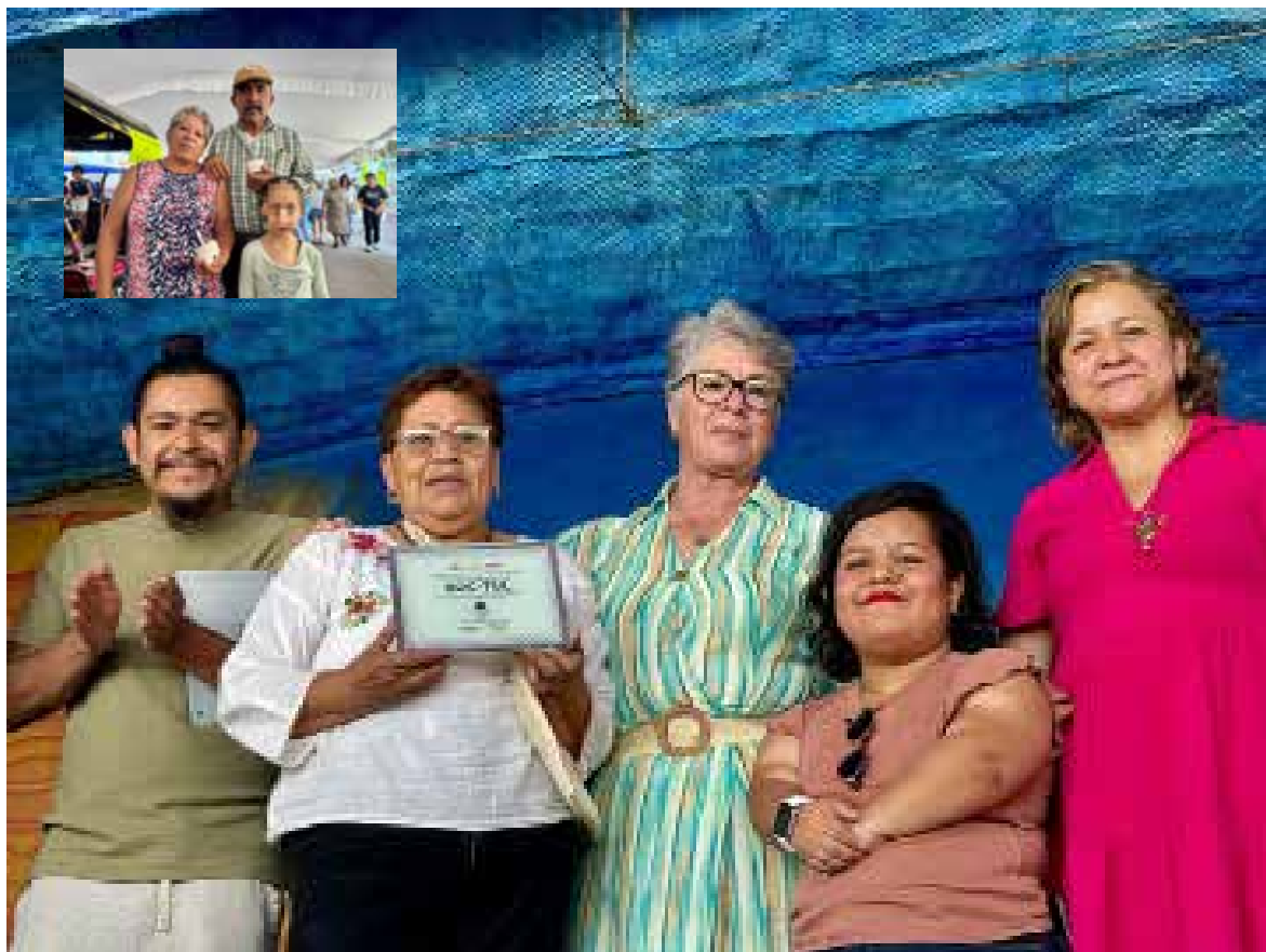
Durante esta exitosa jornada, se ofrecieron más de 200 sabores de helado artesanal, consolidando a este festival como un espacio único en la región

Con la asistencia de más de 10 mil personas, este festival se consolida como uno de los más importantes de la región, reafirmando el compromiso del gobierno municipal con el desarrollo cultural, turístico y económico de Tula de Allende.