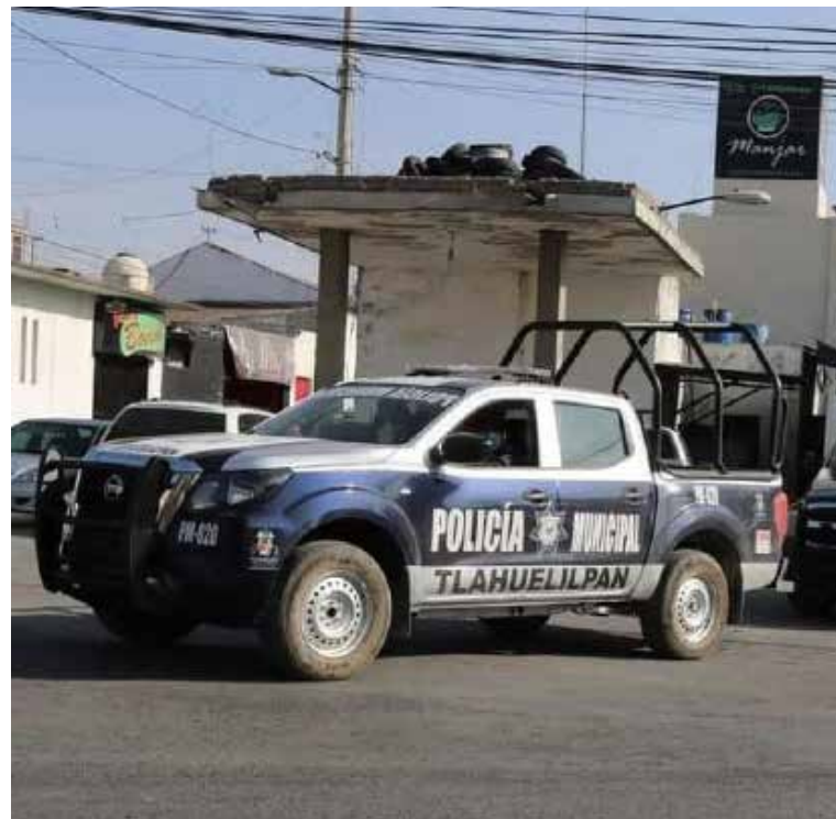
Durante la inspección, autoridades localizaron dos casquillos percutidos calibre 9 milímetros en las inmediaciones.

quien relató que ambos se dirigían caminando a su domicilio cuando fueron interceptados por dos sujetos a bordo de una motocicleta, quienes abrieron fuego en su contra y posteriormente huyeron con dirección al bulevar Sergio Butrón Casas. Paramédicos de Protección Civil confirmaron el fallecimiento en el sitio. Durante la inspección, autoridades localizaron dos casquillos percutidos calibre 9 milímetros en las inmediaciones. La zona fue acordonada y quedó bajo resguardo de elementos policiales, en tanto se notificó al Ministerio Público, que