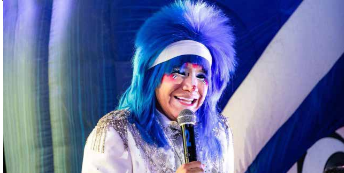
La fiesta fue encabezada por el propio presidente municipal, quien compartió un momento muy agradable con las familias asistentes.