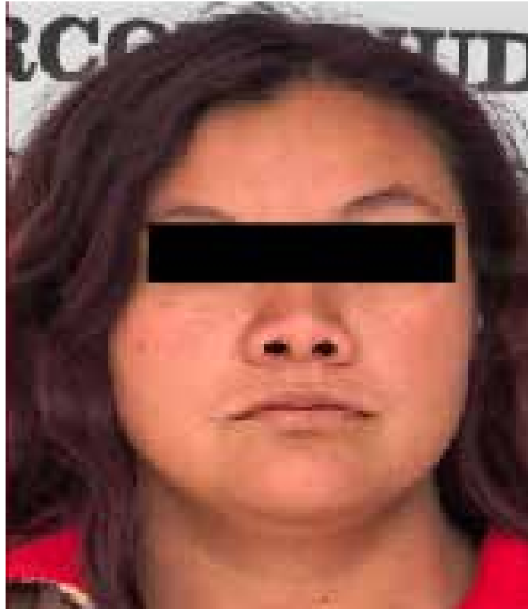
Durante la audiencia inicial, la representación social formuló imputación por homicidio doloso agravado.

provocaron lesiones fatales. Luego de que el caso fue reportado, el Ministerio Público inició las indagatorias correspondientes, recabando pruebas suficientes para solicitar una orden de aprehensión, la cual fue cumplimentada por agentes de la División de Investigación. Durante la audiencia inicial, la representación social formuló imputación por homicidio doloso agravado. La persona señalada solicitó la duplicidad del plazo constitucional de 144 horas para definir su situación jurídica. Sin embargo, tras la continuación de la audiencia, la autoridad judicial determinó su vinculación a proceso.