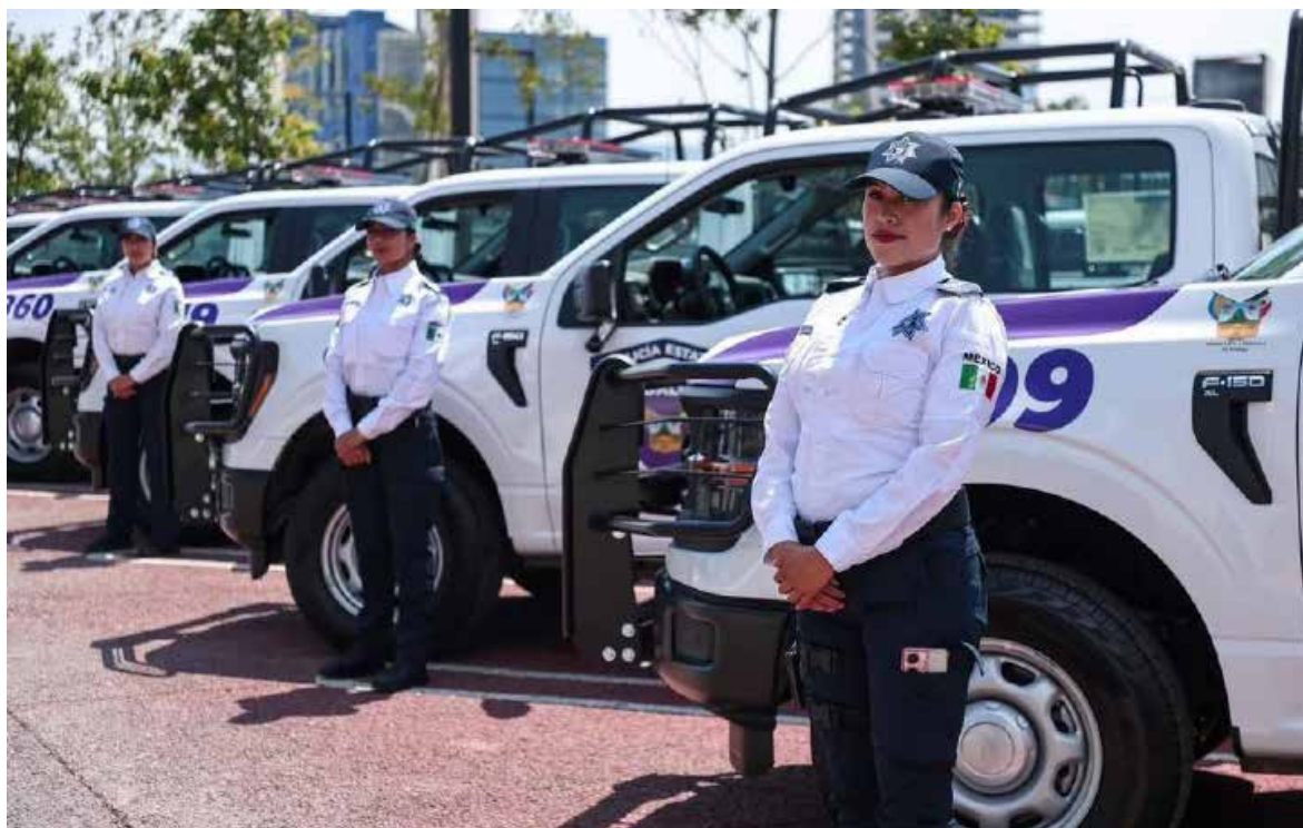
Tula de Allende fue beneficiado con una patrulla, con el objetivo de reforzar las labores operativas y mejorar la atención y protección a la ciudadanía.

Autoridades destacaron que estas acciones forman parte de una estrategia integral para fortalecer la seguridad y capacidad de respuesta de los cuerpos policíacos en Hidalgo.