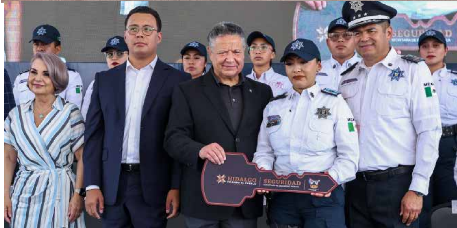
Salvador Cruz Neri, secretario de Seguridad Pública de Hidalgo, destacó que, derivado de esta estrategia, se ha logrado la certificación del 98.7 por ciento de la Policía Estatal

más de 5 mil 600 vehículos robados, se han asegurado 6 millones 548 mil 300 litros de hidrocarburo junto a 347 personas relacionadas con este delito, y se han incautado un millón 154 mil 946 dosis de distintas drogas.