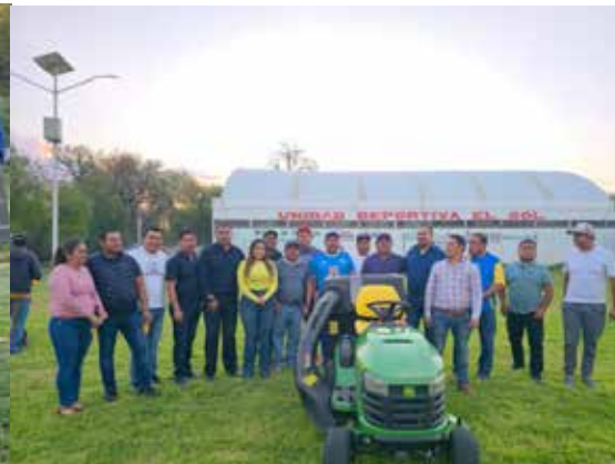
Se llevó a cabo la entrega de un tractor jardinero destinado al mantenimiento de la Unidad Deportiva "El Sol"

Verde, Palmeras, Independiente, Huracán, Cañada, Brasil Huitel, Zaragoza, Santa Nieves, Borussia, Deportivo Huracán