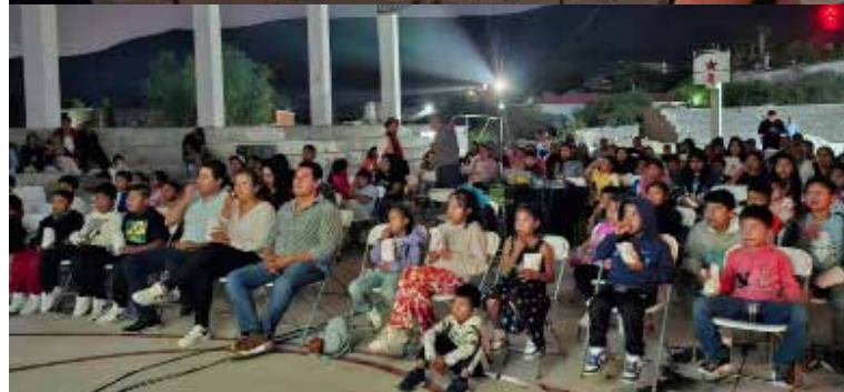
"Cine Comunitario" en la comunidad de El Dadho