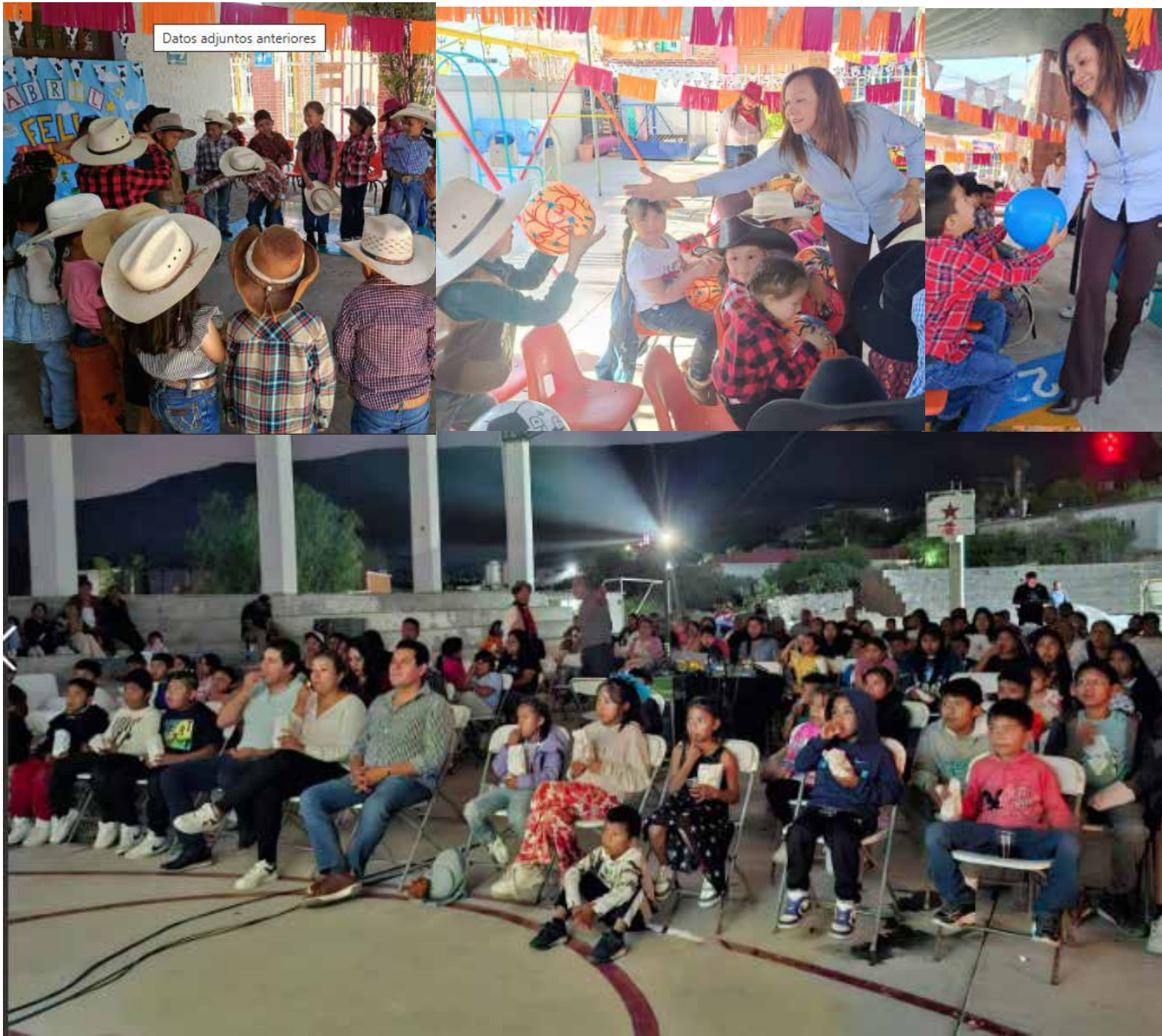
La presidenta Zitlaly Zúñiga realizaron visitas al Preescolar Héroes de Chapultepec, en la colonia Cuauhtémoc así como al CAIC

Ajacuba.- En el marco del Día del Niño, autoridades municipales encabezadas por la presidenta Zitlaly Zúñiga realizaron visitas al Preescolar Héroes de Chapultepec, en la colonia Cuauhtémoc, así como al CAIC, donde compartieron momentos especiales con las niñas y los pequeños. Durante la jornada, en el CAIC se llevó a cabo la entrega de pelotas, generando sonrisas entre las niñas y niños, mientras que en el preescolar, en coordinación con el DIF municipal Ajacuba 2024-2027, se organizó una actividad recreativa con la participación de un payaso, promoviendo un