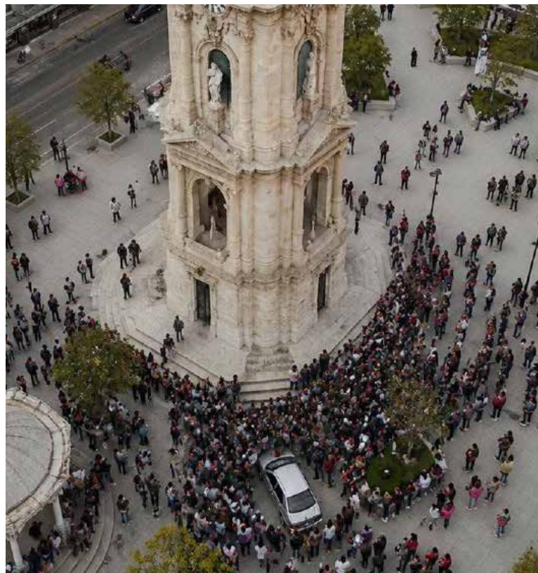
La versión del conductor del automóvil, todo ocurrió de forma inesperada debido a una supuesta falla en el sistema de frenos

En la unidad viajaba su familia y, pese al susto y la tensión del momento, por