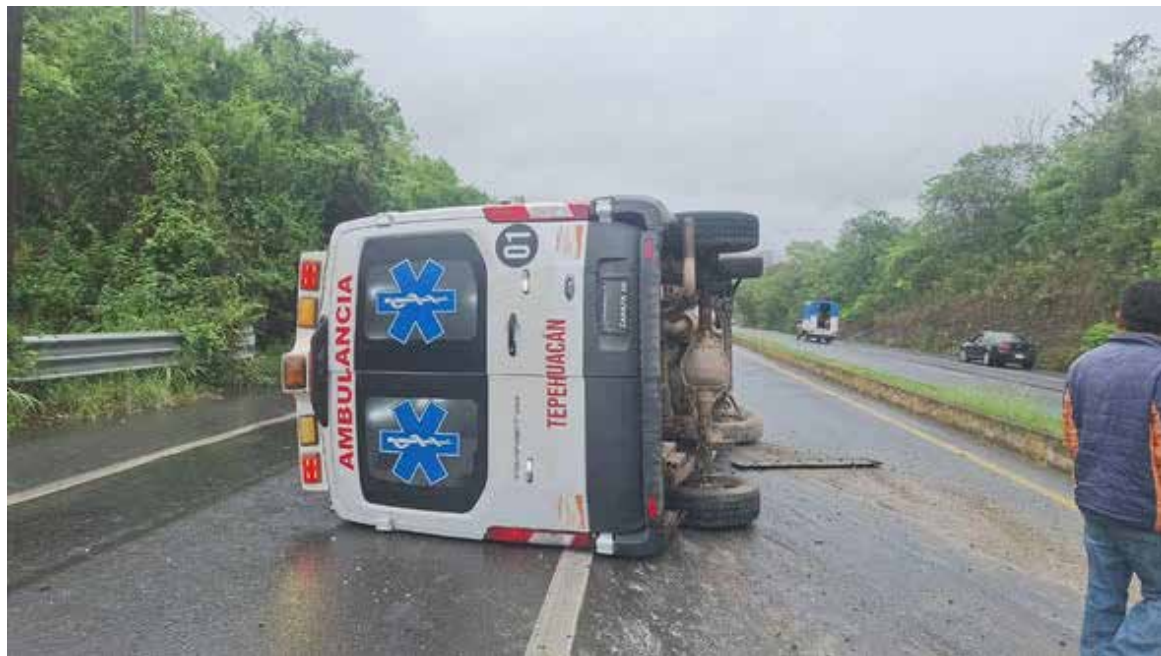
A pesar de lo impactante del incidente, por fortuna no se reportaron personas heridas ni pérdidas humanas

Posteriormente, se dio a conocer que el conductor era el único ocupante del vehículo, quien tras el percance logró salir por su cuenta tras el percance, utilizando la puerta del lado del copiloto.