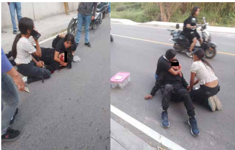
Debido a las lesiones que presentaba, fue estabilizado en el sitio y posteriormente trasladado al Hospital Integral Cinta Larga

presentaba, fue estabilizado en el sitio y posteriormente trasladado al Hospital Integral Cinta Larga para su valoración y atención médica correspondiente. Testigos señalaron que