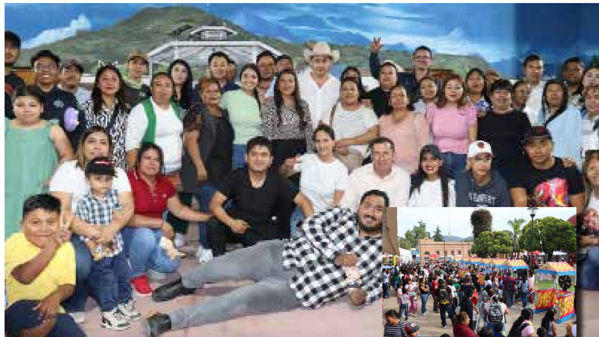
Durante el festejo, también se hizo un llamado a las familias a continuar fortaleciendo el desarrollo de las niñas y los niños, fomentando la educación