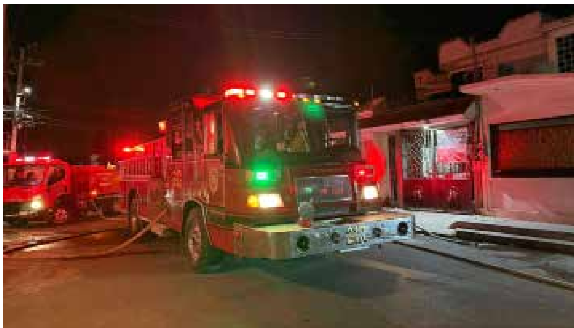
Afortunadamente, no se encontraban personas al interior de la vivienda, por lo que solo se registraron daños materiales

De manera preliminar, se indicó que el siniestro pudo haber sido provocado por una veladora.