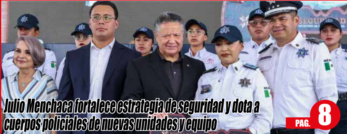
Julio Menchaca fortalece estrategia de seguridad y dota a cuerpos policiales de nuevas unidades y equipo