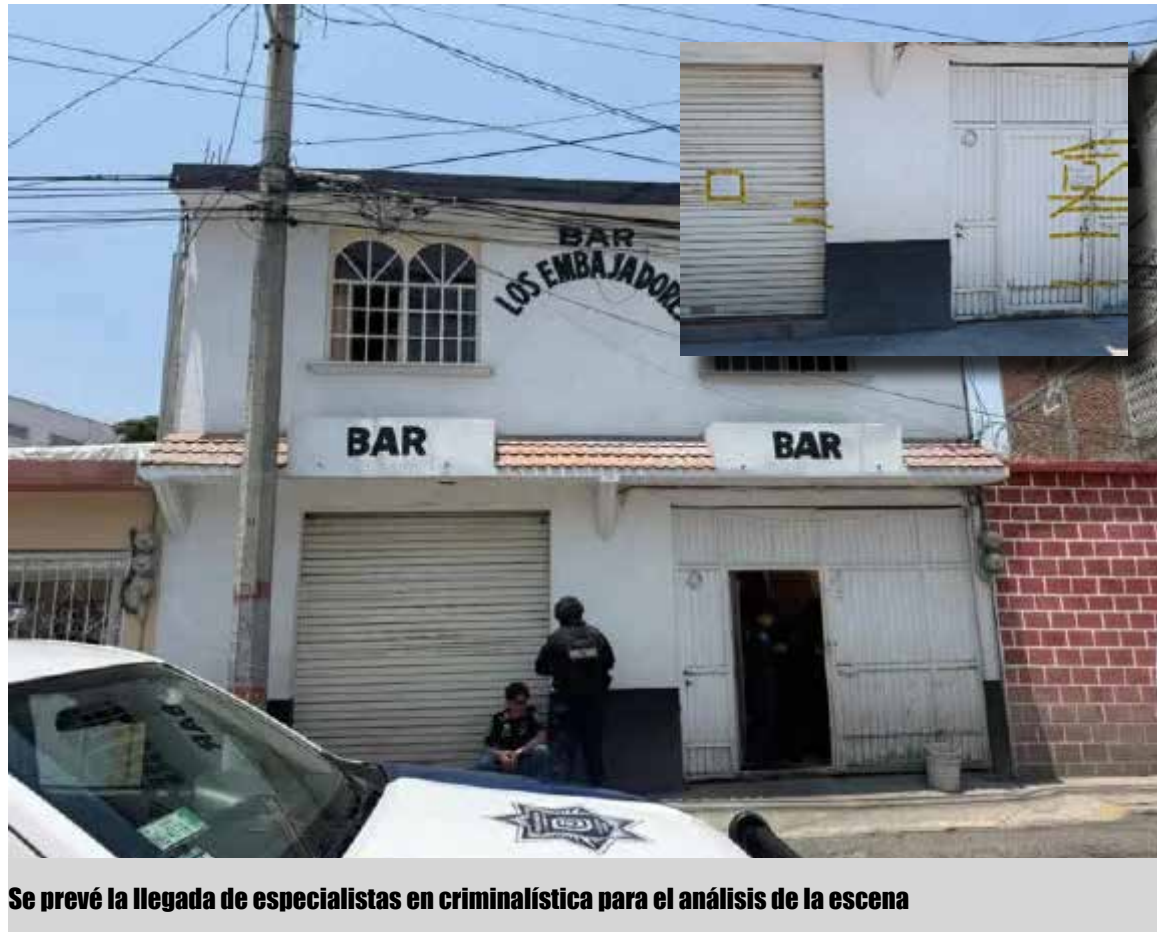
Se prevé la llegada de especialistas en criminalística para el análisis de la escena

Se prevé la llegada de especialistas en criminalística para el análisis de la escena. Hasta ahora, no se ha informado de manera oficial sobre el móvil del crimen.