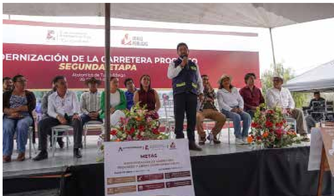
Estas acciones buscan fortalecer la seguridad vial, mejorar la movilidad y brindar mejores condiciones de vida a las familias de la comunidad.

El gobierno municipal reiteró su compromiso de seguir impulsando obras que generen desarrollo y bienestar en Atotonilco de Tula.