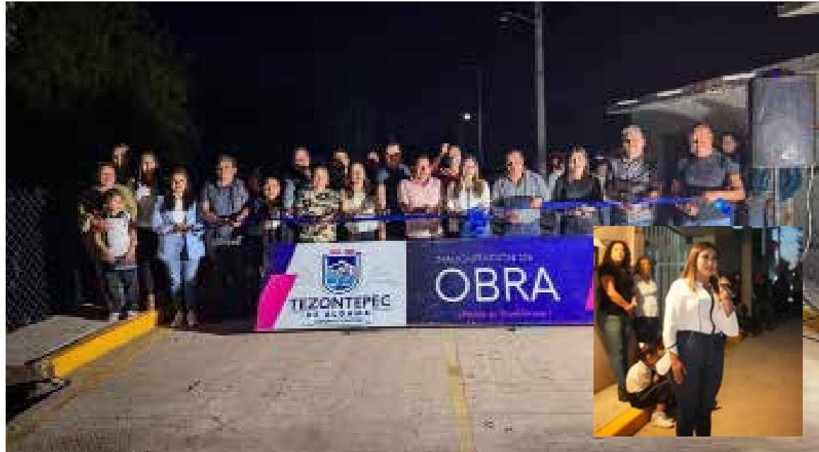
Durante el evento, vecinas y vecinos, junto con autoridades auxiliares y representantes del gobierno municipal, celebraron la entrega de esta vialidad

El gobierno municipal destacó que continuará trabajando para llevar más obras y desarrollo a cada rincón de Tezontepec.