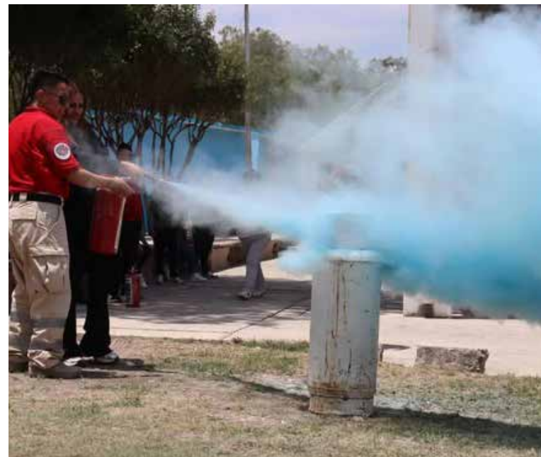
Las autoridades destacaron que este tipo de actividades buscan fortalecer la cultura de la prevención y brindar herramientas básicas que pueden marcar la diferencia

Las autoridades destacaron que este tipo de actividades buscan fortalecer la cultura de la prevención y brindar herramientas básicas que pueden marcar la diferencia en situaciones de riesgo. En Tetepango, la seguridad de niñas y niños se mantiene como una prioridad, apostando por la capacitación y la acción preventiva como pilares fundamentales.