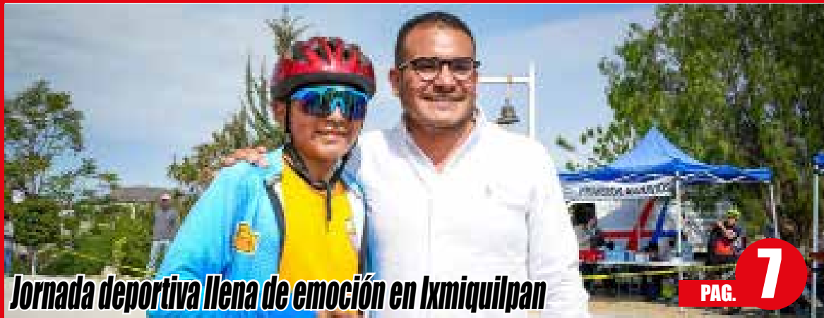
Jornada deportiva llena de emoción en Ixmiquilpan