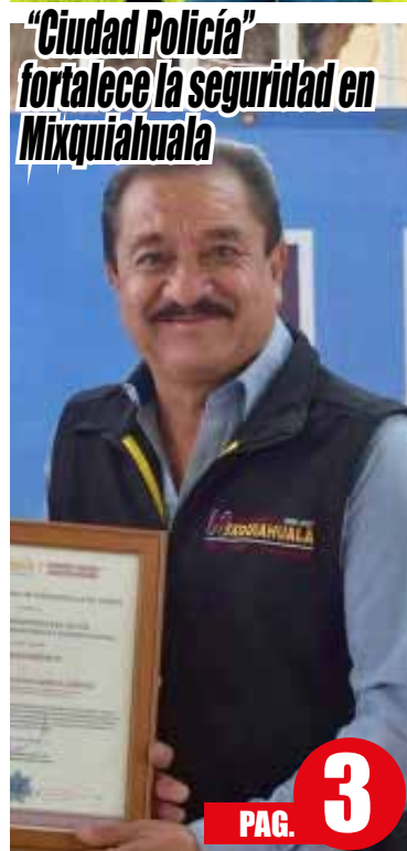
"Ciudad Policía" fortalece la seguridad en Mixquiahuala