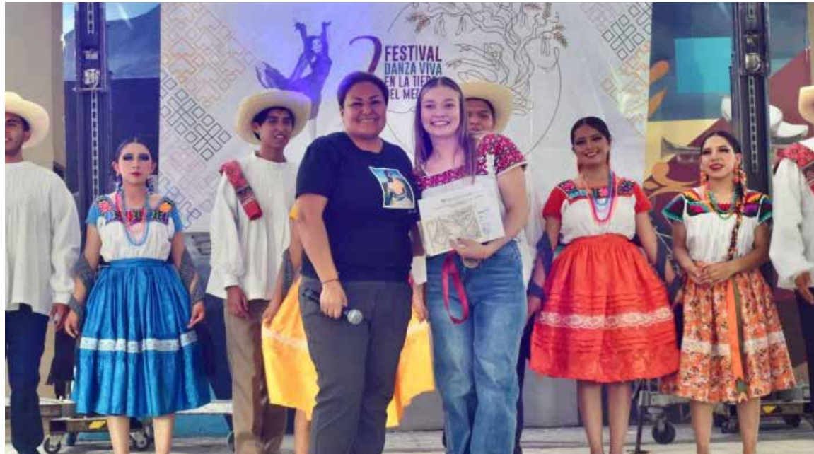
El evento contó con la presencia del presidente municipal, Miguel Ángel Peña Flores, junto a regidores y autoridades culturales

Esta celebración busca reafirmar el compromiso de promover la cultura y preservar las tradiciones que dan identidad a Mixquiahuala.