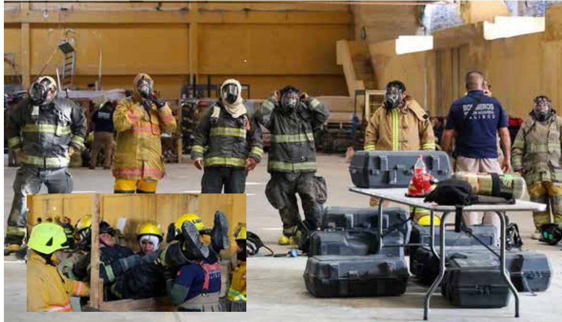
En esta jornada participaron más de 100 elementos de distintos municipios de Hidalgo

La instrucción está a cargo de especialistas provenientes de la Región Agaveña, en Jalisco, y forma parte de una estrategia coordinada por el Gobierno Municipal de Tlahuelilpan 2024-2027, mediante Protección Civil, en conjunto con Protección Civil de Atitalaquia.