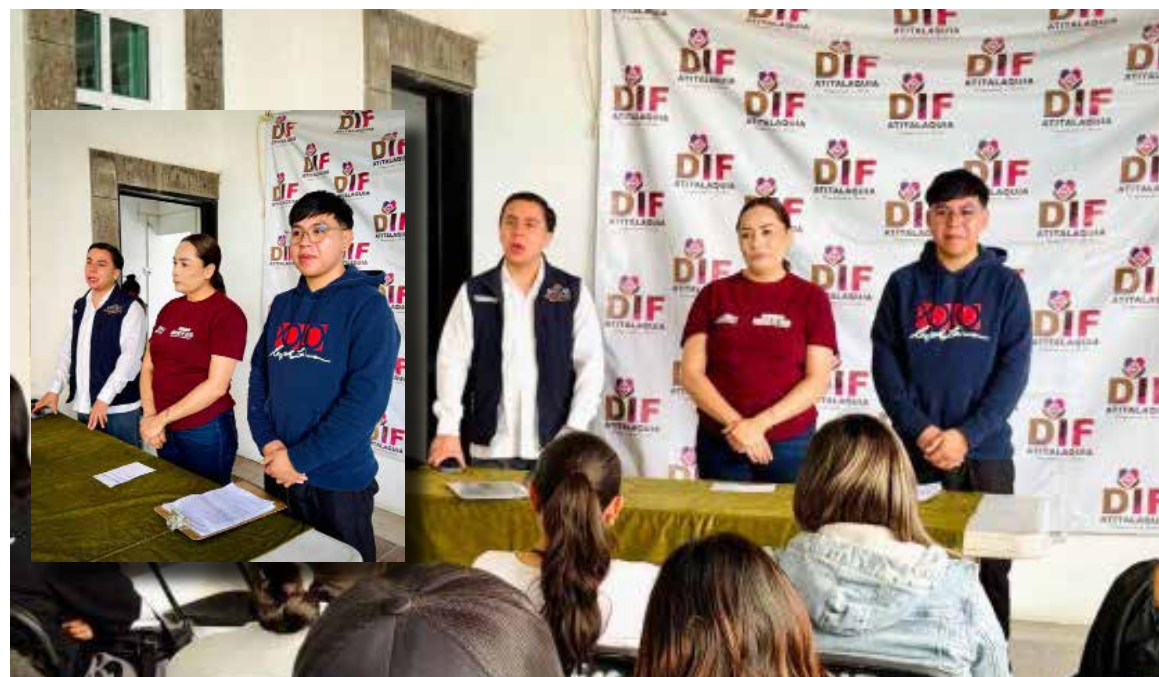
Autoridades destacaron que este programa brinda herramientas reales para el crecimiento personal y profesional de las y los participantes

Con estas acciones, Atitalaquia reafirma su compromiso de impulsar la educación, la salud y el bienestar de su gente.