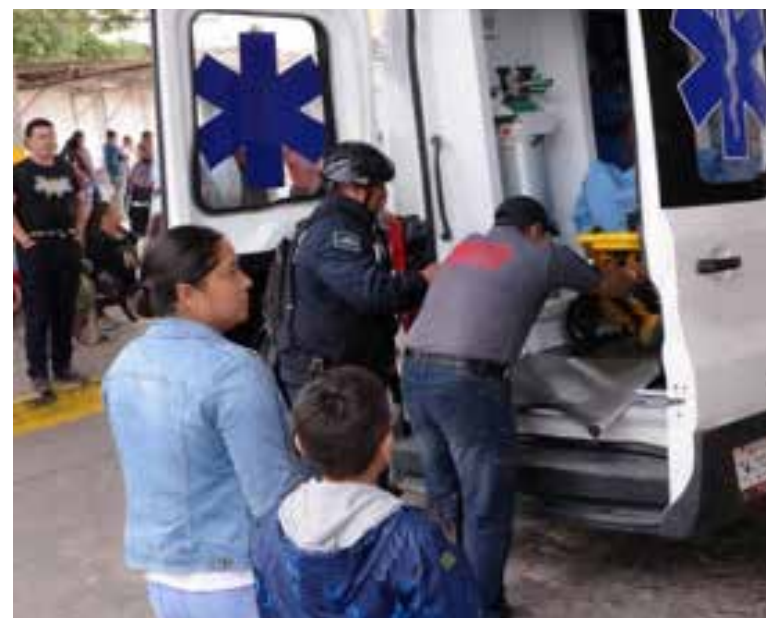
Personas que se encontraban en la zona reaccionaron de inmediato para auxiliarla y solicitar apoyo de los servicios de emergencia

Lo que inició como una situación de emergencia terminó con un final feliz, marcando la llegada de una nueva vida en circunstancias inesperadas.