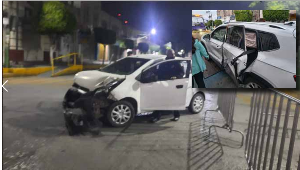
Tras el fuerte impacto, un sujeto que viajaba como acompañante en el vehículo responsable bajó de la unidad y emprendió la huida

Por fortuna y pese a lo aparatoso del accidente el profesor y su familia se encuentran estables.