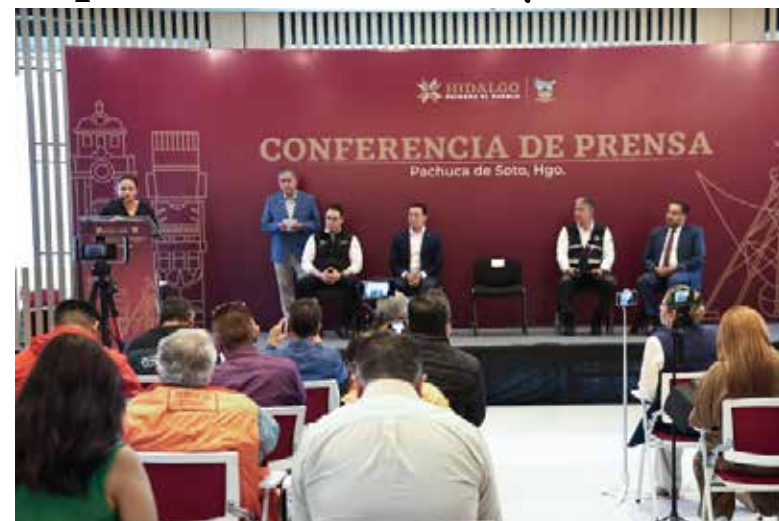
Autoridades estatales destacaron, en conferencia de prensa, que los espacios culturales no solo deben proyectarse desde la memoria histórica, sino también desde la responsabilidad pública

Ante ello, el 24 de marzo de 2026, el Poder Ejecutivo promovió la rescisión del contrato de comodato mediante la vía ordinaria civil, procedimiento radicado bajo el expediente 340/2026 en el Juzgado Primero Civil del distrito judicial de Pachuca. Se enfatizó que la posesión de un inmueble público no implica, en ningún caso, la transferencia de propiedad,