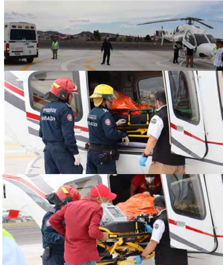
El primer operativo se llevó a cabo desde el Hospital General de la Huasteca hacia el Hospital General de Pachuca

Asimismo, se destacó la coordinación con el sistema IMSS-Bienestar a través de las unidades hospitalarias involucradas, así como la participación del Centro Regulador de Urgencias Médicas de Hidalgo (CRUMH), que agilizó la logística y regulación de ambos traslados.