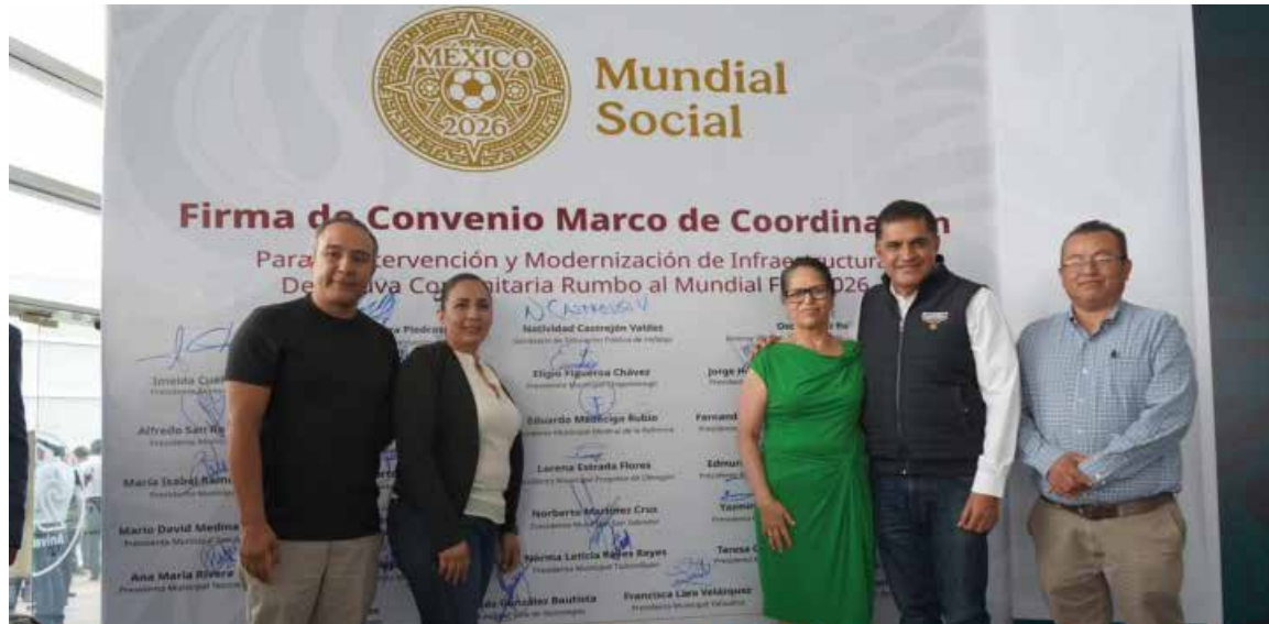
Autoridades municipales destacaron que este convenio representa una oportunidad significativa para mejorar y dignificar los espacios deportivos

Asimismo, se subrayó que el deporte constituye una herramienta fundamental para la construcción de la paz social,