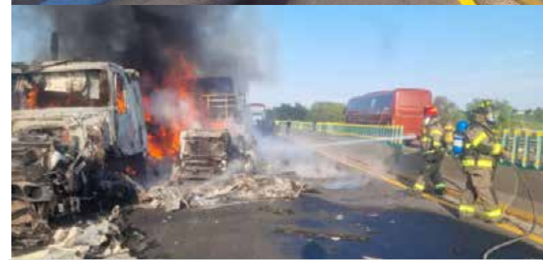
Elementos del cuerpo de Bomberos de Tula de Allende acudieron al sitio para sofocar las llamas y realizar las labores correspondientes, lo que ha derivado en el cierre de la circulación en ese punto carretero.