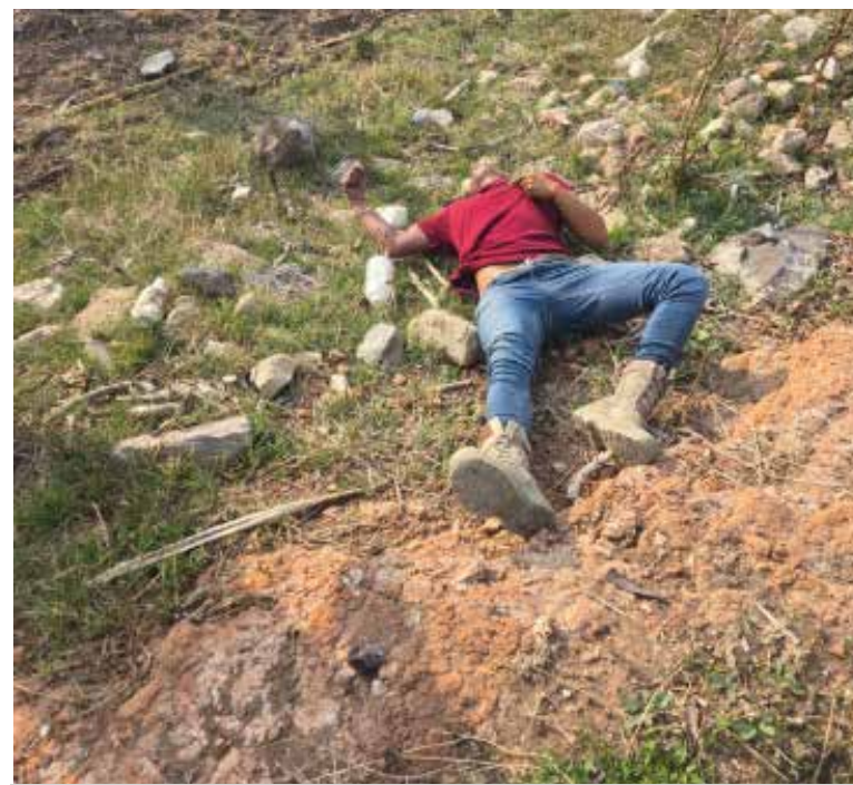
El ahora occiso, que se presume podría ser proveniente de algún otro estado, vestía una playera de color rojo, pantalón de mezclilla azul y botas tipo tácticas

otro estado, vestía una playera de color rojo, pantalón de mezclilla azul y botas tipo tácticas. El lugar del hallazgo fue acordonado por elementos de la Dirección de Seguridad Pública Municipal en tanto se daba parte al personal especializado de Servicios Periciales de la Procuraduría General de Justicia del Estado de Hidalgo para dar inicio con las investigaciones correspondientes.