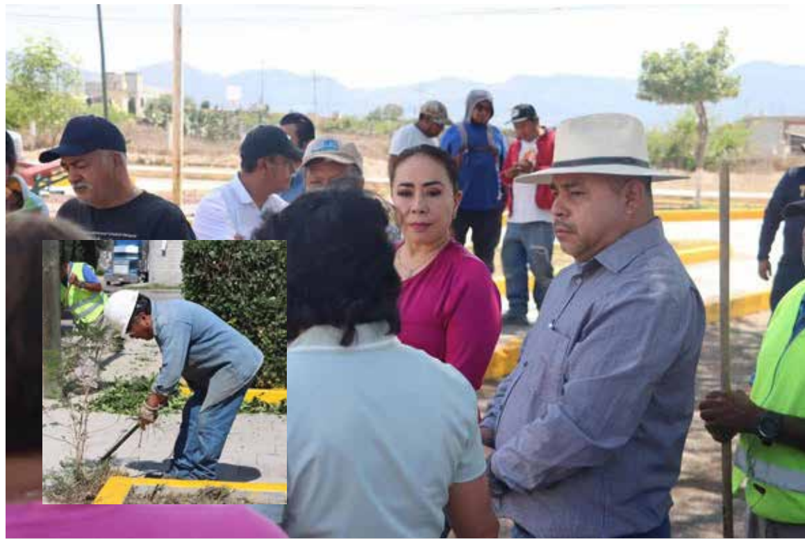
Durante esta intervención se realizaron labores de limpieza, mantenimiento y pintura de guarniciones

y directa con los ciudadanos. Durante esta intervención se realizaron labores de limpieza, mantenimiento y pintura de guarniciones, así como mejoras en el módulo de seguridad, fortaleciendo el trabajo conjunto entre ciudadanía y gobierno. Estas acciones buscan reflejar el compromiso de escuchar y atender los planteamientos de la población, promoviendo espacios dignos, seguros y ordenados para que puedan ser disfrutados por todas y todos.