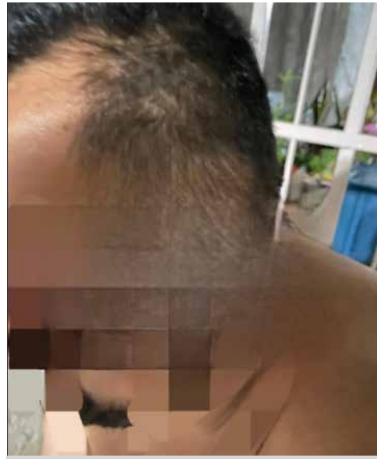
Tras un operativo de búsqueda, policías municipales lograron ubicar y detener a un joven de 19 años

De manera preliminar, se indicó que el detenido padece una condición de salud mental y consume medicamentos controlados, lo que, combinado con alcohol, habría influido en su comportamiento.