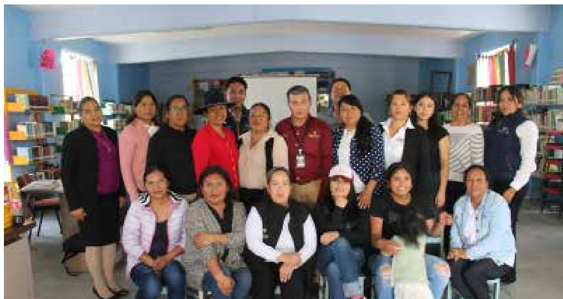
La jornada se llevó a cabo en la Biblioteca Pública Municipal "Justo Sierra", contando con la presencia de autoridades municipales y estatales del sector educativo y cultural.

Estas acciones buscan garantizar servicios de calidad y consolidar a las bibliotecas como espacios vivos de aprendizaje, conocimiento y transformación social.