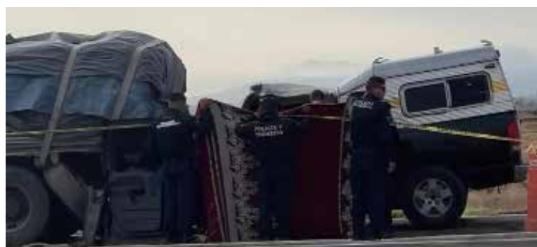
Autoridades reiteran el llamado a los automovilistas a conducir con precaución, respetar los límites de velocidad y mantener la calma al volante