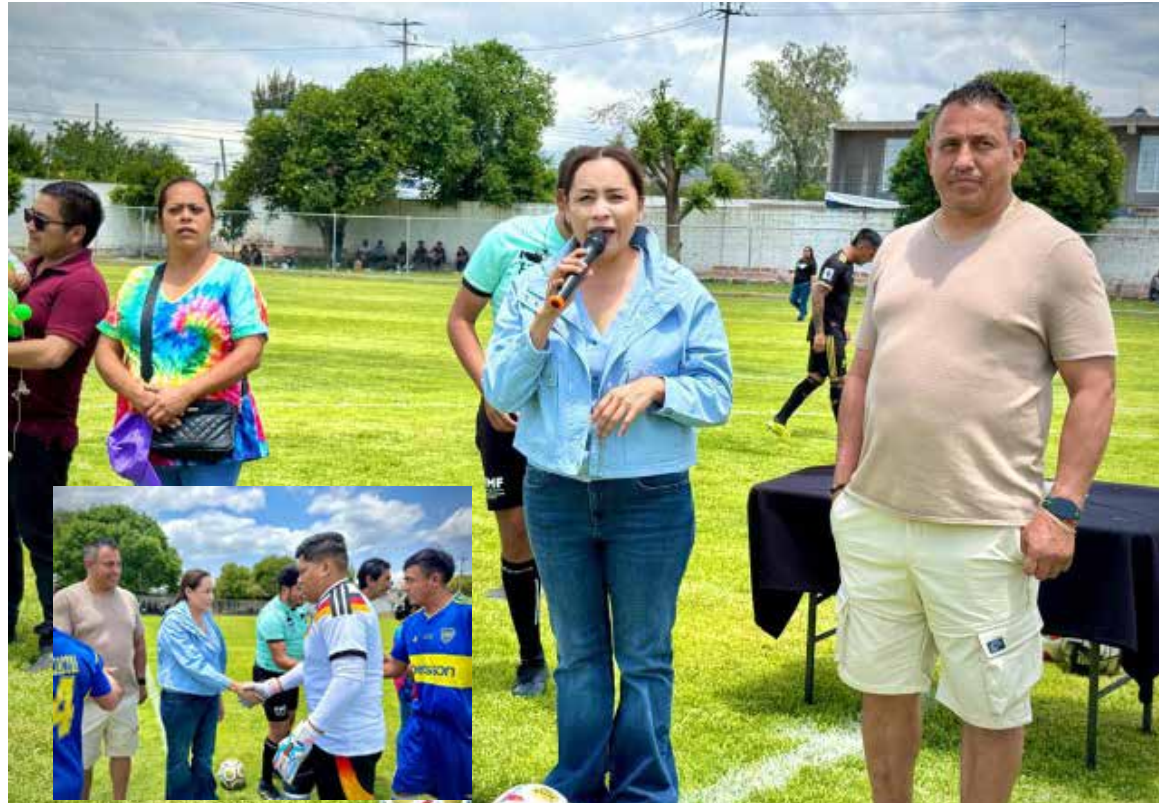
El Gobierno de la transformación de Atitalaquia continúa trabajando cercano al pueblo, promoviendo acciones que contribuyan al bienestar social

El Gobierno de la transformación de Atitalaquia continúa trabajando cercano al pueblo, promoviendo acciones que contribuyan al bienestar social. Se deseó éxito a todas y todos los participantes en este torneo que forma parte de las tradiciones y celebraciones de la comunidad.