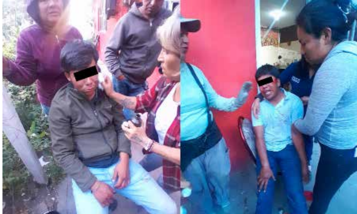
Alrededor de las 17:50 horas se recibió el aviso de un asalto en la calle Palo Seco, lo que derivó en un operativo de búsqueda

Familiares de los involucrados señalaron que los elementos policiacos se confundieron y habrían agredido físicamente a los detenidos, lo que motivó la intervención de la