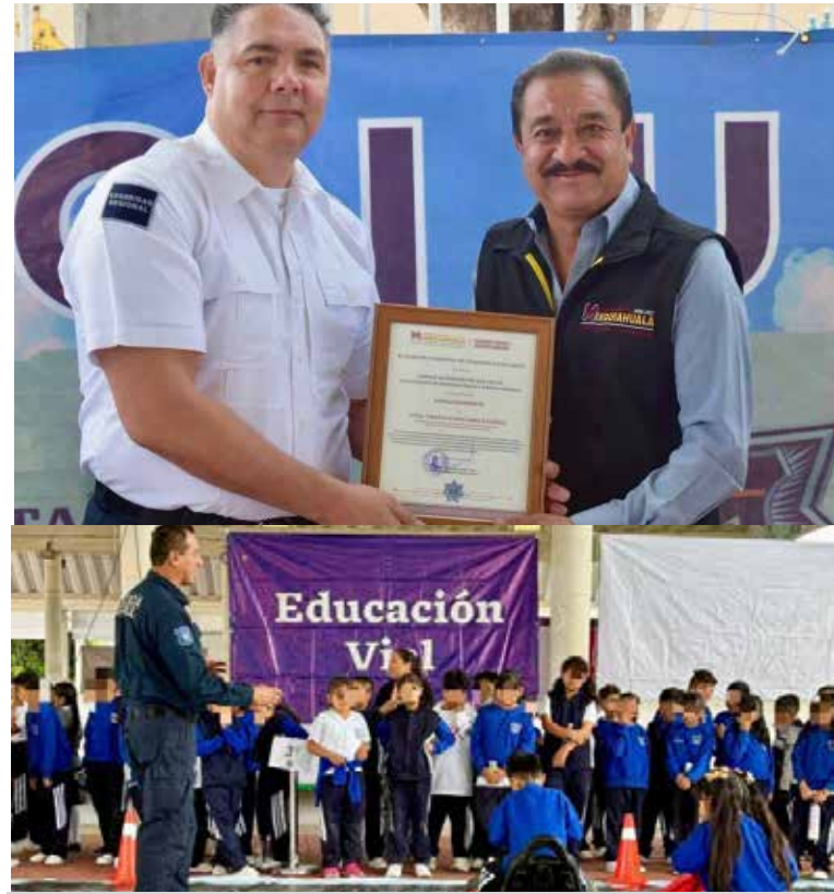
Se contó con la participación de la Escuela Primaria “16 de Enero”, cuyos alumnos vivieron una jornada dinámica en la que aprendieron sobre seguridad a través del juego

quienes sumaron esfuerzos para acercar este tipo de programas a la comunidad. Asimismo, se contó con la participación de la Escuela Primaria “16 de Enero”, cuyos alumnos vivieron una jornada dinámica en la que aprendieron sobre seguridad a través del juego, la interacción y actividades didácticas. Con estas acciones, las autoridades municipales buscan reafirmar su compromiso de construir un entorno más seguro, apostando por la educación preventiva como base para el desarrollo de futuras generaciones.