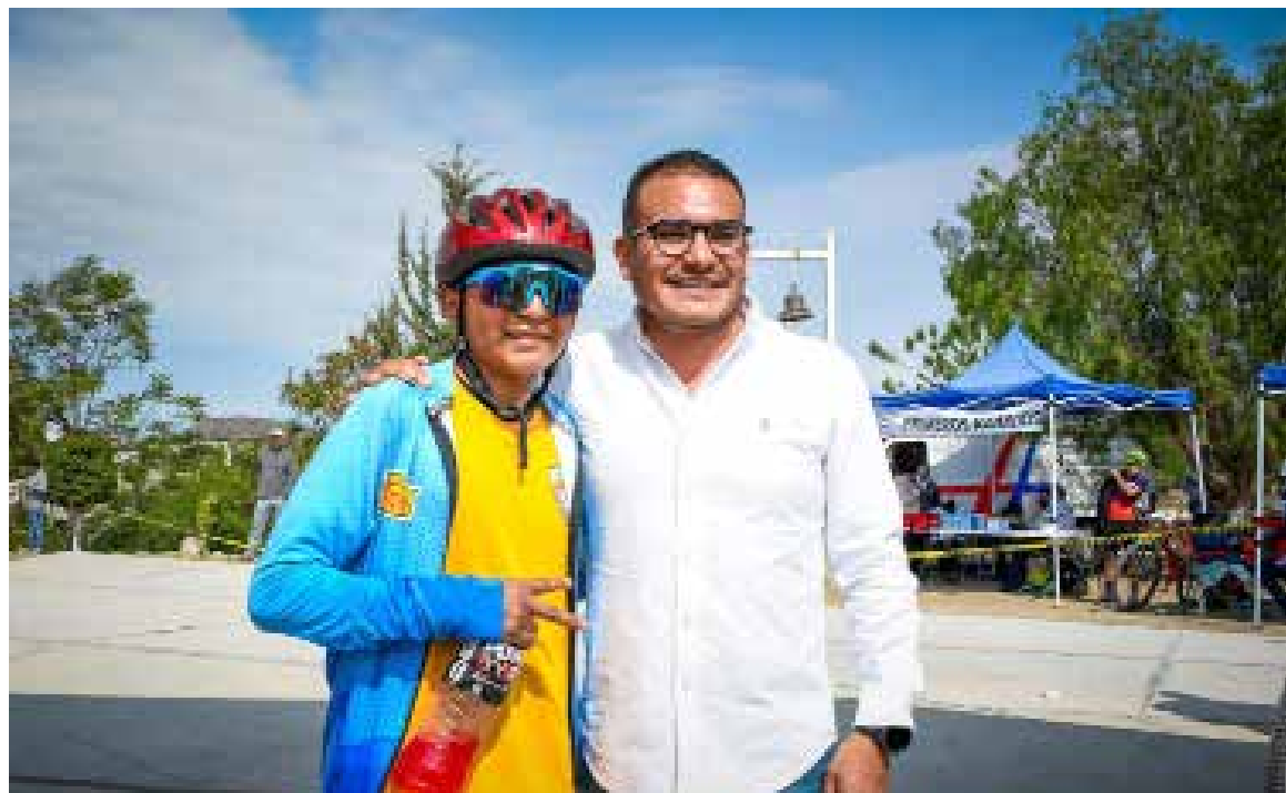
Por su parte, el básquetbol ofreció finales de alto nivel, con encuentros marcados por la intensidad y el esfuerzo de los equipos

Autoridades y organizadores señalaron que este tipo de eventos fomentan la sana competencia y fortalecen el deporte en el municipio, dejando momentos significativos para participantes y asistentes.