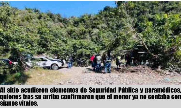
Al sitio acudieron elementos de Seguridad Pública y paramédicos, quienes tras su arribo confirmaron que el menor ya no contaba con signos vitales.