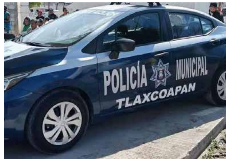
En la escena fueron localizados varios casquillos percutidos calibre 9 milímetros

Al lugar arribaron elementos de Protección Civil, quienes confirmaron que el masculino ya no contaba con signos vitales y presentaba al menos cinco impactos por proyectil de arma de fuego.