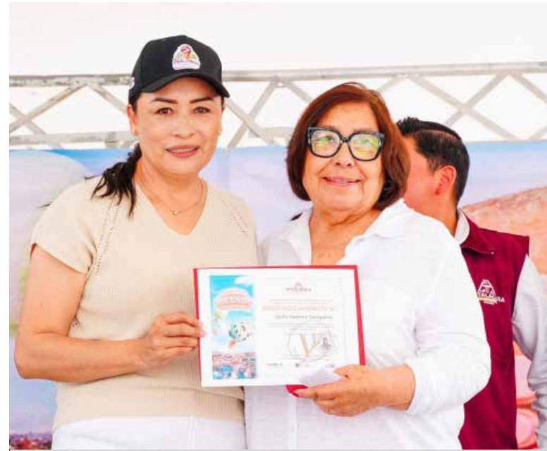
El ambiente festivo se fortaleció con la participación artística de agrupaciones y talentos que llenaron de energía el escenario