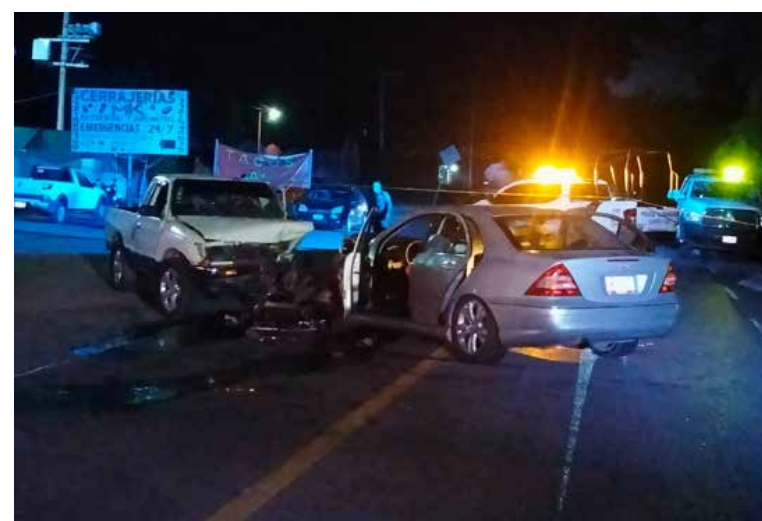
Una pareja que iba a bordo de la camioneta también resultó con lesiones

Tasquillo.- Un fatal accidente se registró al filo de la media noche del pasado viernes sobre la carretera federal México-Laredo, a la altura del kilómetro 93 en el municipio de Tasquillo. El fuerte impacto entre los ocupantes de una camioneta marca Toyota tipo Tacoma de color blanco con placas de circulación HP8244 y un automóvil Mercedes Benz de color gris con placas HP8244 del estado de Hidalgo, dejó varias personas lesionadas y a uno de los pasajeros del vehículo sin vida en el lugar. En el percance resultó lamentablemente sin vida un joven de 24 años de edad