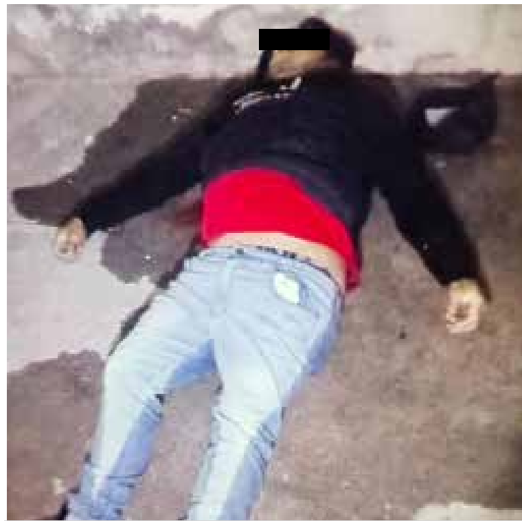
Localizaron a un masculino tirado boca arriba, sin signos vitales, con impactos de proyectil de arma de fuego.

Asimismo, en la zona fue asegurada una motocicleta marca Yamaha, la cual quedó a disposición de las autoridades como parte de