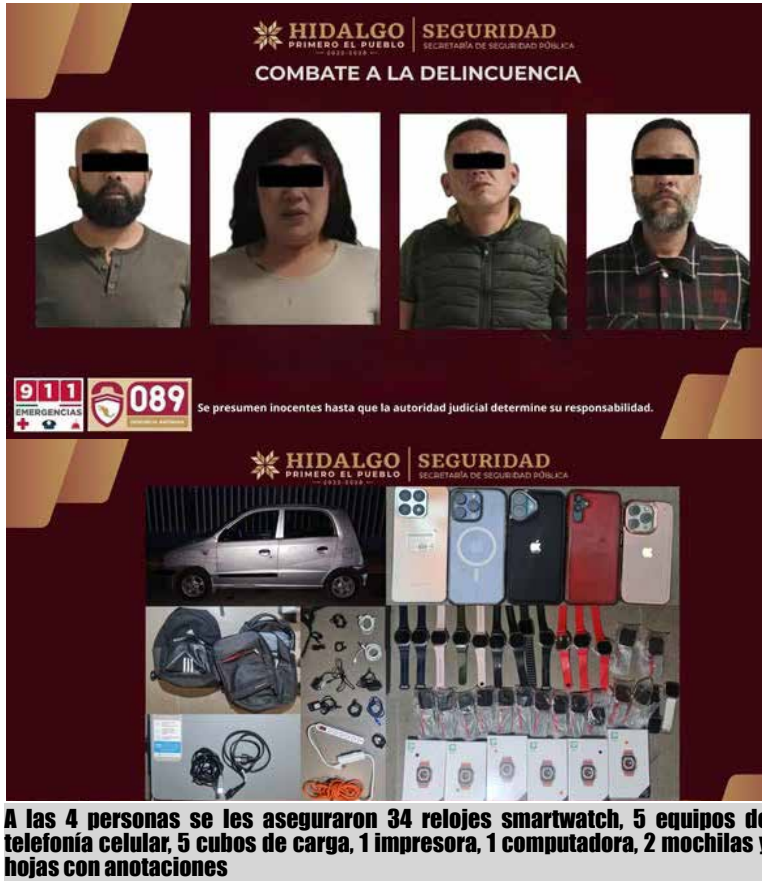
A las 4 personas se les aseguraron 34 relojes smartwatch, 5 equipos de telefonía celular, 5 cubos de carga, 1 impresora, 1 computadora, 2 mochilas y hojas con anotaciones

A las 4 personas se les aseguraron 34 relojes smartwatch, 5 equipos de telefonía celular, 5 cubos de carga, 1 impresora, 1 computadora, 2 mochilas y hojas con anotaciones, así como diversos cables y cargadores