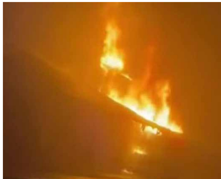
Fuerte incendio que se registraba en las inmediaciones de una estación de servicio ubicada sobre la carretera de salida hacia la ciudad de Pachuca

las llamas y controlar la situación y evitar que el fuego se propagara a zonas donde pudiera representar un mayor riesgo para la población. Tras varios minutos de arduas labores en la zona, el fuego fue controlado y extinguido sin presentarse por fortuna personas lesionadas por este hecho.