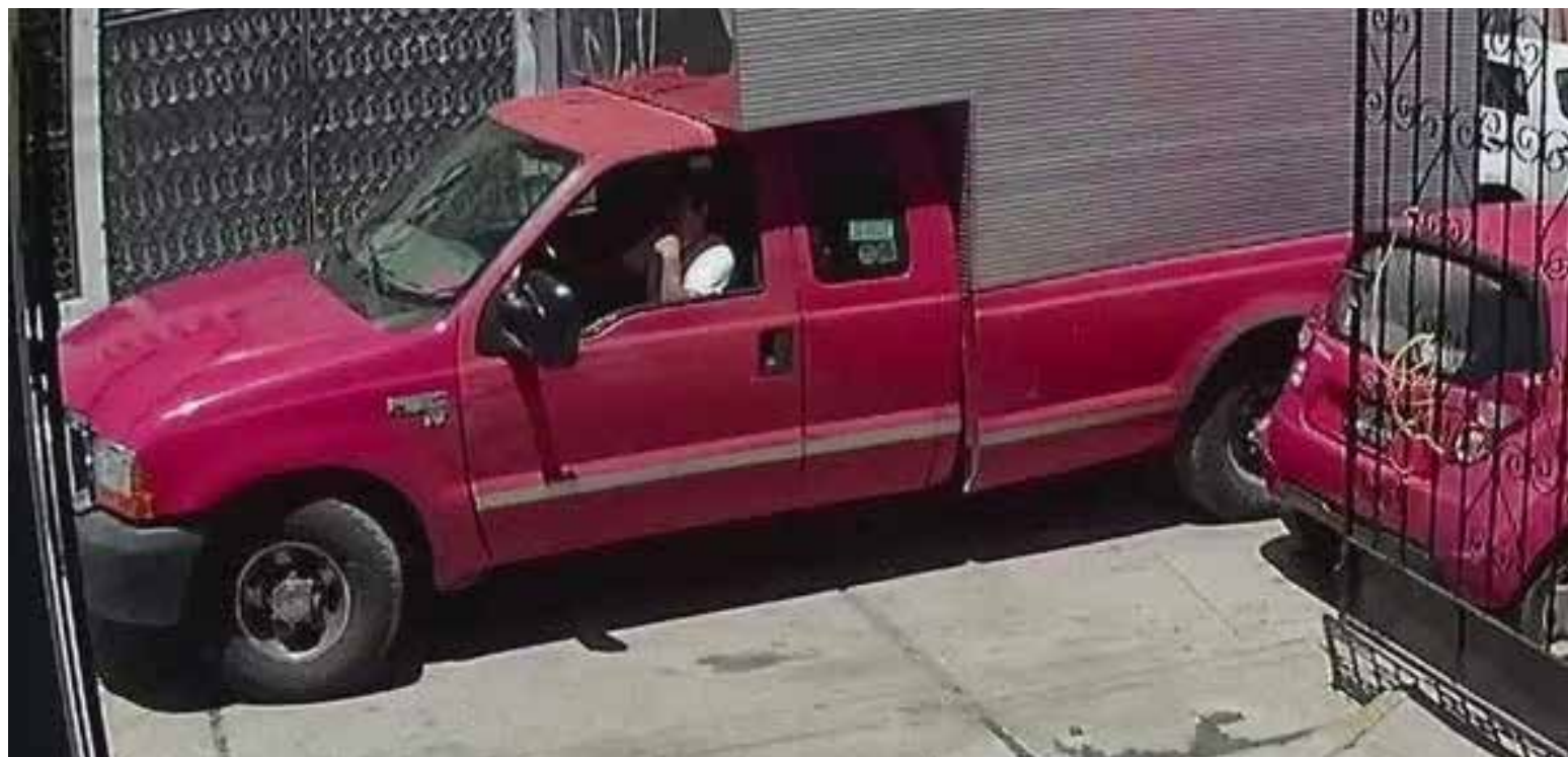
El pasado fin de semana, una camioneta fue robada cuando se encontraba estacionada en el primer cuadro de la ciudad

La unidad fue robada al filo de las 5:30 horas de la madrugada del día domingo 5 de Abril, se trata de una camioneta de la marca Ford tipo