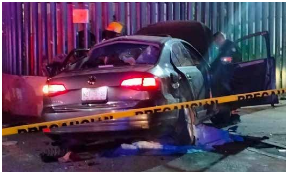
Elementos de seguridad acordonaron la zona para facilitar las labores de auxilio y permitir el desarrollo de las diligencias periciales.

Autoridades ya iniciaron las investigaciones correspondientes para determinar las causas exactas del hecho y deslindar responsabilidades, incluyendo la presunta conducción bajo los efectos del alcohol.