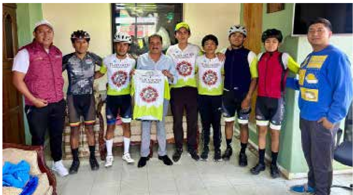
El Gobierno Municipal de Mixquiahuala de Juárez reitera que su prioridad es apoyar y atender las necesidades de todos los sectores deportivos

Mixquiahuala.- En reconocimiento a la importancia de todas las disciplinas deportivas en Mixquiahuala de Juárez, el Alcalde Miguel Ángel Peña Flores, continúa fortaleciendo el respaldo a los atletas locales. Como parte de este compromiso, hoy recibió al grupo Tlacuaches Aguamieleros, reafirmando el interés de la administración municipal por impulsar el deporte y promover espacios de desarrollo para la juventud y la comunidad en general. El Gobierno Municipal de Mixquiahuala de Juárez reitera que su prioridad es apoyar y atender las necesidades de todos los sectores deportivos, fomentando así la participación activa y el bienestar de la ciudadanía.