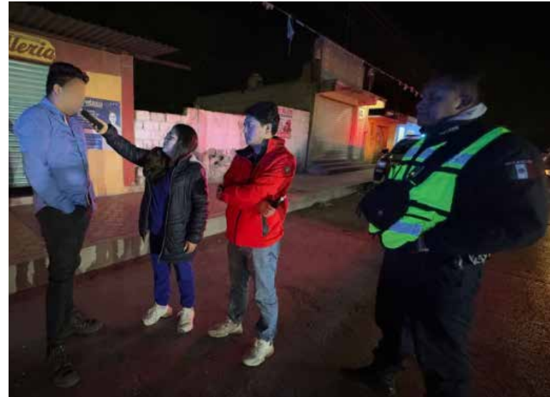
Como resultado, se aplicaron más de 30 pruebas de alcoholemia, logrando el aseguramiento de 16 personas y 6 vehículos

el aseguramiento de 16 personas y 6 vehículos, fortaleciendo la cultura de responsabilidad al volante. Autoridades reiteraron que estas acciones buscan salvaguardar la vida de la ciudadanía, destacando que la seguridad se construye con prevención y presencia en territorio.