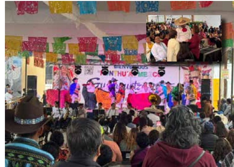
Autoridades y organizadores invitaron a la población a continuar participando en estas actividades, resaltando la importancia de preservar y compartir las tradiciones

pudieron vivir de cerca una de las expresiones culturales más representativas del país. Autoridades y organizadores invitaron a la población a continuar participando en estas actividades, resaltando la importancia de preservar y compartir las tradiciones que forman parte de la identidad mexicana.