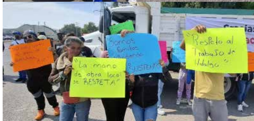
Los inconformes señalaron que la empresa encargada de los trabajos, originaria de Veracruz, pretende ingresar unidades de carga foráneas, dejando fuera a transportistas locales.