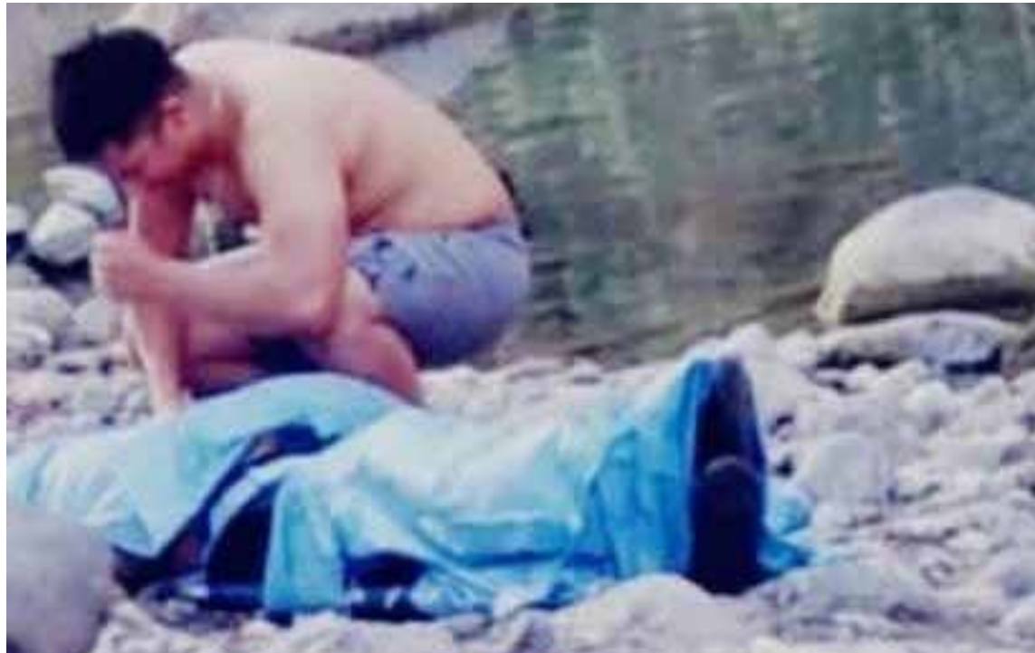
Se informó que la víctima se encontraba de visita en la región debido a la temporada vacacional, cuando ocurrió el incidente.

Autoridades señalaron que la familia manifestó su intención de trasladarlo directamente a su lugar de origen, en Calnali.