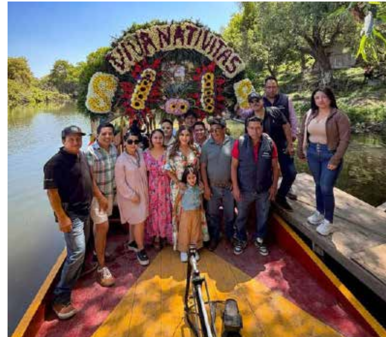
Se llevó a cabo un agradable paseo en trajinera en la comunidad de Atengo, perteneciente al municipio de Tezontepec

y la tranquilidad que caracteriza a este destino, consolidándolo como una opción atractiva para visitantes. Se extiende la invitación al público en general a conocer y vivir esta experiencia, así como a seguir apoyando iniciativas que impulsan el desarrollo turístico y social del municipio.