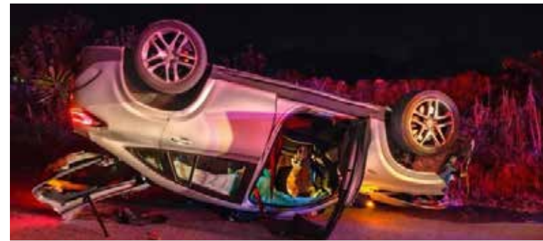
El accidente ocurrió a la altura de la comunidad de Boxtho, cerca de la curva conocida como "La Muñeco"