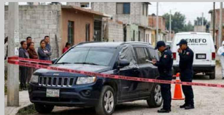
Al interior del vehículo fueron encontradas latas de bebidas alcohólicas