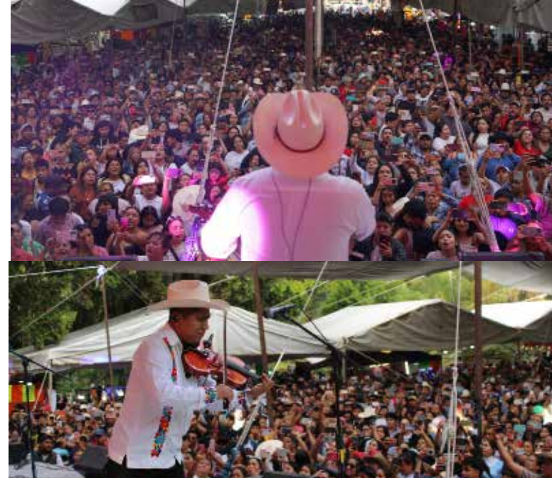
Uno de los eventos con mayor afluencia fue la presentación del Trío Aurora Hidalguense, quienes, con su sello característico, talento y dinamismo lograron poner a bailar a miles de asistentes

durante la celebración del Sábado de Gloria, consolidándose como uno de los momentos más destacados de esta temporada. El Gobierno Municipal de Progreso de Obregón, encabezado por la Ing. Lorena Estrada Flores, agradeció a todas las familias por su asistencia y respaldo en cada una de las actividades realizadas. Finalmente, se informó que las festividades se desarrollaron con saldo blanco, reflejo del orden, la coordinación y la participación responsable de la ciudadanía.