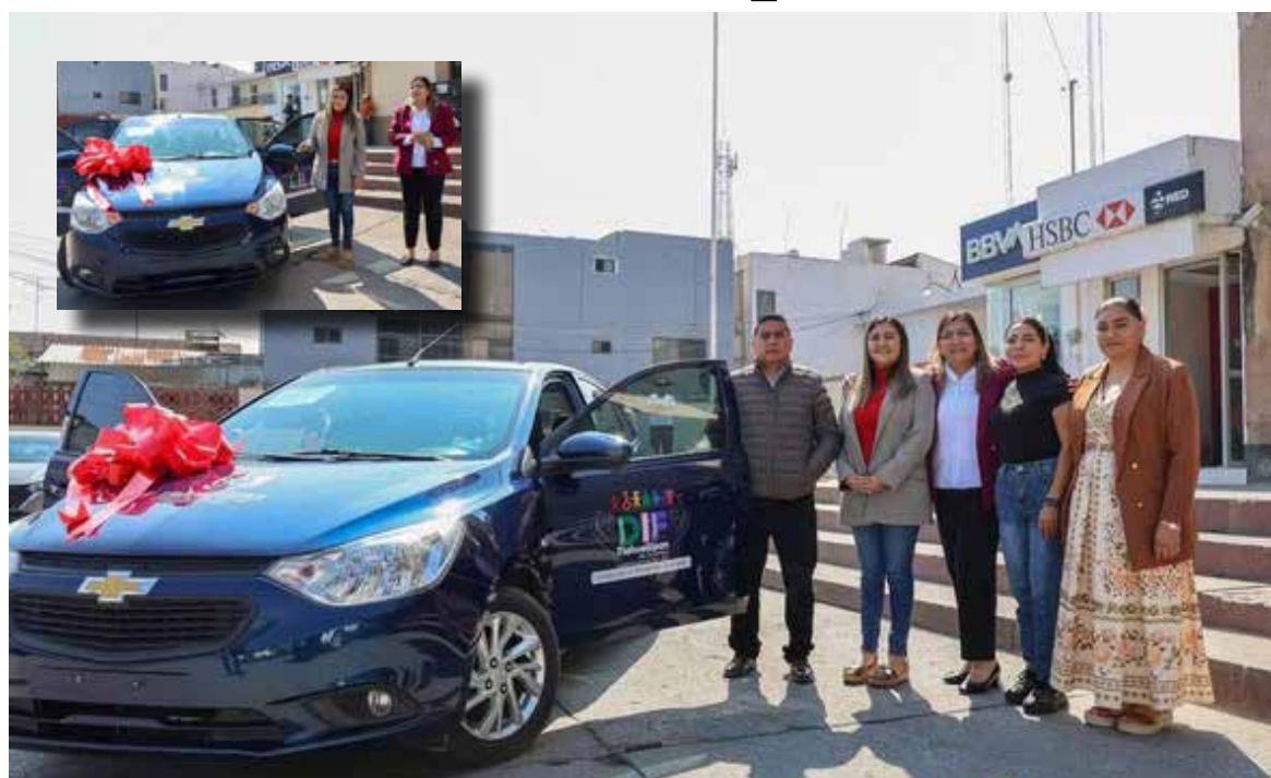
La nueva unidad permitirá ampliar la cobertura del servicio, llegar a más puntos del municipio y reducir los tiempos de traslado.

traslados no siempre son de carácter urgente, sí resultan necesarios para garantizar la continuidad en la atención médica y el bienestar de la población. La nueva unidad permitirá ampliar la cobertura del servicio, llegar a más puntos del municipio y reducir los tiempos de traslado. Con esta acción, el DIF Municipal busca hacer más eficiente la atención y brindar acompañamiento a quienes enfrentan dificultades para desplazarse, reforzando así el compromiso social con los sectores más vulnerables.