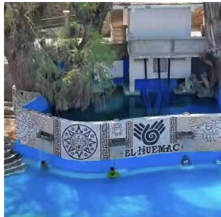
Algunos visitantes manifestaron sentirse sorprendidos, ya que el balneario no emitió avisos anticipados

previamente sobre estos cambios. Algunos visitantes manifestaron sentirse sorprendidos, ya que el balneario no emitió avisos anticipados. Hasta el momento, la administración del sitio no ha dado a conocer las razones de esta modificación, sin embargo se especula que pudiera ser por posibles inundaciones.