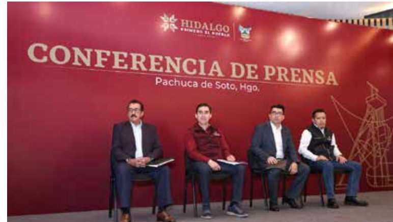
Se anunció la creación de un comité de seguimiento que permitirá fortalecer las acciones preventivas en los 84 municipios del estado

Tlanchinol ocho, Tenango de Doria seis y Huejutla de Reyes cinco. Ante este panorama, se anunció la creación de un comité de seguimiento que permitirá fortalecer las acciones preventivas en los 84 municipios del estado, independientemente de que presenten o no incidencia. Con estas acciones, el gobierno de Julio Menchaca Salazar refrenda su compromiso de trabajar de manera integral y cercana para atender las