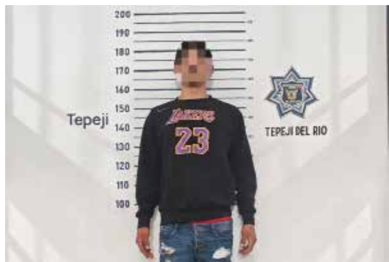
Tras realizarle una inspección preventiva, se le localizaron varias bolsas con sustancia prohibida.