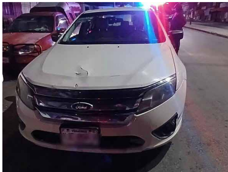
Los hechos ocurrieron en la colonia El Palmar, donde policías realizaban recorridos de vigilancia y detectaron una unidad que circulaba sin luces

Los hechos ocurrieron en la colonia El Palmar, donde policías realizaban recorridos de vigilancia y detectaron una unidad que circulaba sin luces y que además se pasó un semáforo en rojo, por lo que le marcaron