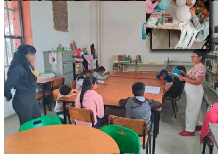
Los espacios bibliotecarios se han convertido en puntos de encuentro llenos de aprendizaje, creatividad y diversión