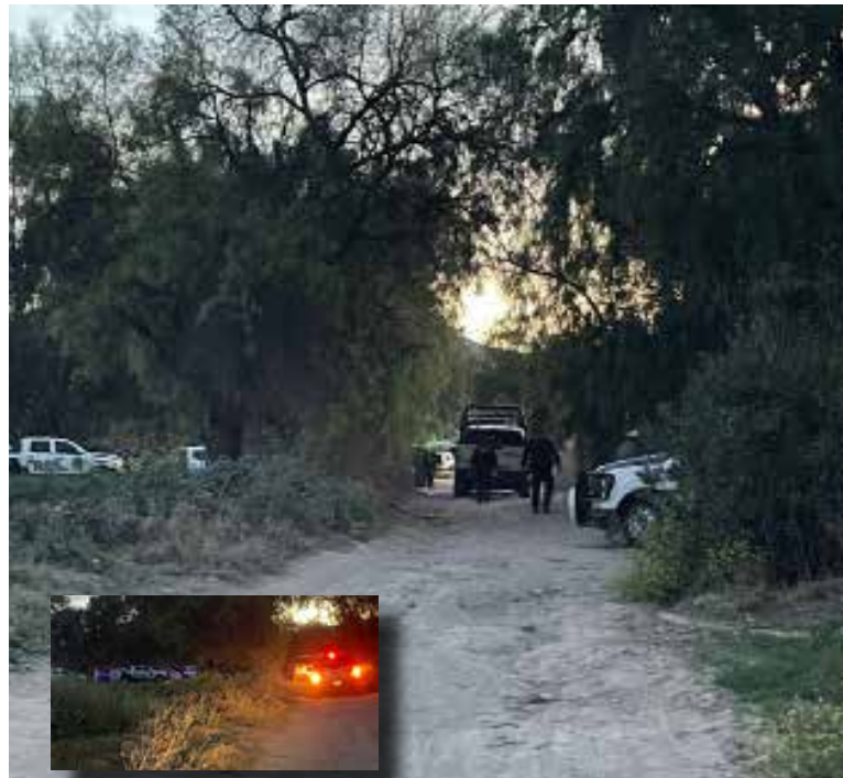
Los hechos se registraron en la colonia Danfhi en límites con la Colonia Reforma

señala que ya hay personas detenidas, presuntamente relacionadas con estos hechos; no obstante, las autoridades no han detallado su situación legal ni confirmado si la víctima ha sido localizada. Además, durante el operativo las autoridades habrían repelido una agresión a balazos, lo que derivó en un hombre muerto presunto integrante de un grupo criminal. Hasta el cierre de esta edición, se está a la espera de información oficial por parte de las autoridades.