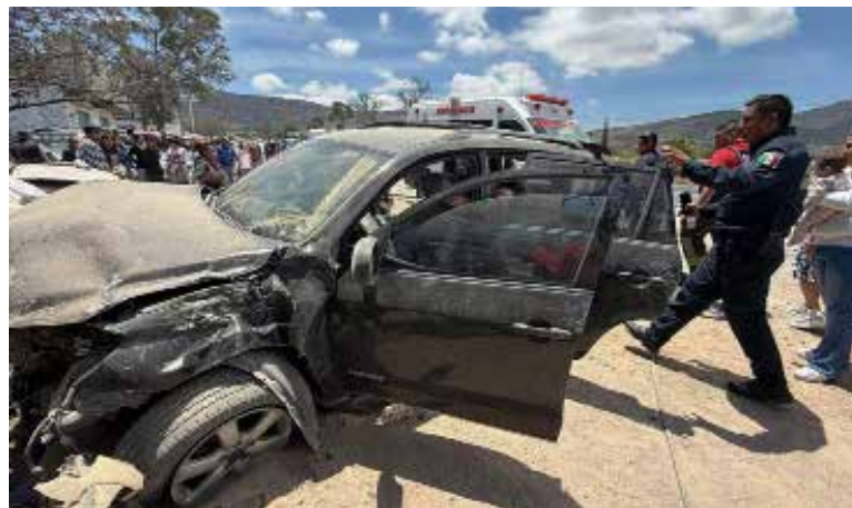
El conductor habría perdido el control de la unidad, lo que provocó que saliera del camino y terminara impactándose contra varios vehículos

El Arenal.- La tarde de este lunes se registró un percance vehicular en la conocida bajada de San Pedro, a la altura de la comunidad de Ojo de Agua, donde una camioneta en la que viajaba una familia se vio involucrada en un accidente. De acuerdo con información preliminar, el conductor habría perdido el control de la unidad, lo que provocó que saliera del camino y terminara impactándose contra varios vehículos que se encontraban en un deshuesadero de la zona.