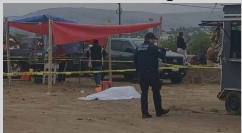
Paramédicos de Protección Civil confirmaron que la víctima ya no presentaba signos vitales

La zona fue acordonada por elementos de Seguridad Pública, en espera de peritos y agentes de investigación.