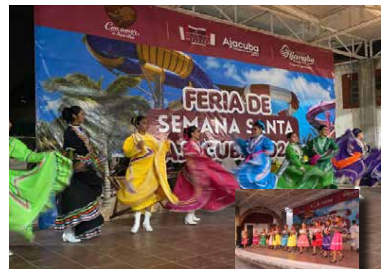
Con esta celebración, el Gobierno Municipal reafirma su compromiso de seguir promoviendo actividades que enaltezcan la cultura, las tradiciones y el orgullo de las y los ajacubenses.

y la presentación estelar del Internacional Carro Show de Antonio Hernández, que puso a bailar a las y los asistentes durante la clausura. Las autoridades municipales destacaron que este evento contribuye al fortalecimiento del tejido social, además de impulsar el turismo y la economía local. Con esta celebración, el Gobierno Municipal reafirma su compromiso de seguir promoviendo actividades que enaltezcan la cultura, las tradiciones y el orgullo de las y los ajacubenses.