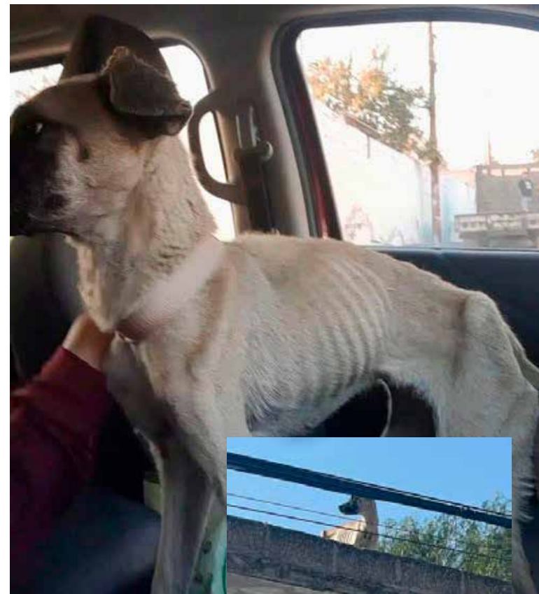
Dos de las tres perritas que se localizaron lograron ser rescatadas gracias al trabajo coordinado de grupos protectores de los animales

Además, se dio a conocer que la tercera perrita será entregada en próximos días para su valoración y atención correspondiente. El gobierno municipal que encabeza la presidenta Norma Leticia Reyes Reyes, reiteró el llamado a los vecinos para promover y fomentar la tenencia responsable de mascotas, en ambientes y condiciones adecuadas, así como con la debida atención vacunación y alimentación.