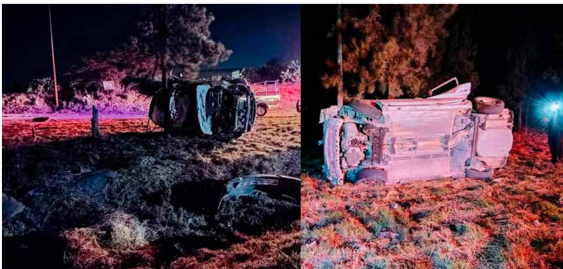
En el lugar se localizó un vehículo compacto que salió del camino y posteriormente volcó, resultando lesionados sus dos ocupantes

Tras la valoración inicial, paramédicos del cuerpo de Bomberos de Atitalaquia