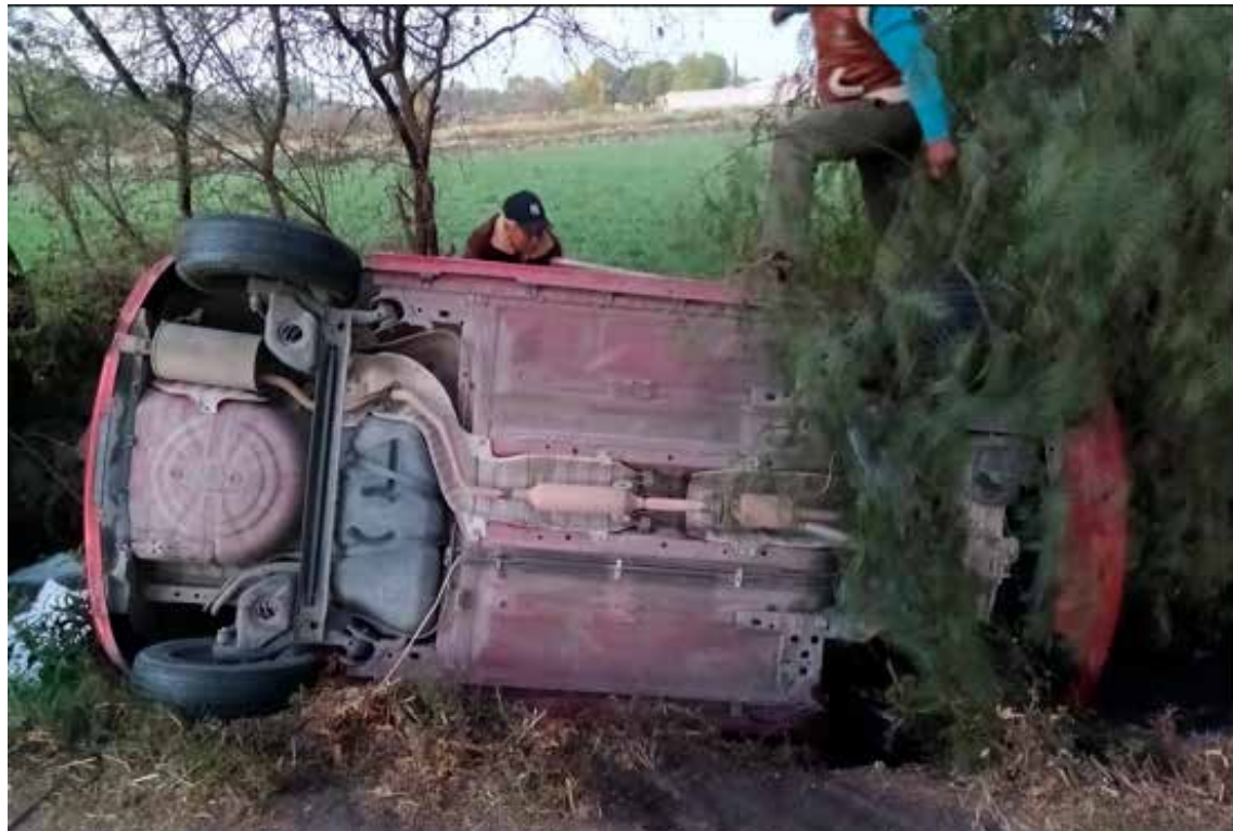
Elementos de la Dirección de Seguridad Pública Municipal auxiliaron a una mujer que se encontraba en el interior de un automóvil que estaba volcado

Paramédicos confirmaron que ambos jóvenes ya no contaban con signos vitales.