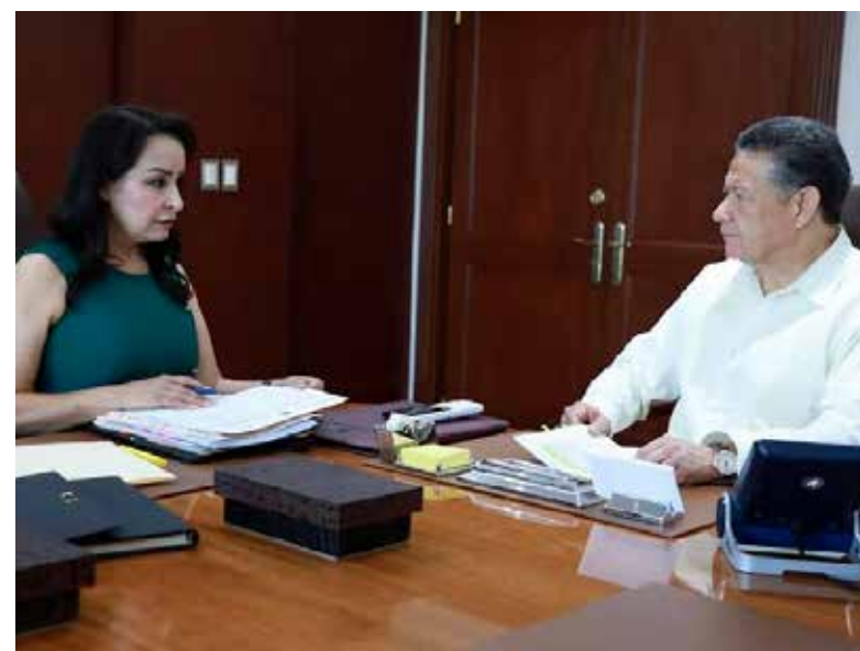
Hidalgo se consolida como un estado que administra sus recursos con mayor transparencia, eficacia y disciplina fiscal

incremento en las cifras virtuales fiscalizadas, pasando de 10 a 128 millones de pesos, monto que permitirá que se fortalezcan los ingresos estatales y municipales a través del Fondo de Fiscalización y Recaudación, a partir del segundo semestre del presente ejercicio fiscal. Al alcanzar el primer lugar nacional en eficiencia recaudatoria, Hidalgo se consolida como un estado que administra sus recursos con mayor transparencia, eficacia y disciplina fiscal, en línea con la transformación impulsada por el gobernador Julio Menchaca.