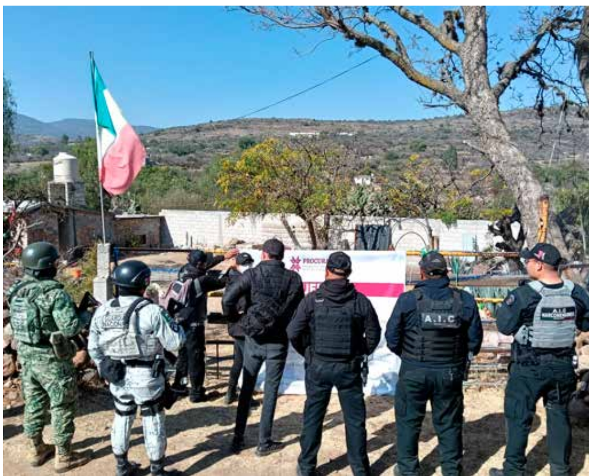
En el interior de la propiedad fue localizada una entrada simulada como registro de fosa séptica

El sitio quedó bajo resguardo de las autoridades mientras continúan las investigaciones para determinar responsabilidades. Hasta el momento no se ha informado sobre personas detenidas relacionadas con estos hechos.