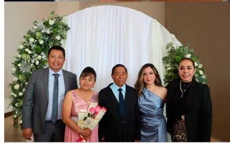
Con acciones como estas, el gobierno municipal refrenda su compromiso de trabajar con unidad y responsabilidad, impulsando políticas que fortalecen la seguridad legal y el bienestar de las familias de Tlahuelilpan.