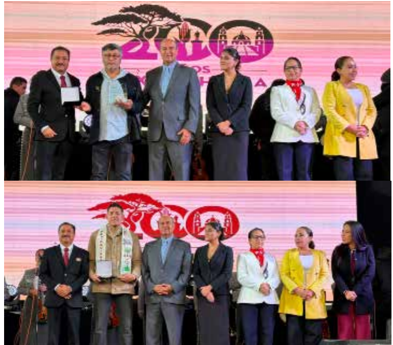
Autoridades municipales destacaron la importancia de reconocer a quienes, desde distintos ámbitos, contribuyen al desarrollo y orgullo de la comunidad