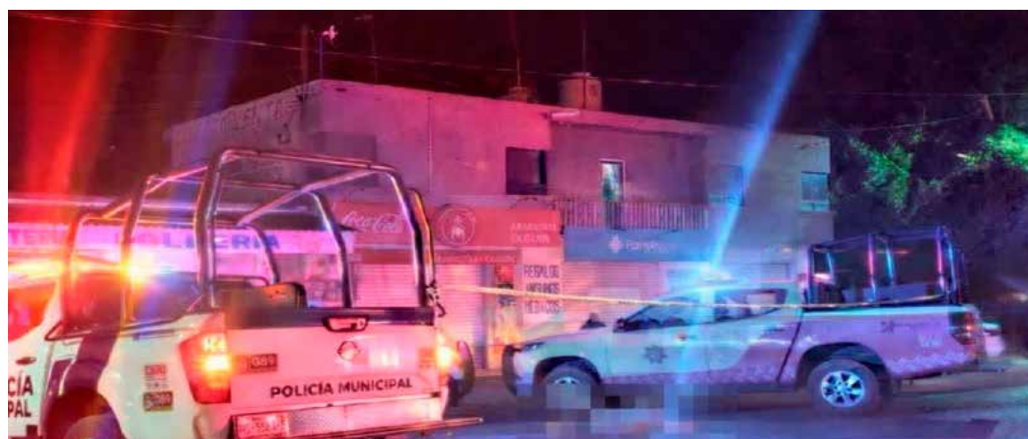
El conductor del vehículo involucrado abandonó el sitio tras el incidente

Por su parte, elementos de Seguridad Pública