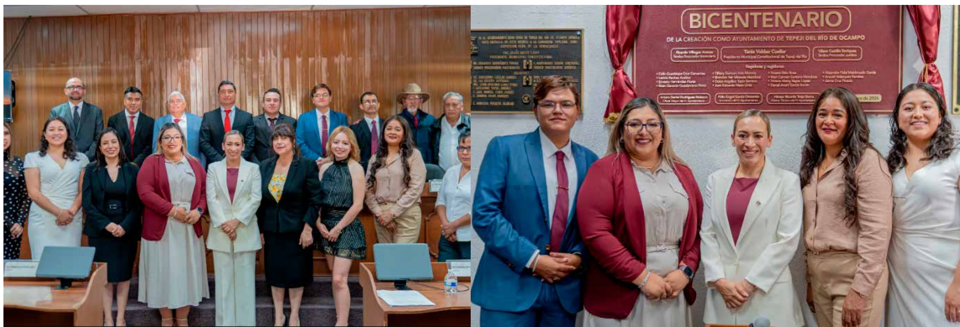
Sesión solemne de Cabildo con motivo del Bicentenario de la creación del Ayuntamiento, al cumplirse 200 años de su instalación