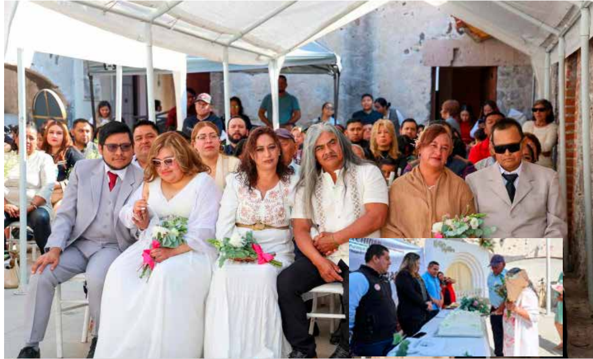
Ceremonia Bodas Colectivas Actopan 2026, en el marco del Día del Amor y la Amistad