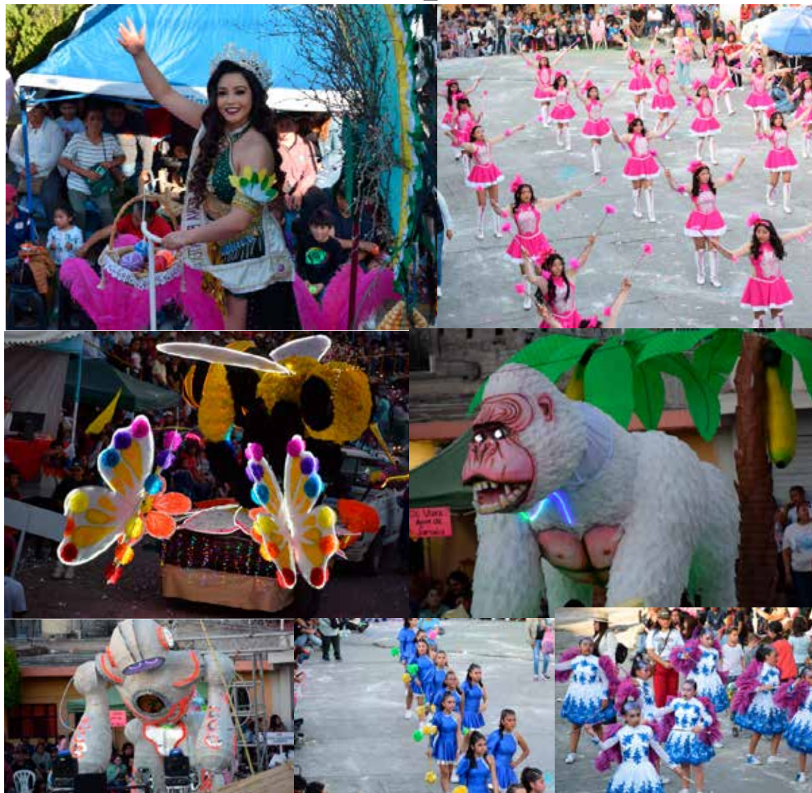
Personal de la Dirección de Protección Civil Municipal coordinó las acciones preventivas para salvaguardar la integridad de asistentes y participantes

Mixquiahuala de Juárez.- Con una destacada participación en las categorías de carros alegóricos, comparsas e individuales, se llevó a cabo el desfile del Carnaval 2026 en el municipio, donde cientos de familias se congregaron a lo largo del recorrido para disfrutar de esta tradicional festividad. El contingente avanzó por las principales calles en un ambiente totalmente familiar. Como es característico de esta celebración, no faltaron los huevazos y la espuma; sin embargo, la jornada transcurrió con orden y sin incidentes mayores. Personal de la Dirección de Protección Civil Municipal coordinó las acciones preventivas para salvaguardar la integridad de asistentes y participantes, reportándose saldo blanco