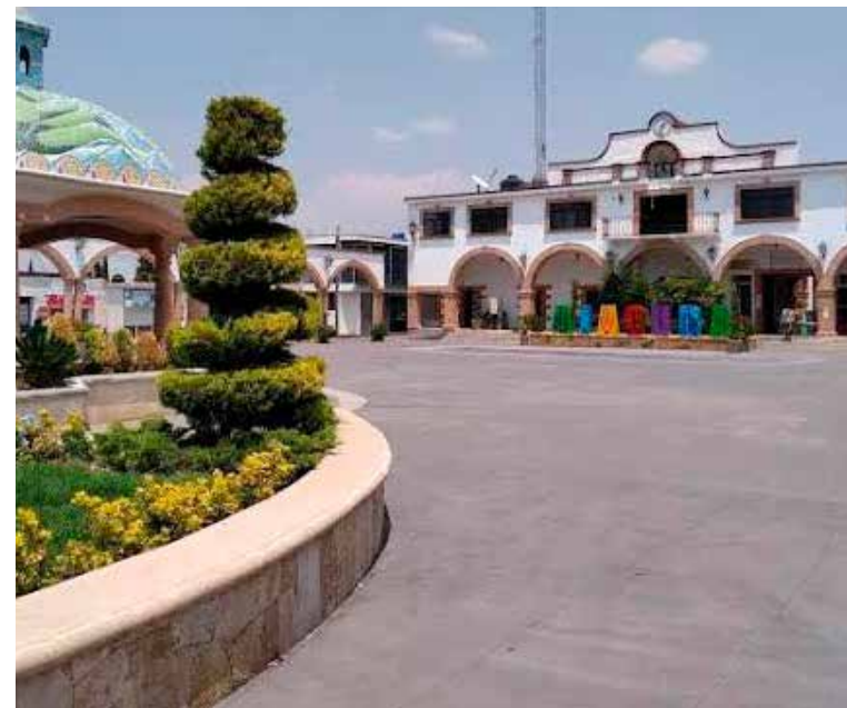
Diversas voces señalan que, es indispensable que exista plena claridad sobre el procedimiento de acreditación y la documentación presentada ante la autoridad electoral

públicamente que los requisitos de acreditación fueron cumplidos conforme a la ley. Que informe con claridad el procedimiento seguido para validar dicha candidatura. Que de haber presentado información y documentación falsa, se actúe conforme a la ley. La ciudadanía de Ajacuba merece respuestas claras, por eso hace un llamado enérgico al El Instituto Estatal Electoral para que atienda esta situación, hoy tiene la oportunidad y la responsabilidad de garantizar que la legalidad y el espíritu de inclusión se respeten plenamente.