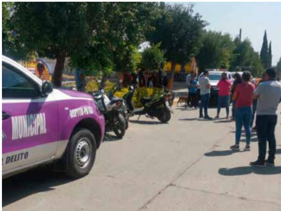
Tras un diálogo con autoridades municipales, el individuo fue trasladado a la celda de retención primaria

algunos vecinos se negaban a entregarlo a las autoridades, ante el temor de que pudiera quedar en libertad. Sin embargo, tras un diálogo con autoridades municipales, el individuo fue trasladado a la celda de retención primaria y posteriormente puesto a disposición de la Agencia del Ministerio Público de Mixquiahuala, donde se determinará su situación legal. No se descarta que el sujeto pudiera estar relacionado con ataques a mujeres similares ocurridos recientemente en la zona de Mixquiahuala y Progreso de Obregón, lo que ha generado preocupación entre la población. Las autoridades exhortaron a la ciudadanía a presentar denuncias formales en caso de haber sido víctimas, a fin de fortalecer las investigaciones correspondientes