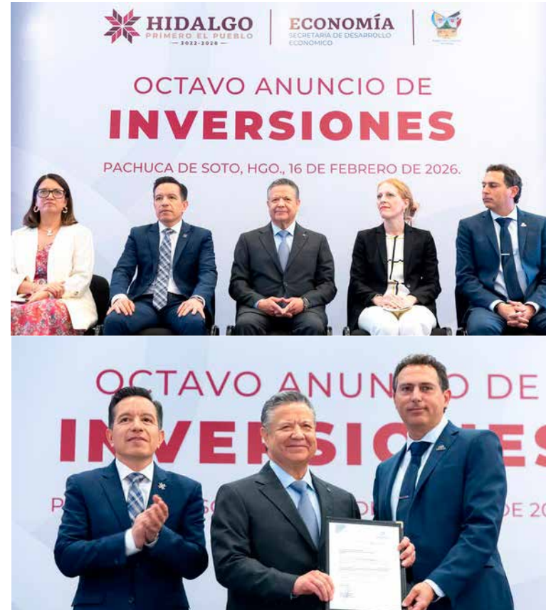
Este año, durante 2026, se va a superar la inversión privada de las tres administraciones anteriores