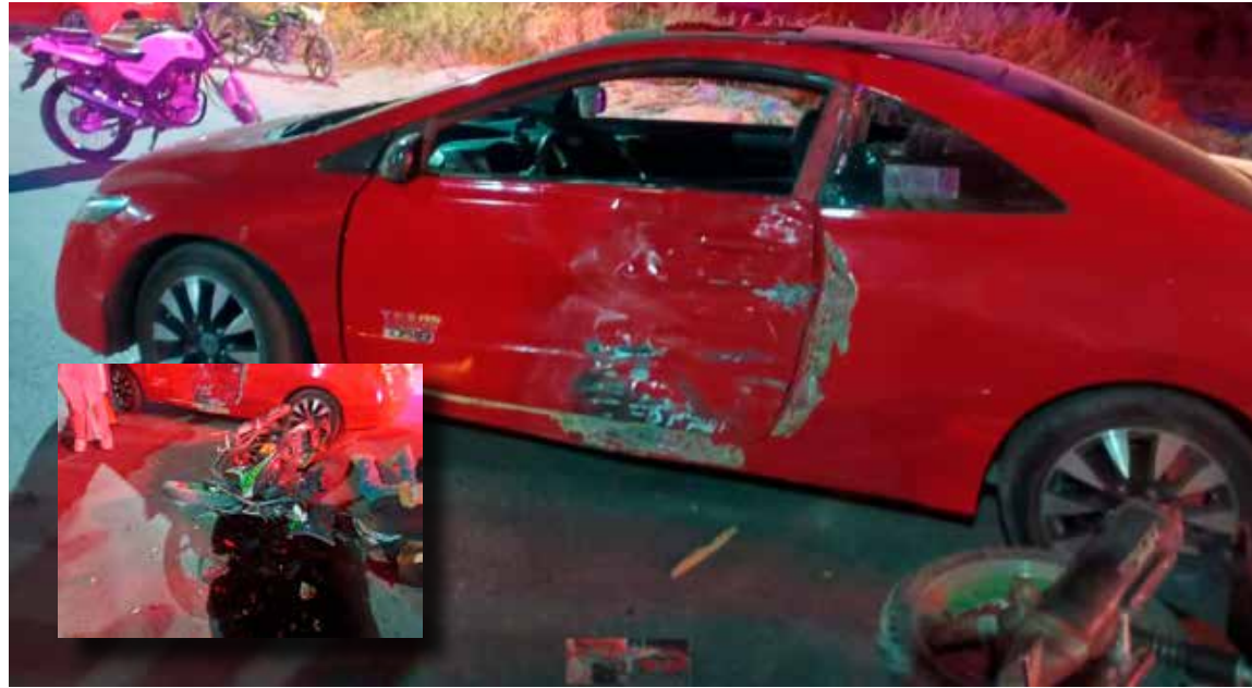
Al lugar arribaron elementos de la Cruz Roja Mexicana, quienes brindaron atención prehospitalaria al lesionado

de la Cruz Roja Mexicana, quienes brindaron atención prehospitalaria al lesionado. Paramédicos realizaron la valoración correspondiente en el sitio y, debido a la gravedad de las heridas, procedieron a su traslado inmediato a un hospital para recibir atención médica especializada. La circulación en la zona se vio afectada de manera parcial mientras se realizaban las labores de auxilio y retiro de las unidades involucradas.