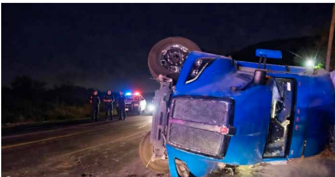
La pesada unidad quedó recostada sobre uno de sus costados a un lado de la cinta asfáltica.

Según los primeros informes, la pesada unidad quedó recostada sobre uno