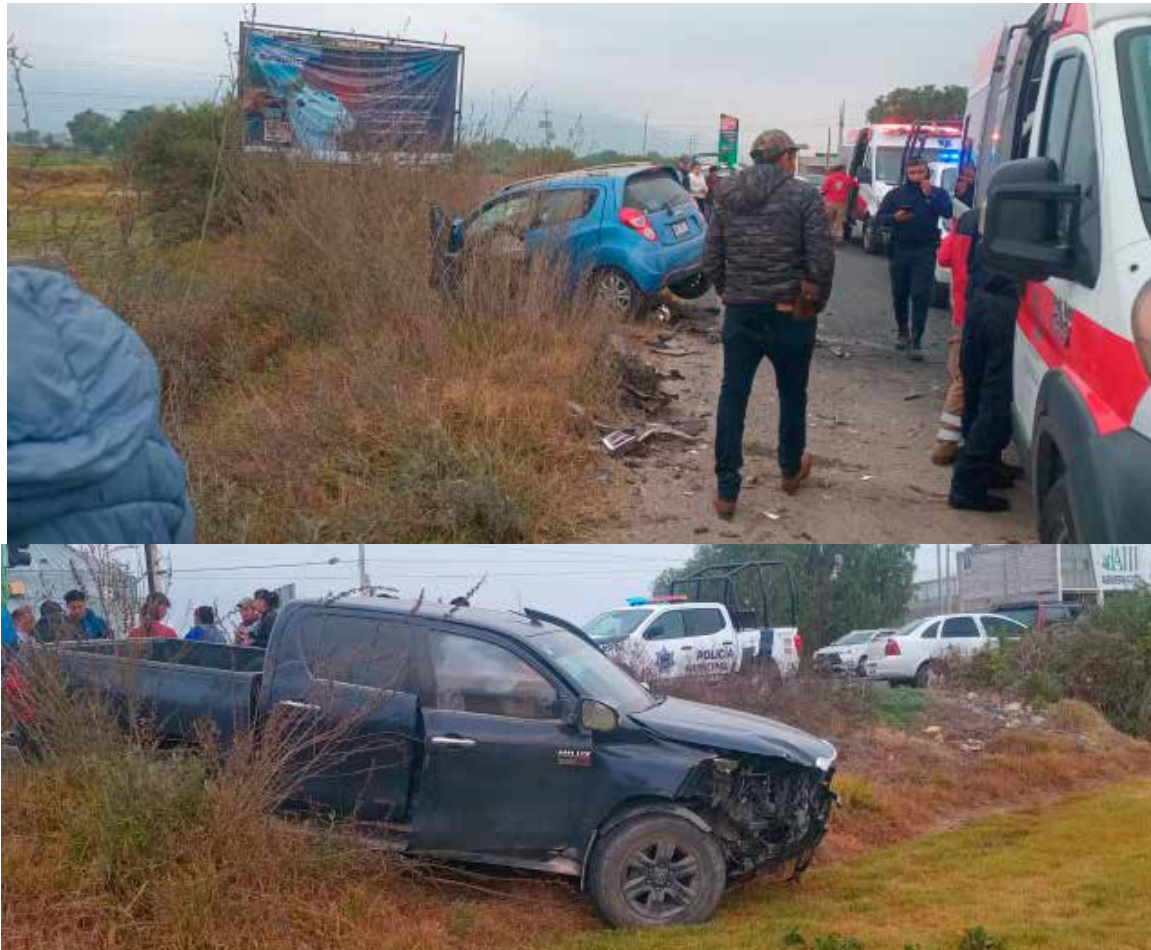
El conductor de un vehículo compacto, manejaba en evidente estado de ebriedad

Francisco I. Madero.- Un fuerte impacto entre dos unidades particulares se registró a temprana hora de la mañana de pasado día domingo 15 de febrero, justo a la altura de los semáforos, sobre el libramiento de Francisco I. Madero. Según testigos del hecho, el conductor de un vehículo compacto marca Chevrolet tipo Spark, de color azul y con placas del estado de Hidalgo, manejaba en evidente estado de ebriedad provocando