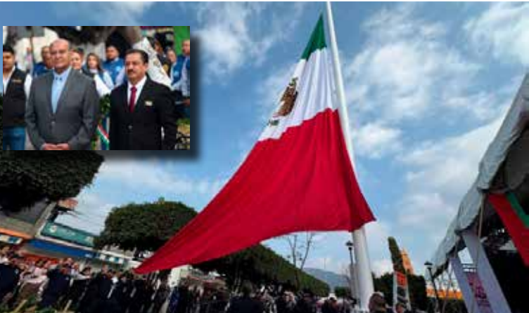
Se realizó el izamiento del lábaro patrio y la develación de la Placa Conmemorativa por los 200 años