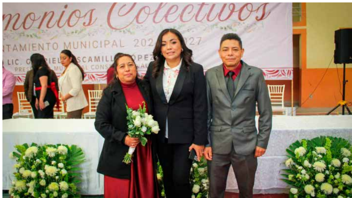
Diversas parejas formalizaron su unión durante la celebración de bodas colectivas

Autoridades municipales reiteraron su reconocimiento a quienes decidieron formalizar su matrimonio en esta significativa fecha.