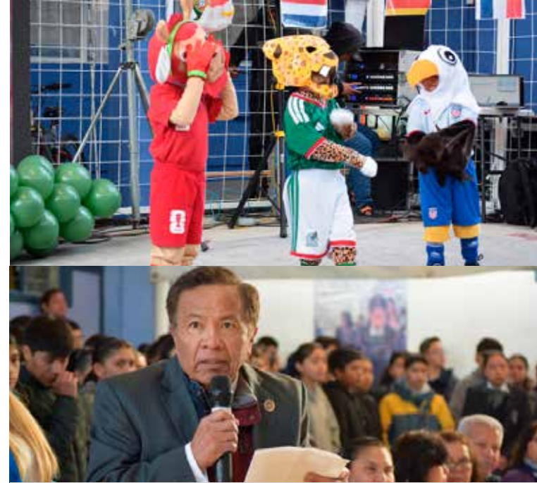
28 Expo Educativa reafirma el esfuerzo constante del Colegio Jean Piaget por mantenerse a la vanguardia

seguridad, dominio de los temas y trabajo en equipo. Uno de los momentos más emotivos fue la participación de los pequeños de preescolar, quienes ofrecieron presentaciones musicales ante padres de familia y visitantes, fortaleciendo el vínculo entre escuela y comunidad. La 28 Expo Educativa reafirma el esfuerzo constante del Colegio Jean Piaget por mantenerse a la vanguardia y el entusiasmo de sus alumnos por aprender, innovar y prepararse en el uso de nuevas tecnologías.