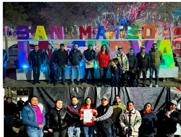
Como parte de esta jornada significativa, se llevó a cabo la develación de las letras monumentales

Autoridades municipales y habitantes coincidieron en que este tipo de acciones reflejan el compromiso del Gobierno Municipal de Tepetitlán por seguir trabajando de la mano de la ciudadanía para impulsar el bienestar y el progreso de sus comunidades.