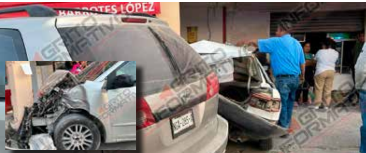
Las autoridades exhortaron a la ciudadanía a extremar precauciones al transitar por el área