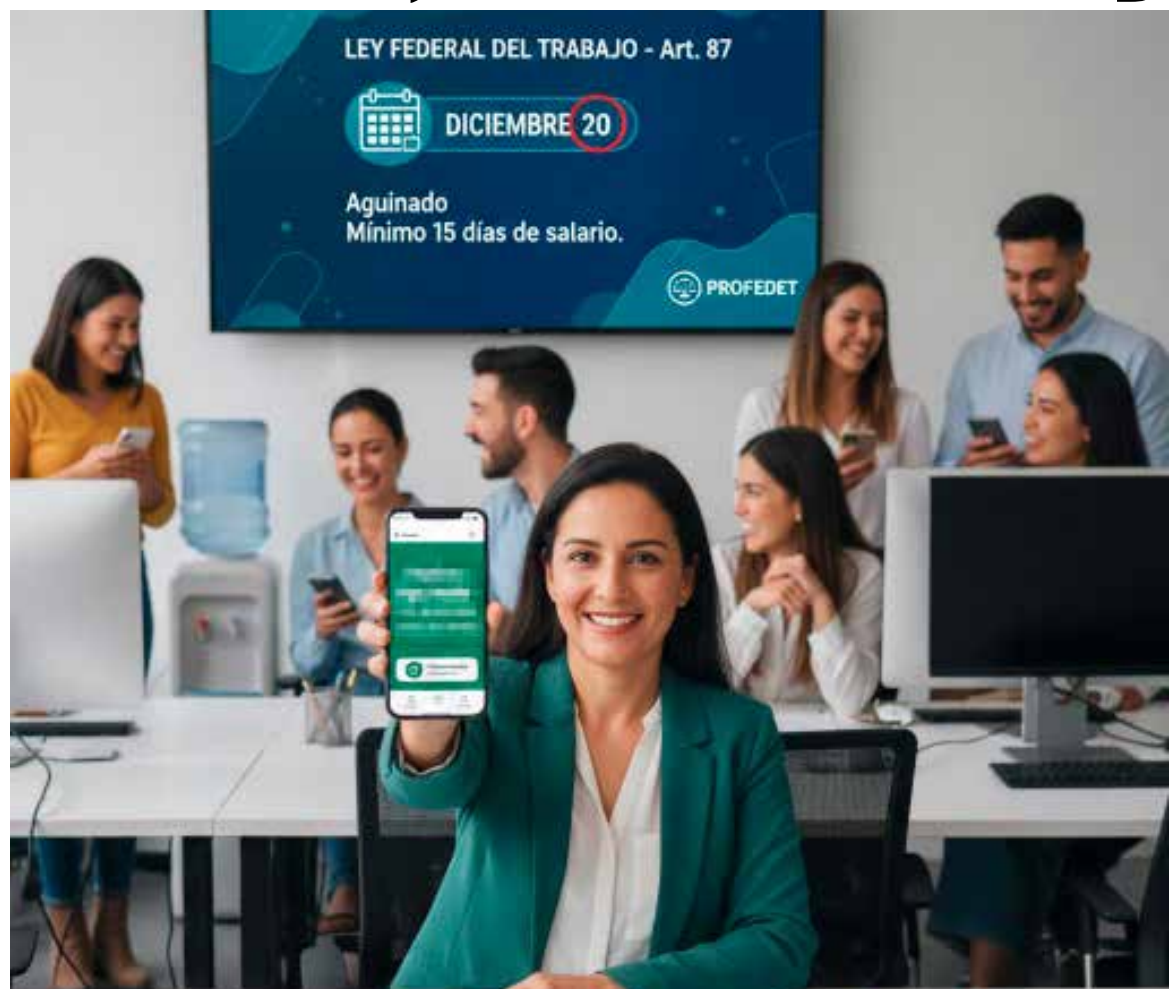
Las autoridades laborales recomiendan a los empleados verificar el pago oportuno de esta prestación

El aguinaldo es una prestación obligatoria y un derecho laboral fundamental que busca contribuir a la economía de las familias trabajadoras al cierre del año.