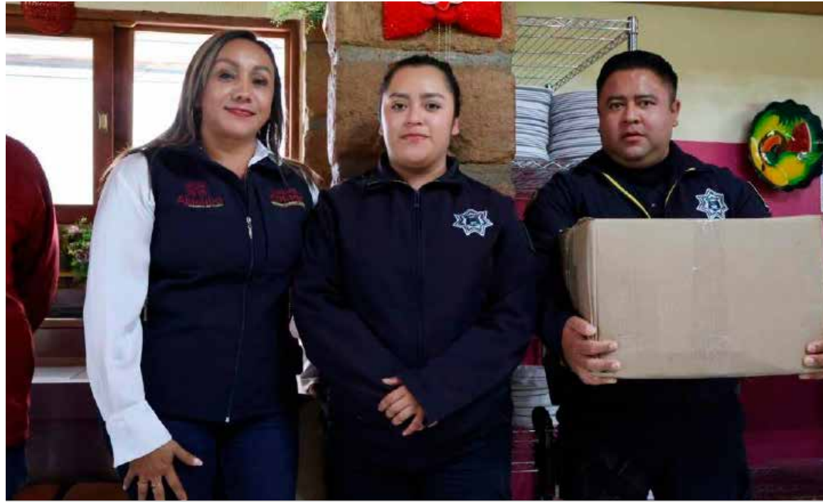
El Gobierno Municipal refrenda su reconocimiento y respaldo a quienes trabajan diariamente por la seguridad y tranquilidad de Ajacuba.

de vida y gastos médicos para el personal policial, como parte de las acciones orientadas a fortalecer su bienestar y el de sus familias. Asimismo, se entregaron despensas como muestra de agradecimiento por su compromiso, valentía y vocación de servicio en la protección del municipio. Con este acto, el Gobierno Municipal refrenda su reconocimiento y respaldo a quienes trabajan diariamente por la seguridad y tranquilidad de Ajacuba.