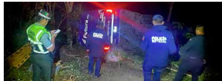
Al lugar acudieron paramédicos, cuerpos de rescate, Protección Civil y corporaciones de seguridad

La unidad, que cubría la ruta Pachuca-Huejutla, se vio involucrada en un siniestro de gran magnitud que dejó un saldo preliminar de cinco personas fallecidas —cuatro hombres y una mujer—, así como más de 20 pasajeros lesionados, varios de ellos con heridas de consideración. De acuerdo con versiones iniciales, el operador del