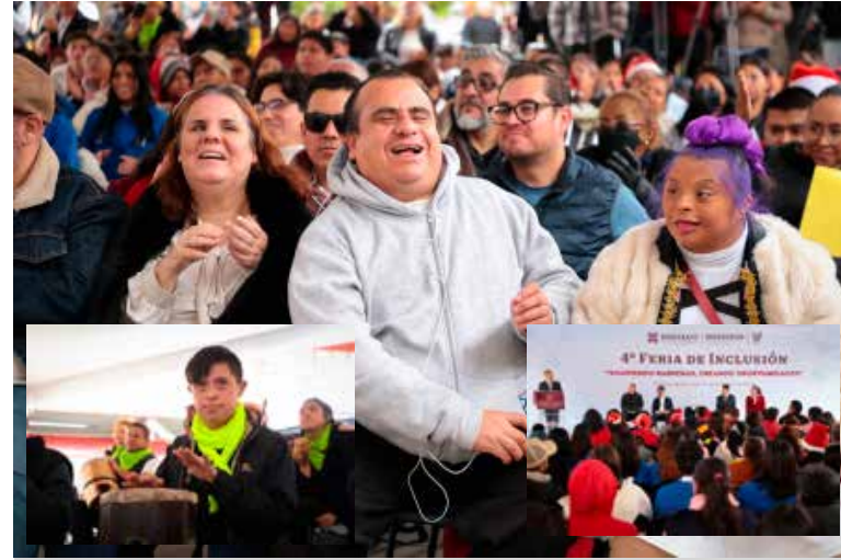
4.a Feria Regional de Inclusión “Rompiendo Barreras, Creando Oportunidades”