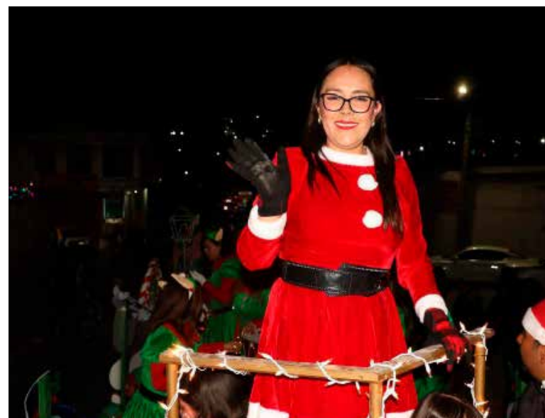
El desfile navideño se consolidó como un espacio de unión comunitaria y colaboración entre gobierno, sector educativo, iniciativa privada y ciudadanía

participaron de manera coordinada, reflejando el trabajo institucional y el compromiso con la promoción de actividades que fomentan la convivencia social y las tradiciones locales. El desfile navideño se consolidó como un espacio de unión comunitaria y colaboración entre gobierno, sector educativo, iniciativa privada y ciudadanía, reafirmando su importancia como una celebración que fortalece la identidad y el sentido de pertenencia en Atotonilco de Tula.