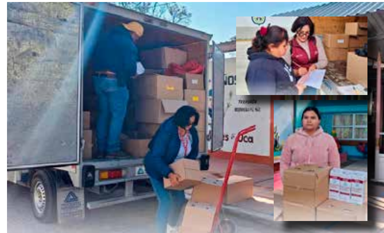
Entrega de desayunos escolares en modalidad fría a 21 escuelas beneficiarias del municipio.

Con estas acciones, el SMDIF Mixquiahuala reafirma su compromiso con el bienestar de la niñez, trabajando de manera responsable y cercana para impulsar un mejor presente y futuro para las y los estudiantes del municipio.