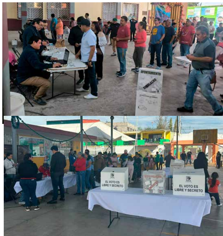
La Semarnat y el Gobierno de Hidalgo destacaron que este ejercicio reafirma la convicción democrática de la Cuarta Transformación

La Semarnat y el Gobierno de Hidalgo destacaron que este ejercicio reafirma la convicción democrática de la Cuarta Transformación y reconocieron el trabajo técnico, profesional e imparcial del IEEH, además de agradecer la participación de la ciudadanía de los tres municipios involucrados.