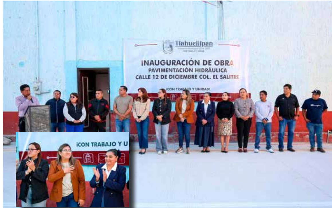
El Gobierno Municipal reafirmó que, con trabajo coordinado y unidad, se continuará transformando calles y espacios públicos

El Gobierno Municipal reafirmó que, con trabajo coordinado y unidad, se continuará transformando calles y espacios públicos para brindar mayor bienestar a la población.