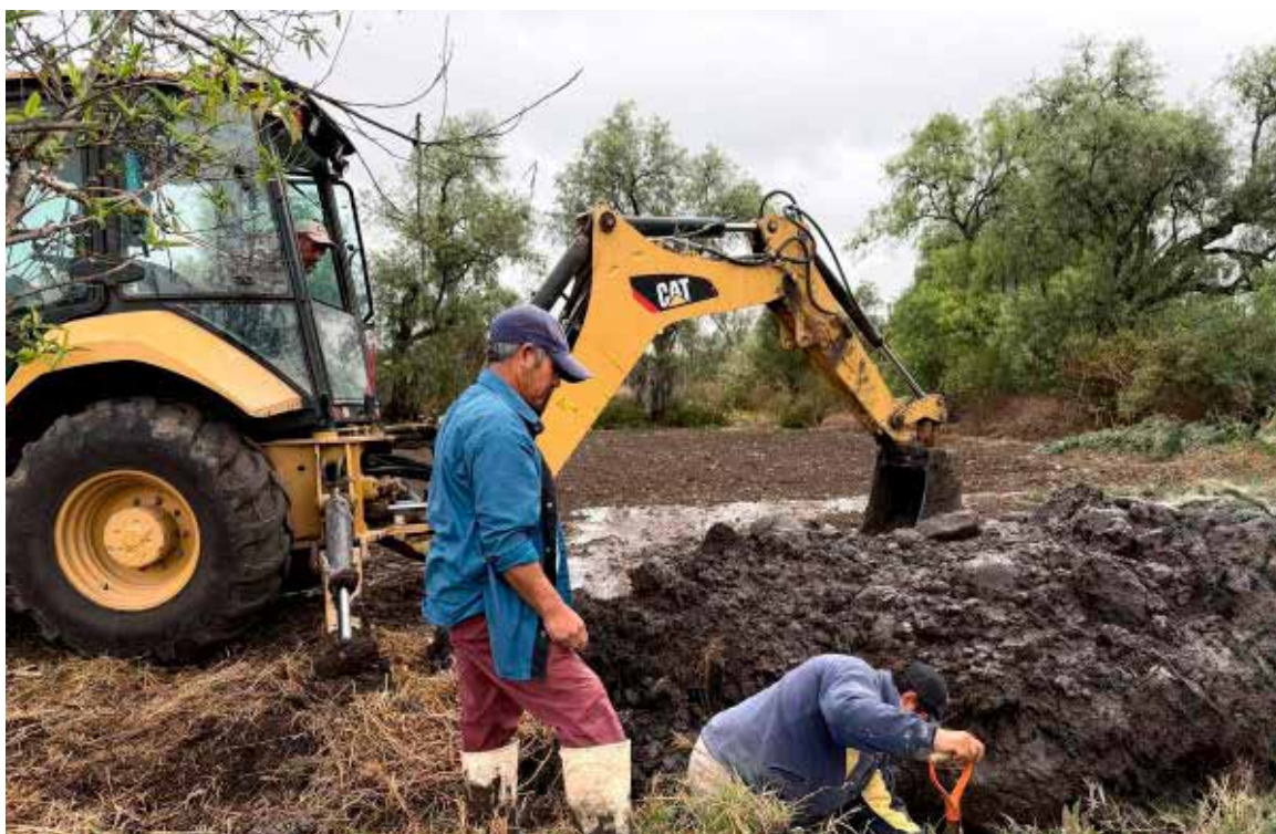
El Gobierno Municipal continúa avanzando en la construcción de mejores condiciones de vida para las y los habitantes de Tezontepec de Aldama.

garantizando un acceso más eficiente y continuo al agua potable en beneficio de las familias del municipio. Las autoridades municipales reiteraron su compromiso de impulsar obras prioritarias, enfocadas en el desarrollo urbano y el bienestar social, mediante un trabajo responsable y coordinado entre los distintos niveles e instancias involucradas. Con estas acciones, el Gobierno Municipal continúa avanzando en la construcción de mejores condiciones de vida para las y los habitantes de Tezontepec de Aldama.