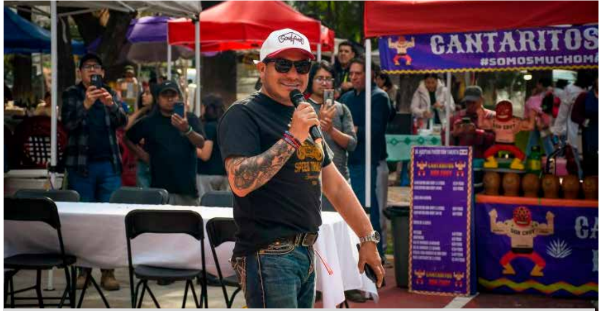
El festival no solo promovió la gastronomía regional, sino que también impulsó el orgullo y la identidad local

El festival no solo promovió la gastronomía regional, sino que también impulsó el orgullo y la identidad local, al brindar visibilidad a proyectos que apuestan por la calidad y la tradición. Con una respuesta positiva del público, el Segundo Festival de Parrilleros reafirmó que Ixmiquilpan cuenta con talento, pasión y una fuerte cultura gastronómica, proyectándose como un referente en este tipo de encuentros.