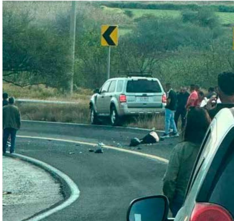
Al sitio acudieron cuerpos de emergencia y autoridades de seguridad, quienes confirmaron el fallecimiento

La circulación se vio parcialmente afectada durante varios minutos, por lo que se exhorta a los automovilistas a extremar precauciones, especialmente en tramos de curvas y zonas de alto riesgo.