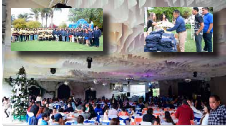
El director general reiteró el llamado a continuar trabajando de manera conjunta para fortalecer los servicios de salud en Tula

sociales que distinguen a Grupo ANKHAL y MEDENS. En este sentido, anunció que se buscará colaborar con el Hospital General de Tula de Allende para que, los fines de semana, el quirófano del Grupo Hospitalario MEDENS pueda ser utilizado de manera gratuita, además, de que se realizarán estudios médicos a precios económicos en beneficio de quienes más lo necesitan, una iniciativa que refleja el compromiso genuino con la vida y la dignidad humana. La posada fue pensada para toda la familia: niñas y niños disfrutaron de inflables, mientras que la música de mariachi y un grupo musical llenaron de alegría la noche. Las rifas, los obsequios y la entrega