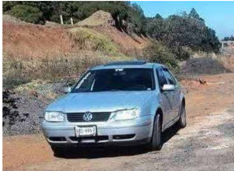
La madre de uno de los desaparecidos difundió la búsqueda en redes sociales, pero horas después, el 8 de febrero, autoridades poblanas localizaron el vehículo abandonado en la autopista

La madre de uno de los desaparecidos difundió la búsqueda en redes sociales, pero horas después, el 8 de febrero, autoridades poblanas localizaron el vehículo abandonado en la autopista Tlaxco-Tejocotal, entre Chignahuapan y Zacatlán. Posteriormente, en el kilómetro 69 de la misma vialidad, fueron hallados los tres cuerpos.