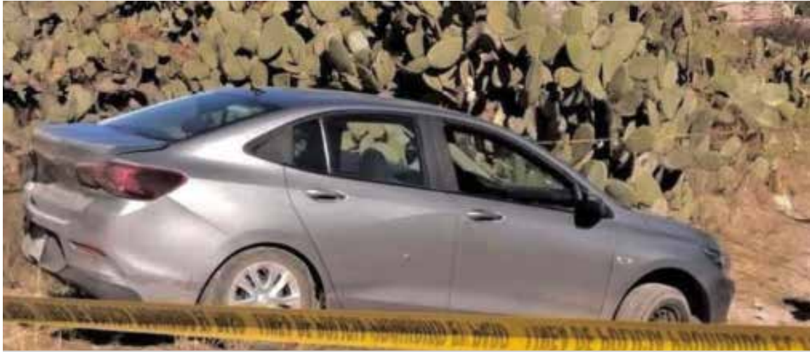
Sujetos armados le dispararon en múltiples ocasiones hasta quitarle la vida.

Mineral de la Reforma.- Un hombre fue ejecutado la tarde del pasado viernes tras una persecución que terminó en una balacera en los límites de los fraccionamientos Virreyes y La Providencia, en Mineral de la Reforma. De acuerdo con los primeros reportes, la víctima intentó huir en su vehículo, un Chevrolet gris, pero fue alcanzada en un camino de terracería en la comunidad de San José Palacios, cerca de Epazoyucan. Ahí, sujetos armados