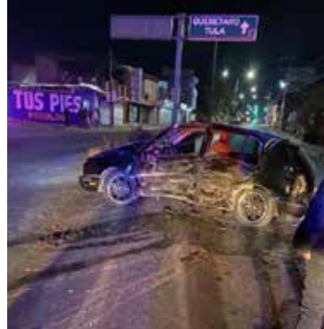
Accidentecinco personas lesionadas y cuantiosos daños materiales en los automóviles involucrados.