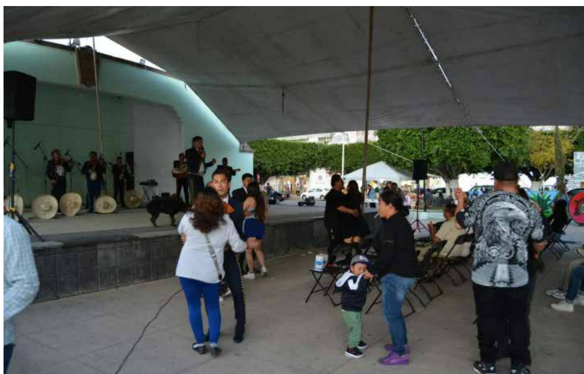
El cierre del evento estuvo a cargo del Mariachi Juvenil Consentido, que con su energía y pasión por la música mexicana, puso el broche de oro a la velada, arrancando aplausos y ovaciones del público.

Los Domingos Culturales se han consolidado como un espacio donde artistas locales pueden compartir su talento, al tiempo que las familias disfrutan de espectáculos de calidad en un ambiente sano y de esparcimiento.