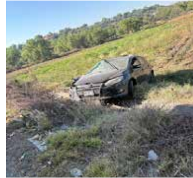
El accidente se registró justo a la altura de las instalaciones de la empresa Gutgar

Según pudo conocerse, en el vehículo viajaban dos masculinos y un mujer en aparente estado de ebriedad, quienes por fortuna y pese a lo aparatoso del percance no resultaron con lesiones de consideración, por lo que únicamente fueron valorados en el lugar, por paramédicos de Cruz Roja.