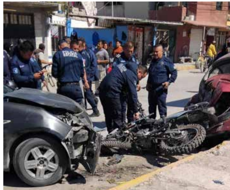
En el incidente, dos automóviles que estaban estacionados resultaron con daños

En el incidente, dos automóviles que estaban estacionados resultaron con daños, por fortuna la unión de la comunidad no se hizo esperar y evitaron que dichas unidades fueran aseguradas por la policía para llegar a un arreglo entre particulares por los daños que se generaron.