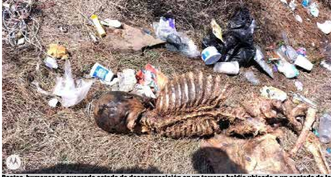
Restos humanos en avanzado estado de descomposición en un terreno baldío ubicado a un costado de la carretera Jorobas-Tula

Dado el avanzado estado de descomposición, al cierre de la presente edición, el cuerpo permanecía aun sin ser identificado.