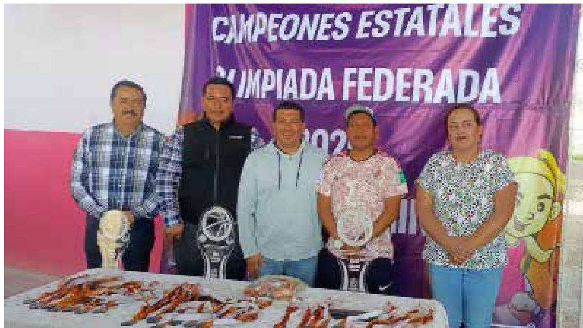
El Gobierno Municipal reconoció el esfuerzo y talento de los jóvenes que participaron en esta importante justa deportiva

Con eventos como este, Tlahuelilpan se consolida como un municipio que apuesta por el desarrollo deportivo, brindando espacios y oportunidades para que niños y jóvenes sigan creciendo en el ámbito competitivo.