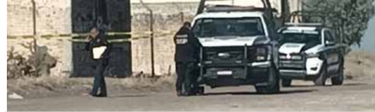
Un hombre tendido en el suelo y cubierto con una cobija. El ahora occiso vestía pantalón deportivo de color negro y una playera de color verde.