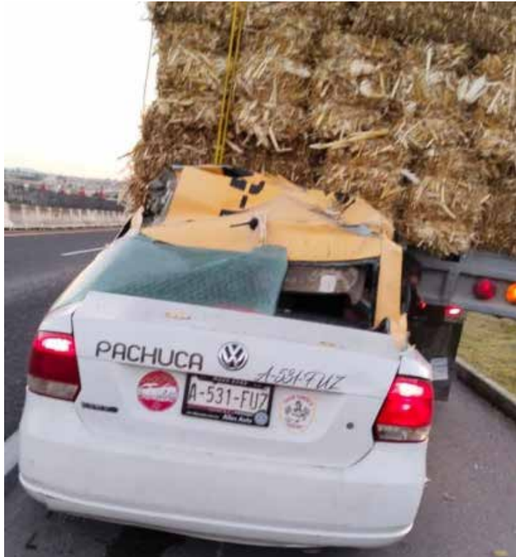
Una menor de edad que viajaba en el taxi también resultó con lesiones de consideración.

de consideración. Luego de ser alertados del fuerte percance, por automovilistas que pasaban