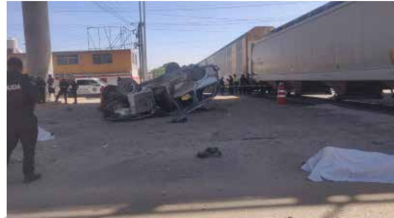
En el lugar del fatídico accidente, lamentablemente quedaron tendidos los cuerpos sin signos vitales de dos de los ocupantes

quedaron tendidos los cuerpos sin signos vitales de dos de los ocupantes de la camioneta Explorer, mientras que paramédicos de Protección Civil de Tlahuelilpan, realizaron el traslado urgente de una mujer hasta el hospital regional Tula-Tepeji donde al cierre de esta edición su estado de salud se reportaba como grave, debido a las fuertes lesiones que presentaba.