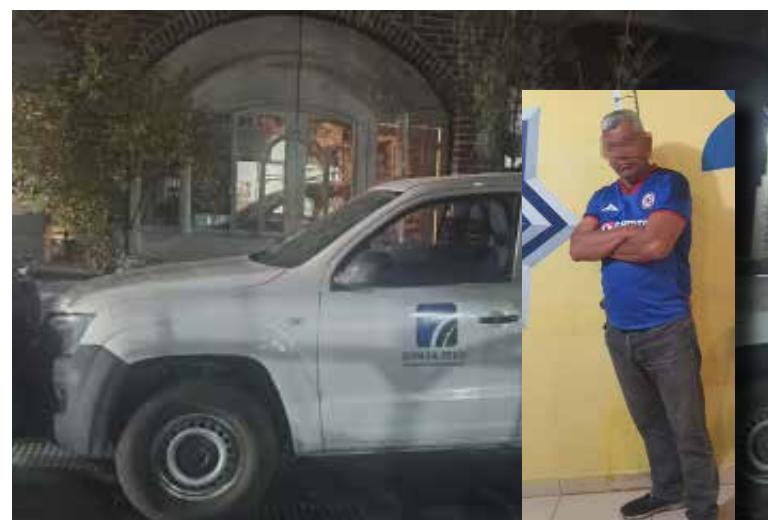
Según testigos, tras el choque, el conductor de la camioneta huyó del lugar