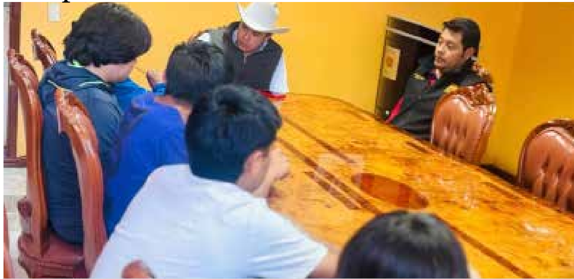
La administración municipal continuará implementando estrategias y programas destinados y enfocados a fortalecer el deporte en la región

Mencionó, que la administración municipal continuará implementando estrategias y programas destinados y enfocados a fortalecer el deporte en la región, brindando los espacios deportivos adecuados y los apoyos que permitan a los jóvenes seguir creciendo en el ámbito deportivo.