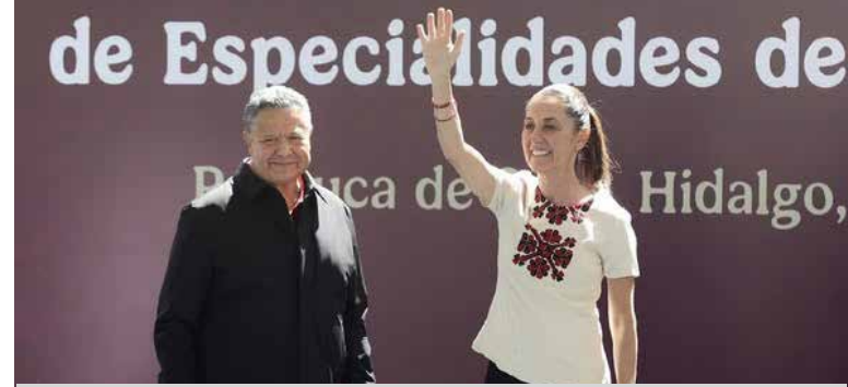
Esta nueva Clínica de Medicina Familiar de Especialidades contará con 29 consultorios.

Todo este proyecto representó una inversión de 156 millones de pesos, cuenta con 4 mil 500 metros de construcción, y se