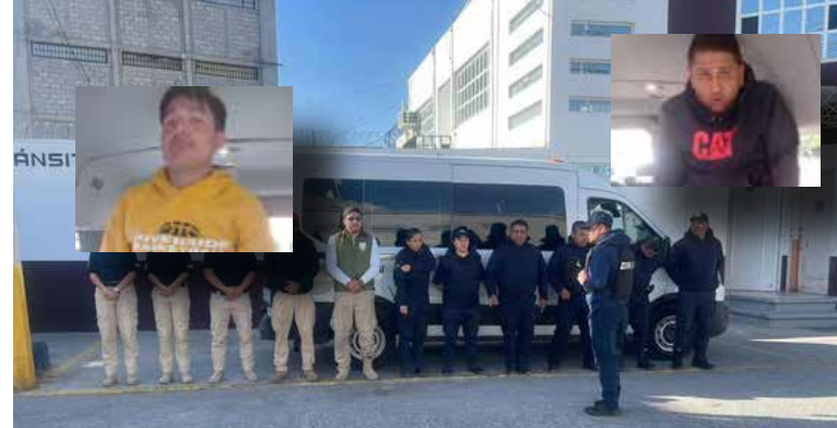
El operativo forma parte de una estrategia para combatir delitos financieros y proteger a la ciudadanía de este tipo de prácticas ilícitas.