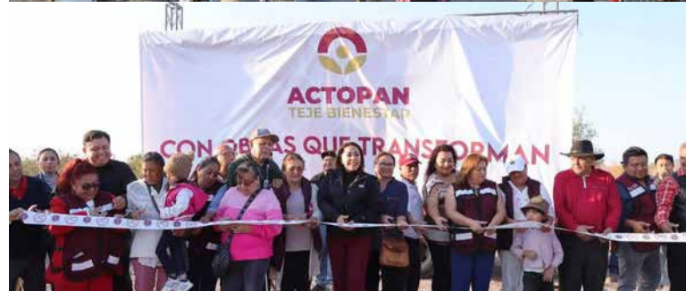
Con este tipo de acciones, el Gobierno Municipal de Actopan refrenda su compromiso con la ciudadanía