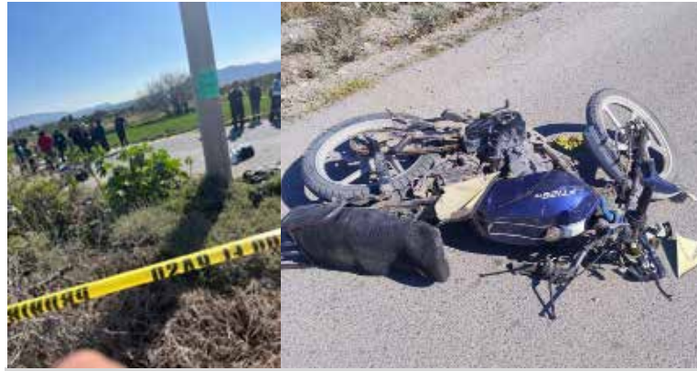
Las víctimas viajaban en una motocicleta marca Italika 125cc, presuntamente a exceso de velocidad

el llamado a la población para conducir con precaución y respetar los límites de velocidad, especialmente al utilizar motocicletas. En este