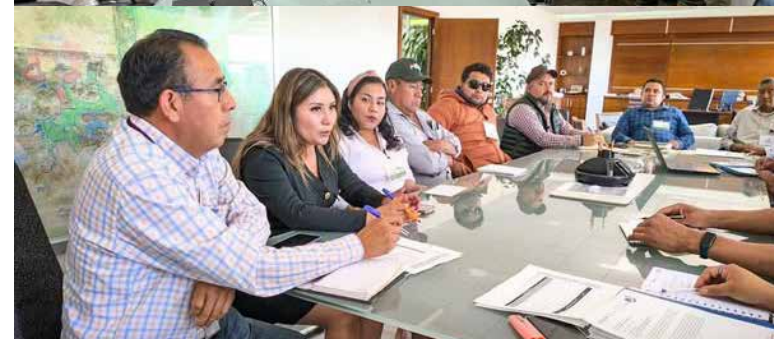
Este proyecto es vital para el municipio, ya que busca abastecer de agua potable a diversas comunidades que han enfrentado problemas de acceso al recurso