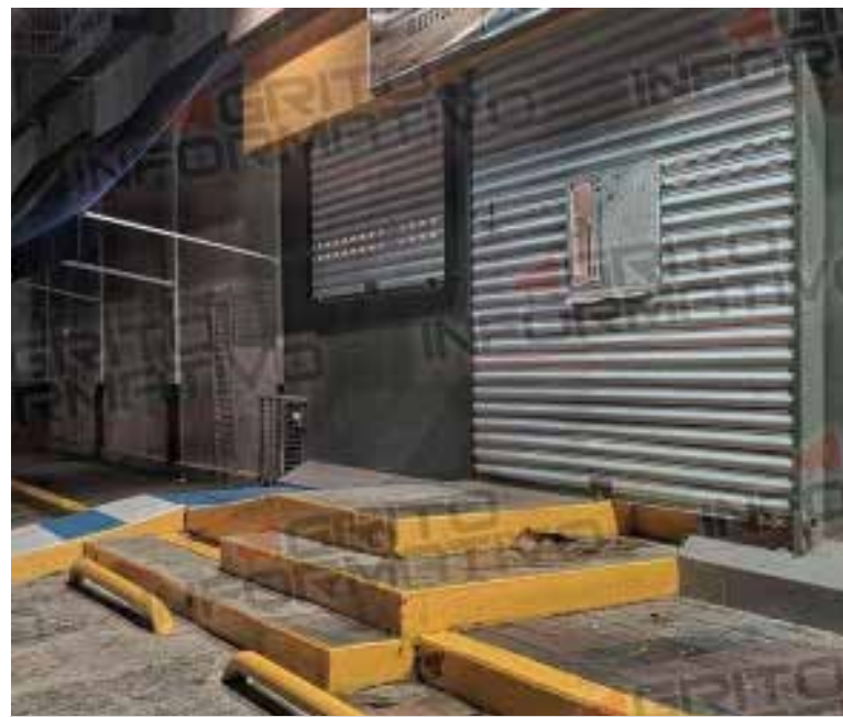
El individuo, armado con una pistola, amenazó a la empleada, permitiendo la entrada de un segundo cómplice, de alrededor de 28 años, quien vestía una sudadera café.

trabajadora atándola de pies y manos con un cable, mientras procedían a robar diversos productos de la tienda, incluyendo cables, cargadores y mercancías de abarrotes, además de aproximadamente $1,770 pesos en efectivo de la caja registradora. Una vez que los asaltantes se retiraron del lugar, la empleada logró desatarse y contactar al representante legal de la tienda, quien le indicó esperar la llegada de las autoridades.