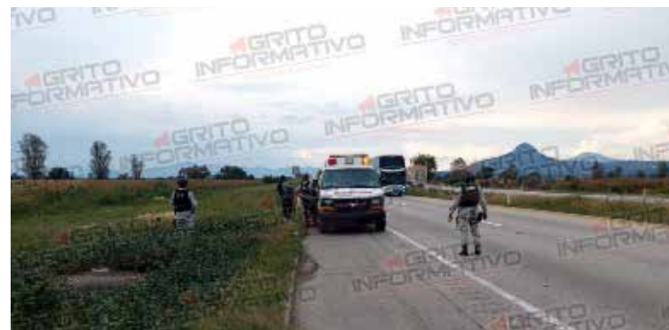
Esa zona de Tula de Allende, ha sido nombrada como el paso de la muerte, por los constantes hechos delictivos

Localizan a dos hombres amarrados en terreno