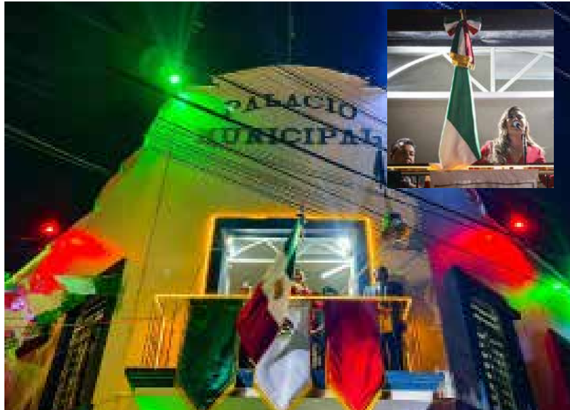
La Presidenta Municipal destacó la importancia de honrar la memoria de los hombres y mujeres que, con su valentía y sacrificio, nos dieron patria y libertad.

**¡Viva México! ¡Viva Hidalgo! ¡Viva Tezontepec!