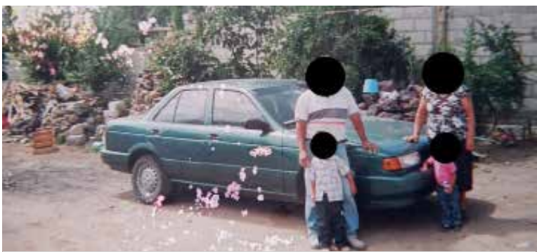
Inmediatamente, los afectados llamaron a las autoridades municipales para reportar el robo