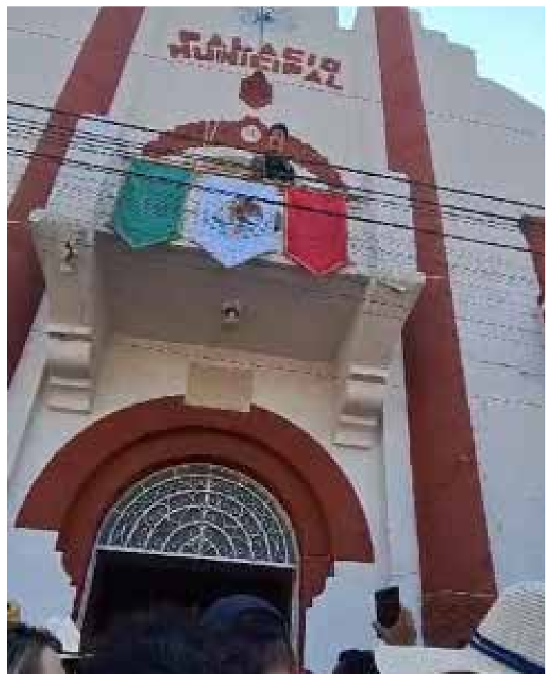
La alcaldesa que se decía cercana al pueblo, se negaba a entablar un dialogo

La alcaldesa que se decía cercana al pueblo, se negaba a entablar un dialogo con el pueblo por lo que los gritos y consignas no se hicieron esperar “acércate así como cuando nos pedías el voto” o “si no puedes con el cargo renuncia”, son algunas de las consignas que podían escucharse.