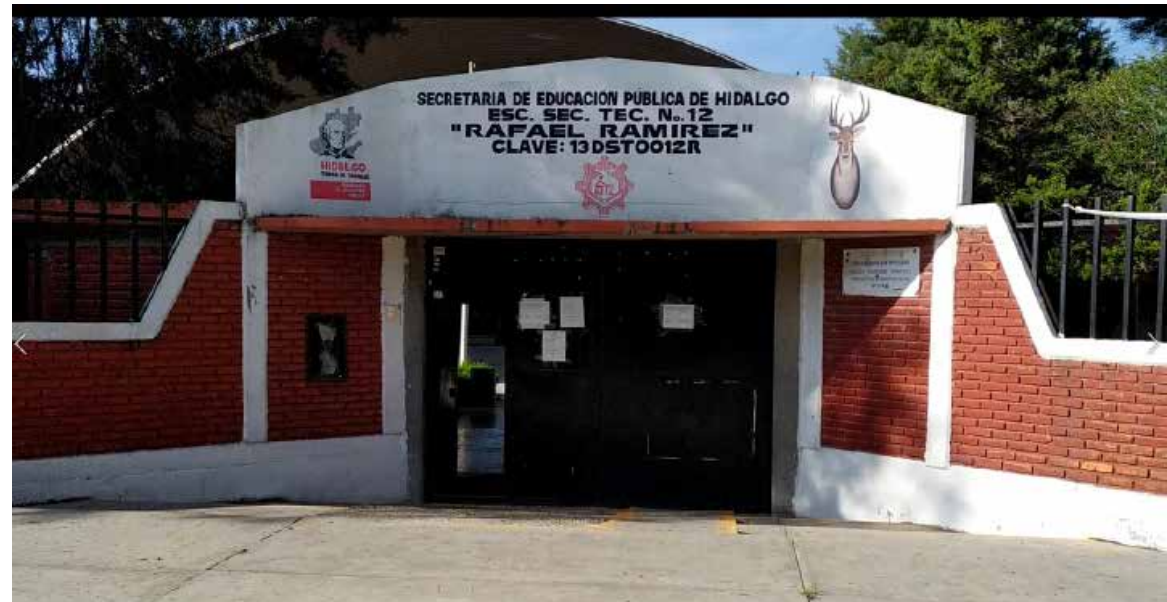
La estudiante fue trasladada a la Secretaría de Seguridad Pública de manera responsable

elementos de la Secretaría que una estudiante había sido sorprendida con sustancias ilícitas entre sus pertenencias. Tras confirmar los hechos, las autoridades escolares, junto con los elementos de seguridad pública, contactaron de inmediato a los familiares de la menor para que acudieran a acompañarla. La estudiante fue trasladada a la Secretaría