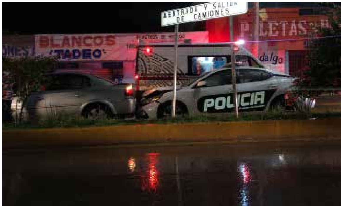
Tras el impacto, ambas unidades quedaron varadas sobre el bulevar en espera de los ajustadores de seguros.

Mixquiahuala.- Una unidad de la Dirección de Seguridad Pública Municipal de Progreso de Obregón se vio involucrada en un choque por alcance registrado durante la noche del pasado día viernes 13 de Septiembre cuando circulaba en el Bulevar Octaviano Flores Mayorga, frente a Casa Vargas, en el municipio de Mixquiahuala. Testigos del percance aseguraron que el elemento de la Policía Municipal que conducía la patrulla iba distraído en el teléfono celular por lo que no alcanzó a frenar a tiempo, impactando contra la parte trasera de un automóvil particular, causando daños considerables en ambas unidades. Tras el impacto, ambas unidades quedaron varadas sobre el bulevar en espera de los ajustadores de seguros. Minutos más tarde, los vehículos fueron asegurados y remolcados hasta el corralón en tanto se deslindan responsabilidades.