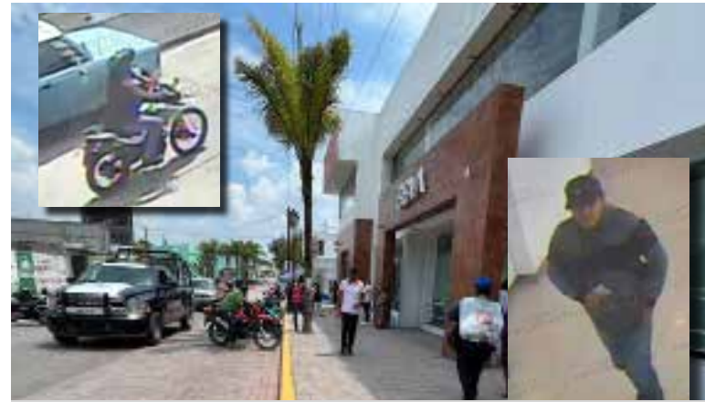
Este asalto ha generado preocupación entre los habitantes del municipio.

Entre las víctimas se encontraba un masculino, conocido comerciante del municipio, el cual fue despojado de la cantidad de 330 mil pesos que iba a depositar, luego de que los atracadores le apuntaran a la cabeza con un arma. Este asalto ha generado preocupación entre los habitantes del municipio, especialmente debido a que ocurre en medio de los supuestos operativos de seguridad recientemente implementados por el nuevo director de seguridad pública,