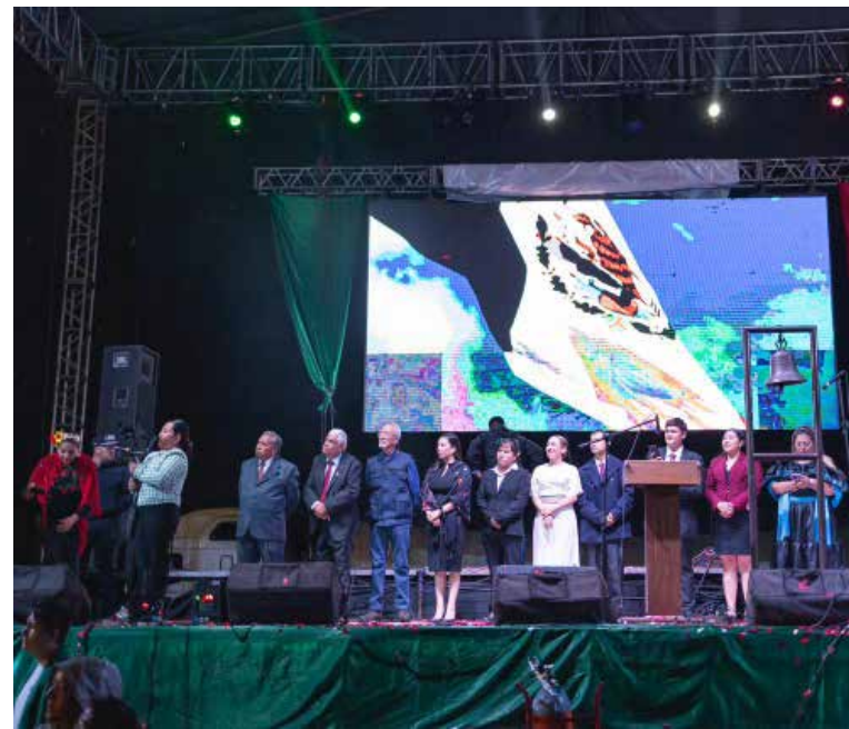
El Chapo de Sinaloa, cautivó a los asistentes con sus grandes éxitos

Tepeji del Río, vivió una noche memorable, donde la música, la danza y el fervor patrio se unieron para conmemorar la independencia de México.