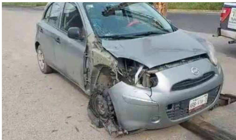
Testigos del accidente informaron que el responsable del hecho estuvo dialogando con elementos de la policía

Testigos del accidente informaron que el responsable del hecho