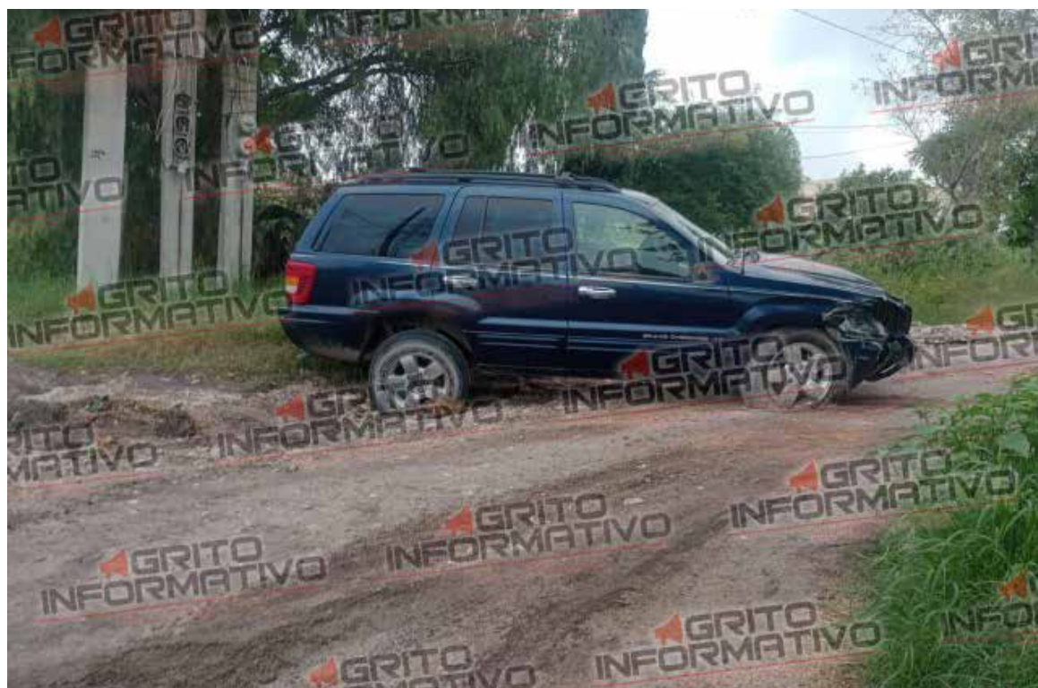
Tras realizar una inspección, las autoridades no lograron localizar al dueño del vehículo,

Hasta el momento, se desconoce si el vehículo está relacionado con algún incidnte vial reciente o si presenta un reporte de robo