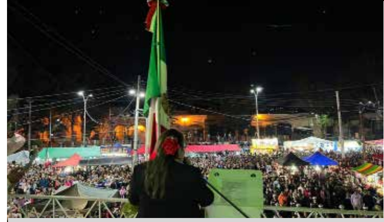
Por primera vez una mujer, la presidenta municipal Norma Leticia Reyes Reyes, encabezó la ceremonia del Grito de Independencia