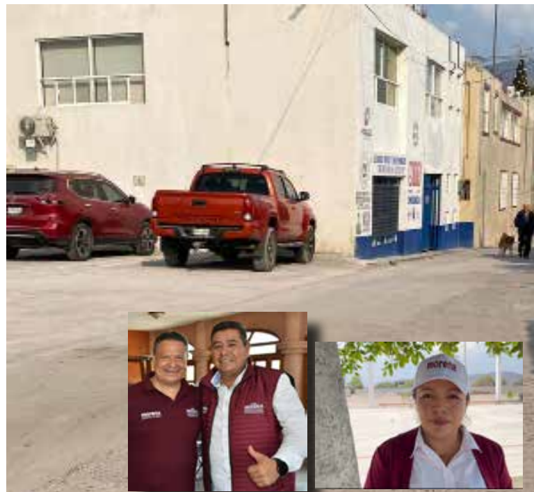
La camioneta marca Toyota, tipo Tacoma TRD Sport 4x4 de color naranja, fue adquirida por el gobierno municipal el 30 de diciembre de 2022,