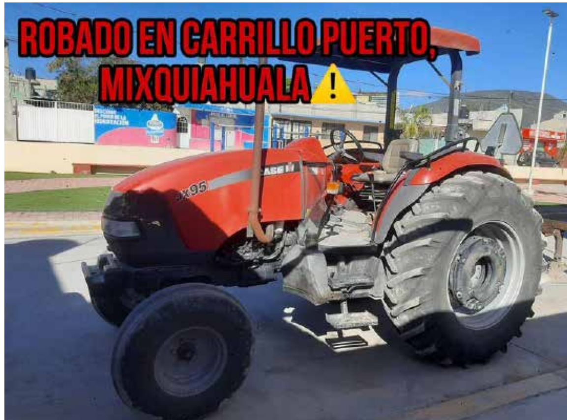
El asalto sucedió durante la mañana del día domingo 15 de Septiembre

Ante la tardanza en la respuesta de la policía municipal, vecinos lograron organizarse rápidamente para ubicar y dar seguimiento a los delincuentes que aparentemente tomaron camino hacia la localidad de El Tinaco, lamentablemente pese a sus esfuerzos no pudieron dar alcance a los ladrones quienes lograron darse a la fuga. Algunas versiones señalan que el tractor fue subido a un camión para lograr huir sin ser detectados.