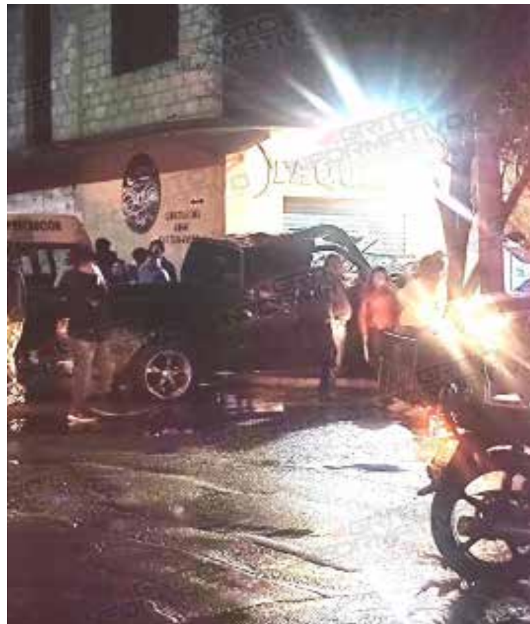
Tras el incidente, personal de Protección Civil acudió de inmediato para brindar los primeros auxilios

Afortunadamente, ninguno de los jóvenes requirió ser trasladado a un hospital, ya que no presentaron heridas de consideración.