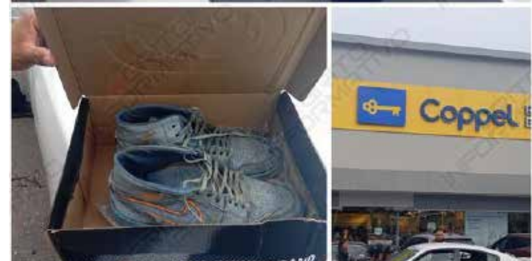
Sujeto decidió ponerse unos tenis nuevos de color negro, dejando sus maltratados tenis en la caja para tratar de despistar a los empleados y retirarse del lugar.

la Unidad Habitacional Pemex. El joven de 28 años de edad, identificado con las iniciales A.F.M.Z., una vez detenido fue remitido ante las autoridades correspondientes.