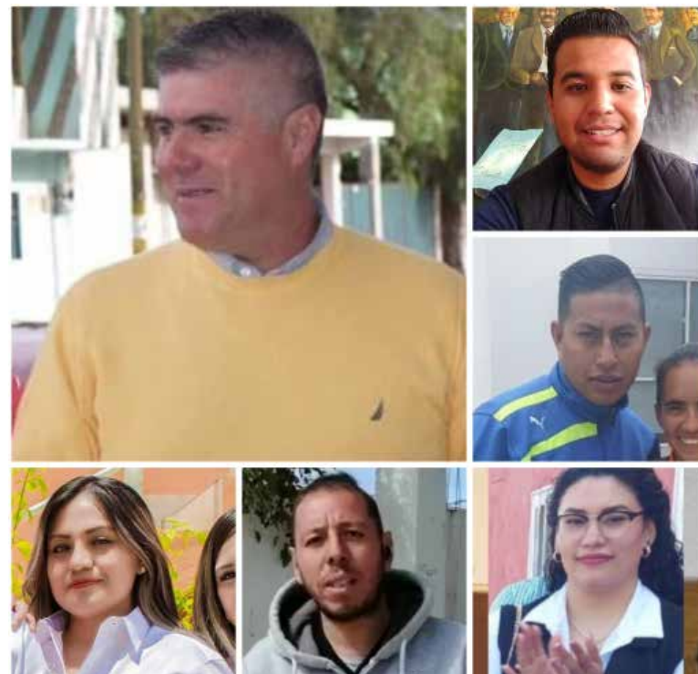
De manera extraoficial, comienzan a surgir los nombres de los hombres y mujeres que probablemente formarán parte del gabinete del profesor Miguel Ángel Peña Flores

Aunque los nombres aún se mantienen en reserva de manera oficial, se espera que en los próximos días el presidente municipal electo, Miguel Ángel Peña Flores, proporcione