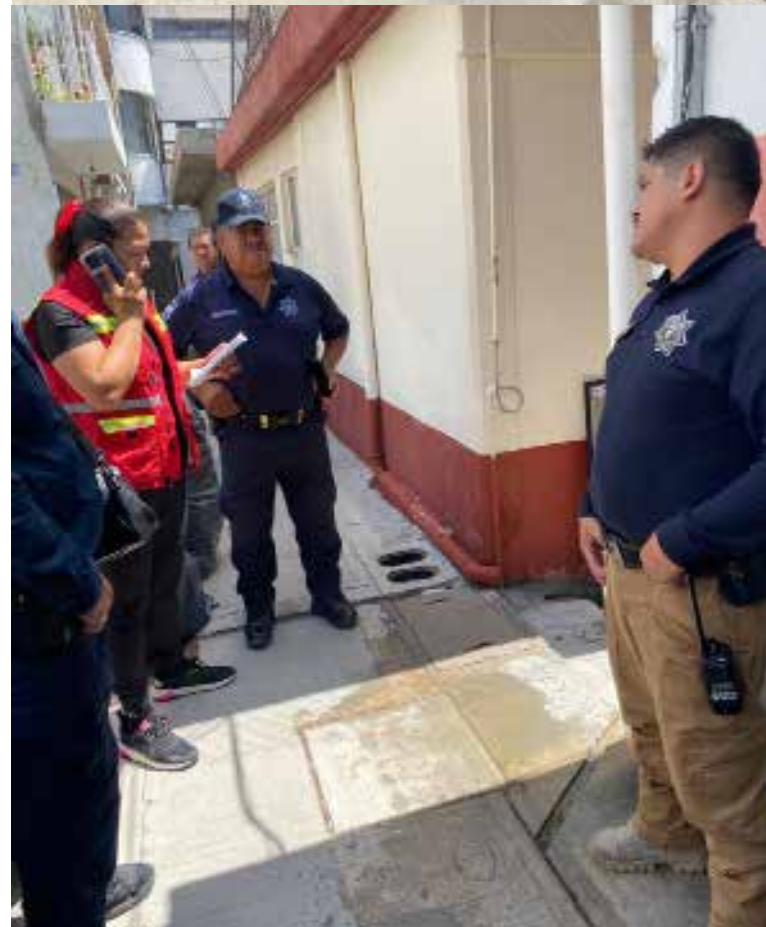
Las autoridades locales han asegurado la protección de bienes y la seguridad de los vecinos afectados.