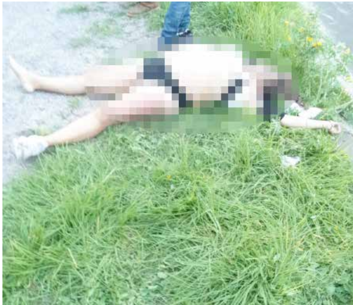
Luego del accidente, el masculino logró salir por su propios medios de las turbulentas aguas, lamentablemente la mujer no corrió con la misma suerte

bordo de la unidad que era conducida por la femina, al canal de aguas negras. Luego del accidente, el masculino logró salir por su propios medios de las turbulentas aguas, lamentablemente la mujer no corrió con la misma suerte. Minutos más tardes, los propios pobladores del lugar lograron ubicar y extraer de la corriente de agua el cuerpo de la mujer, y aunque intentaron reanimarla, lamentablemente perdió la vida al permanecer sumergida en el agua durante varios minutos.