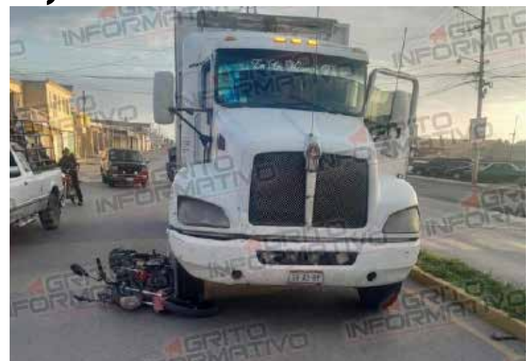
Al arribar los servicios médicos evaluaron a los ocupantes de la motocicleta, determinando que la mujer resultó con lesiones menores

Tlahuelilpan. — Durante la mañana del pasado día sábado 20 de Julio, elementos de seguridad pública municipal de Tlahuelilpan respondieron a una alerta sobre un accidente que se registraba sobre el concurrido Boulevard Sergio Buitrón Casas, en la carretera El Tinaco - Tlahuelilpan. Al llegar al lugar de referencia, los elementos policiacos encontraron un camión de la marca Kenworth, de color blanco, con placas de circulación 50-AJ-BY, que había colisionado y aplastado a una motocicleta . La frágil unidad era conducida por un hombre que iba acompañado de una mujer. De inmediato, los oficiales solicitaron el apoyo de los paramédicos de la unidad municipal de Protección Civil. Al arribar los servicios médicos evaluaron a los ocupantes de la motocicleta, determinando que la mujer resultó con lesiones menores, siendo trasladada al hospital para recibir atención médica.