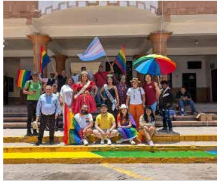
El evento contó con una variada participación de colectivos, activistas, familias y aliados que caminaron juntos bajo el lema del amor y la aceptación.

recorrieron las principales calles de la ciudad en un ambiente festivo y de solidaridad. El gobierno local expresó su gratitud a todos los que participaron y apoyaron esta celebración, destacando la importancia de construir una sociedad más inclusiva y respetuosa. "Gracias a todos los que hicieron posible esta maravillosa celebración de amor y libertad", señalaron las autoridades municipales a través de sus redes sociales.