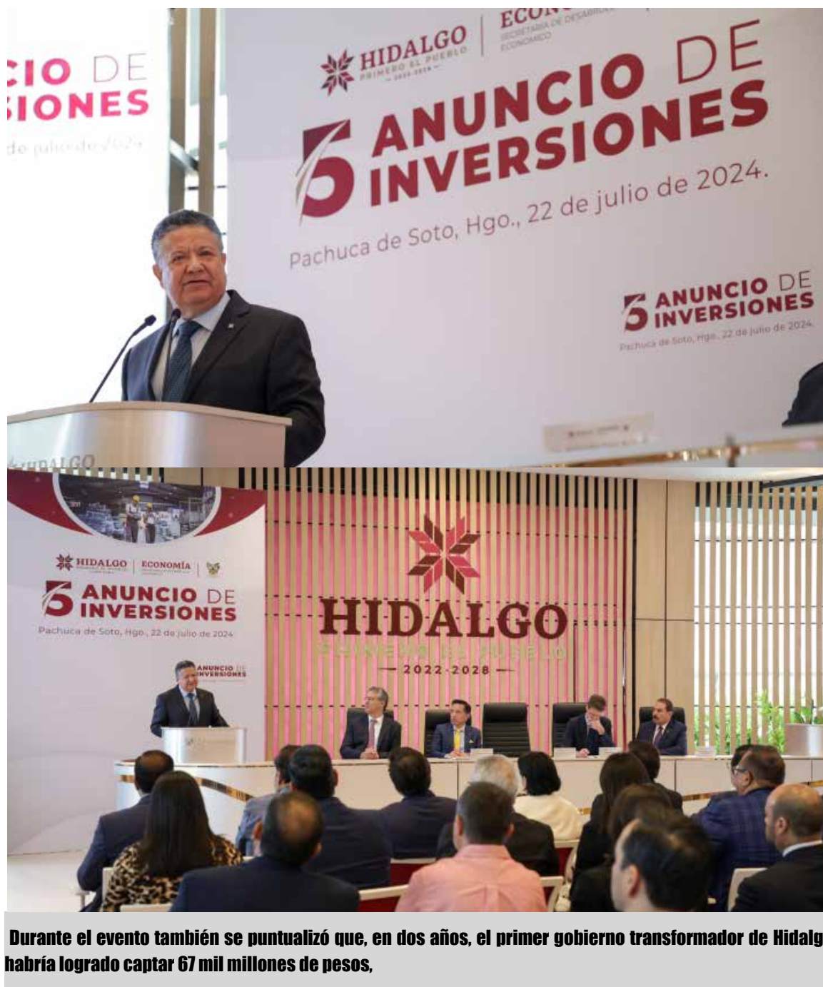
Durante el evento también se puntualizó que, en dos años, el primer gobierno transformador de Hidalgo habría logrado captar 67 mil millones de pesos,

Durante el evento también se puntualizó que, en dos años, el primer gobierno transformador de Hidalgo habría logrado captar 67 mil millones de pesos, y que con este quinto anuncio se alcanzarán más de 84 mil 112 millones