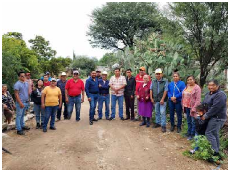
La construcción incluyó la instalación de nuevas tuberías y pozos de visita

y al bienestar general. El proyecto de drenaje sanitario en la calle 5 de Mayo es parte de una serie de obras que la administración de Hernández Cerón ha implementado para modernizar y mejorar los servicios básicos en San Gabriel. La construcción incluyó la instalación de nuevas tuberías y pozos de visita, garantizando un sistema eficiente y duradero que beneficiará a las generaciones presentes y futuras.