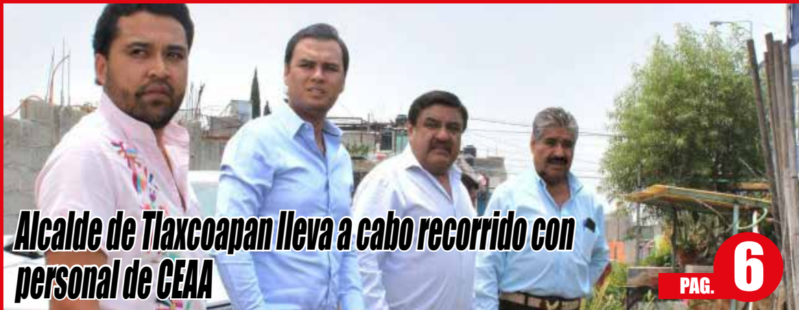
Alcalde de Tlaxcoapan lleva a cabo recorrido con personal de CEEA