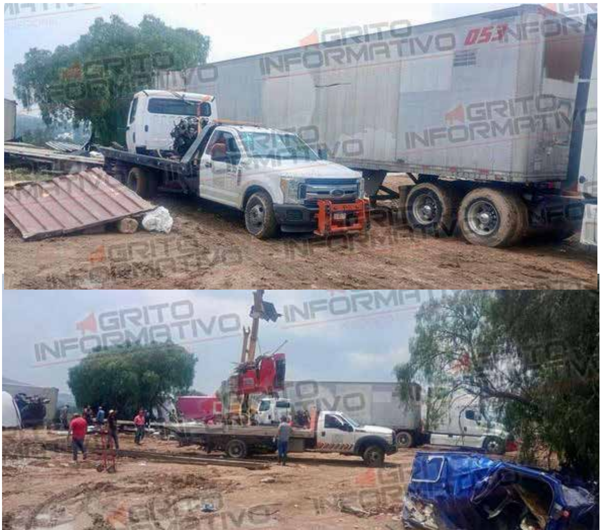
Los vehículos asegurados fueron puestos a disposición de las autoridades competentes, quienes realizarán las investigaciones pertinentes

Los vehículos asegurados fueron puestos a disposición de las autoridades competentes, quienes realizarán las investigaciones pertinentes para dar con los responsables de estos actos delictivos.