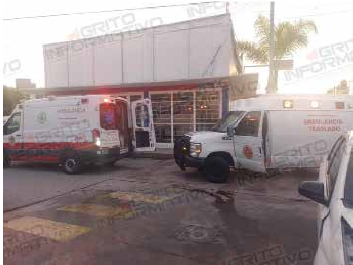
Los equipos de emergencia brindaron atención hospitalaria a los lesionados antes de trasladarlos al Hospital Integral de Cinta Larga

Los equipos de emergencia brindaron atención hospitalaria a los lesionados antes de trasladarlos al Hospital Integral de Cinta Larga para recibir tratamiento médico