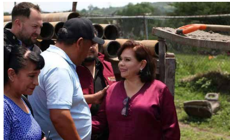
“Reposición de pozo para agua potable en la localidad de Boxaxni”

“Agradezco a los vecinos de Boxaxni y a todos los que hacen posible este gran proyecto, estamos ahorrando y dando resultados visibles, como