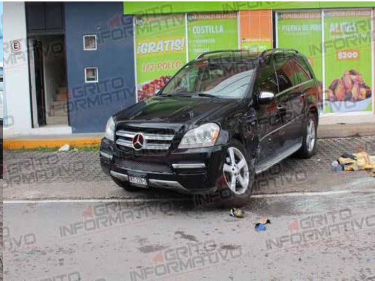
El incidente desató una intensa persecución por las calles de Tula, durante la cual el individuo causó daños significativo

oficiales y se dio a la fuga. El incidente desató una intensa persecución por las calles de Tula, durante la cual el individuo causó daños significativo en su intento desesperado de