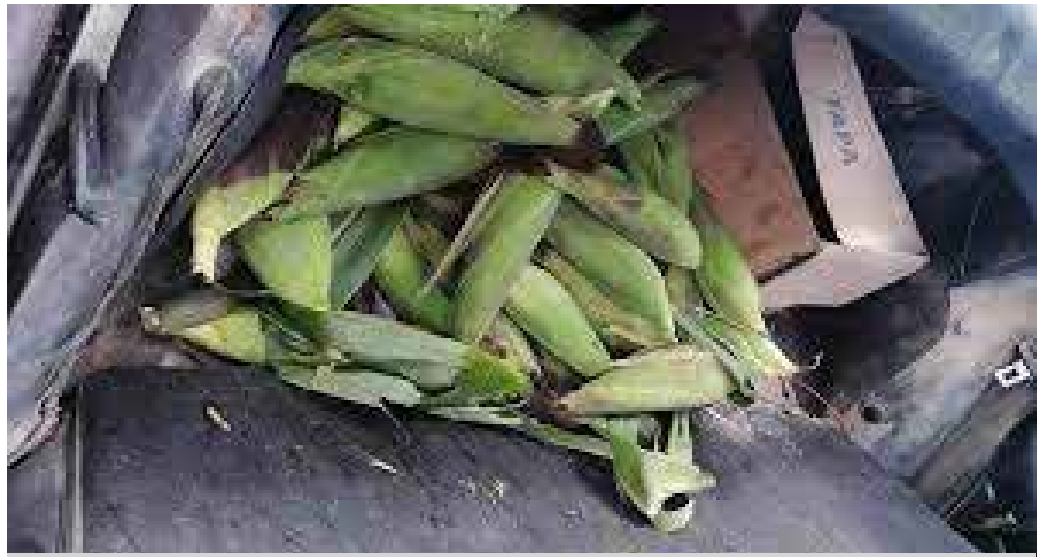
Esta acción puede resultar en una pena de prisión que va desde los seis hasta los diez años

Por lo tanto, se insta a la población a reflexionar antes de cometer este tipo de acciones, ya que las consecuencias legales pueden ser severas.