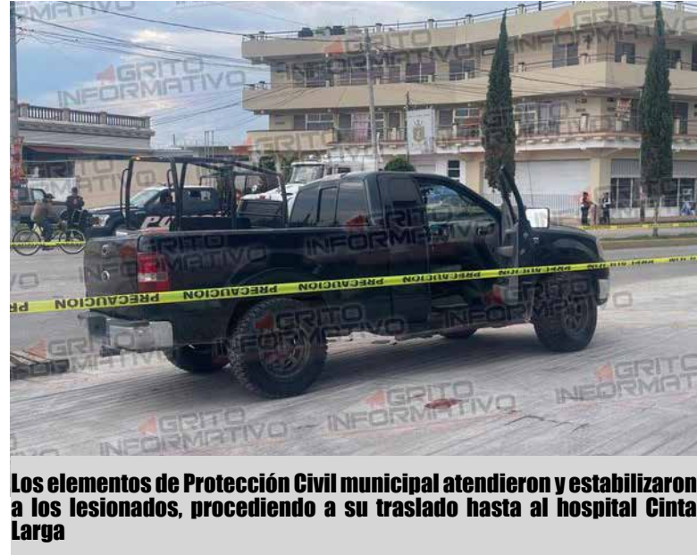
Los elementos de Protección Civil municipal atendieron y estabilizaron a los lesionados, procediendo a su traslado hasta al hospital Cinta Larga

Luego de algunos minutos de su ingreso al nosocomio, uno de los sujetos perdió la vida a causa de las graves lesiones que presentaba.