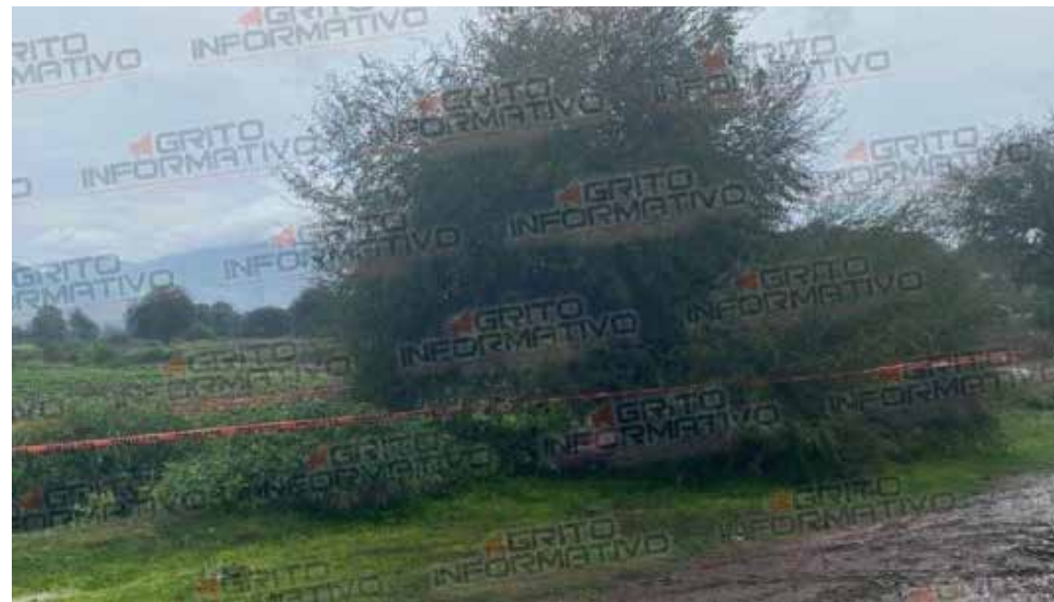
La mujer se encontraba laborando en la milpa de cultivo cuando comenzó a llover, lo que la llevó a cubrirse del agua debajo de un árbol, lugar en donde fue alcanzada por un rayo.

La escena fue acordonada en espera de elementos de la Procuraduría General de Justicia del Estado de Hidalgo, quienes realizarán el levantamiento del cuerpo.