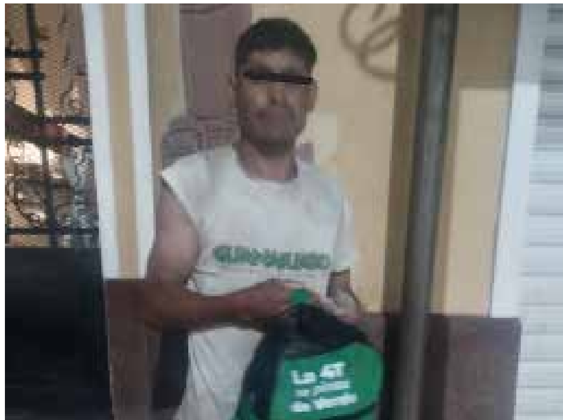
El sujeto fue ingresado a las galeras de la Dirección de Seguridad Pública Municipal

El sujeto fue ingresado a las galeras de la Dirección de Seguridad Pública Municipal, por lo que autoridades invitaban a aquellas mujeres que hubieran sido víctimas de esta persona, acudir a presentar su denuncia correspondiente.