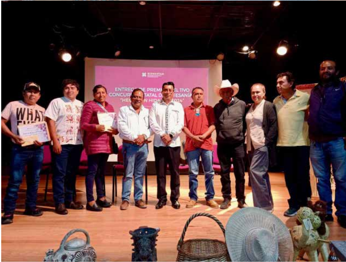
El objetivo de este concurso es incentivar la preservación del patrimonio cultural hidalguense

e c o n ó m i c o s el compromiso promoción de la para este sector del Gobierno cultura local y prioritario. Estas Municipal con sus tradiciones acciones reflejan el fomento y la ancestrales.