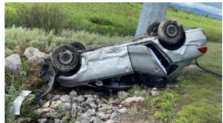
Fuerte accidente automovilístico se registró a la altura de la localidad de Lagunilla,