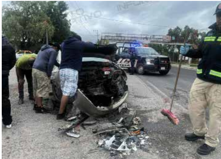
Las autoridades locales han iniciado una investigación para determinar las causas del accidente