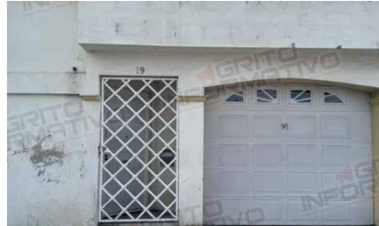
Al recibir el reporte, diversos cuerpos de emergencia acudieron rápidamente al lugar de los hechos.