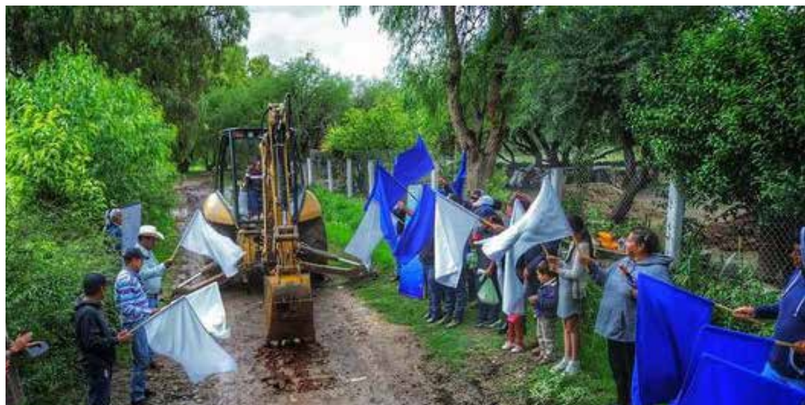
Los vecinos presentes en el evento expresaron su agradecimiento y apoyo a la administración municipal

Los vecinos presentes en el evento expresaron su agradecimiento y apoyo a la administración municipal, reconociendo el impacto