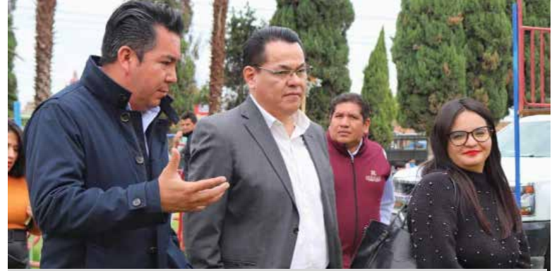
La feria está especialmente dirigida a niños, niñas y adolescentes, con el objetivo de que comprendan y valoren el trabajo realizado por estas instituciones.