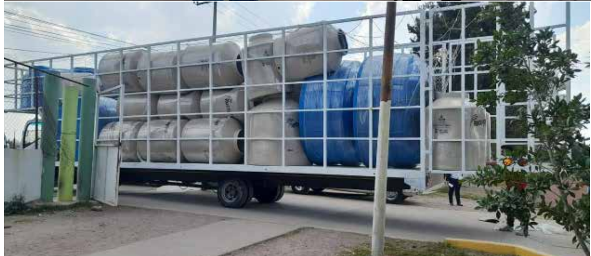
La entrega de estos tinacos representa un paso significativo hacia la mejora de la infraestructura básica en los hogares del municipio.