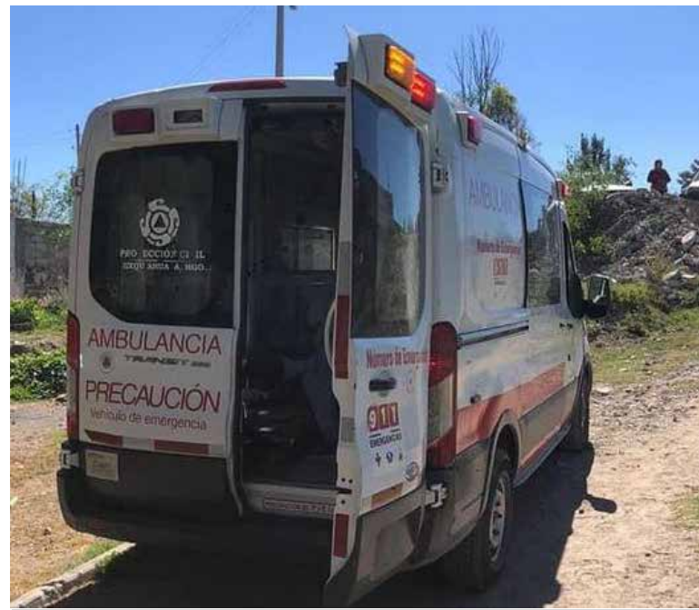
Joven de 18 años resultó herido tras ser aparentemente atropellado.

Sin embargo, la intervención de la policía municipal fue obstaculizada por