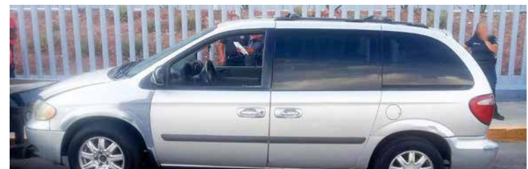
Tras el despliegue policial, las personas fueron intervenidas a bordo de una camioneta Chrysler y remitidas al área de retención primaria de la SSPH