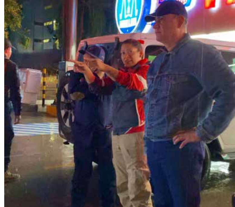
En San Marcos, se asignará una patrulla y personal de Protección Civil y Bomberos como medida preventiva

del río, sino a problemas en las alcantarillas. El comité interinstitucional, conformado por instancias estatales y federales, la Guardia Nacional y la Comisión Estatal del Agua, se mantendrá alerta ante cualquier cambio climático. Se recomienda a la población estar atenta a la información veraz y ubicar un albergue temporal en caso de evacuación. En San Marcos, se asignará una patrulla y personal de Protección Civil y Bomberos como medida preventiva, y los monitoreos serán constantes para garantizar la seguridad de todos los habitantes.