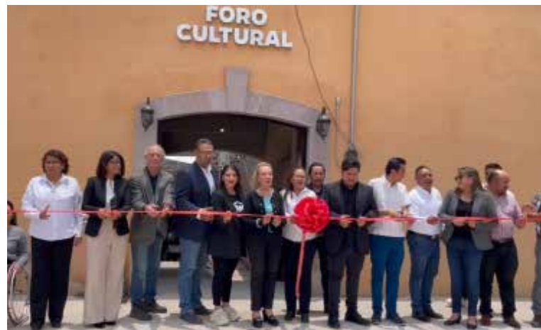
El proyecto del Foro Cultural Tlahuelilpan busca inculcar el amor por el arte y la cultura en los jóvenes de la región

La apertura del foro es una muestra del compromiso del gobierno municipal de Tlahuelilpan con el