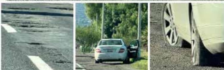
Automovilistas han reportado numerosos casos de vehículos dañados y ponchaduras de llantas debido a gigantescos baches