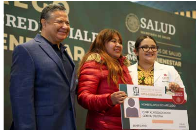
Destacó que las y los servidores públicos tienen la responsabilidad de cumplir con las obligaciones constitucionales, como el que cada persona cuente con un acceso digno al derecho a la salud.