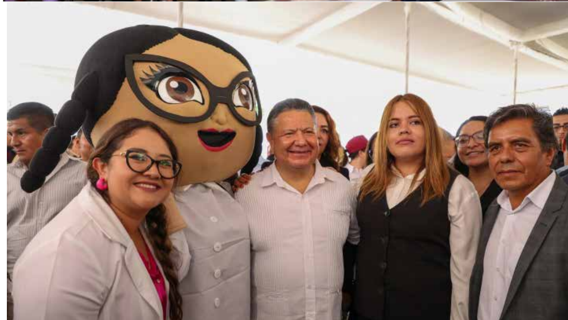
El mandatario estatal entregó 91 tarjetas bancarias a nuevos beneficiarios de los programas "Apoyo para el Bienestar y el Desarrollo" y "Bienestar de Madres Solteras"

en Teofani, San Antonio Abad, El Mothé y San Miguel Acambay, sumando más de 14 millones 663 mil pesos. También se realizaron pavimentaciones hidráulicas en El Tablón y Francisco Villa, con una inversión de 2 millones 689 mil pesos.