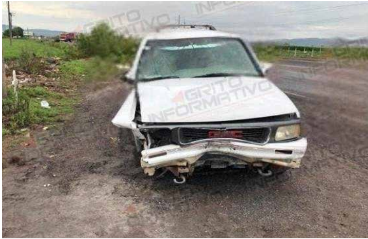
Vehículo con visibles huellas de accidente automovilístico sobre la carretera Tlahuelilpan-Tula de Allende

Se trata de una camioneta de la marca GMC, tipo Jimmy, con placa de circulación del Estado de México. La unidad presentaba un fuerte