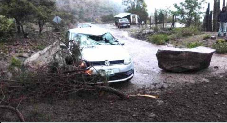
La circulación se vio momentáneamente afectada en tanto se realizaban los trabajos para poder despejar la carretera.