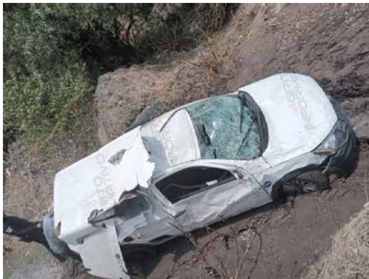
Con el apoyo de una grúa, el vehículo fue extraído del río y trasladado al corralón

El incidente ocurrió alrededor de las 11:00 de la mañana, cuando automovilistas que circulaban sobre la carretera que conduce a la comunidad de Santa María Quelites reportaron que un vehículo se había precipitado desde el puente conocido como "Los Muros" hacia las aguas del río. Al recibir el reporte, socorristas y personal de la agencia de seguridad estatal se movilizaron rápidamente al sitio del accidente. Al llegar, encontraron una camioneta