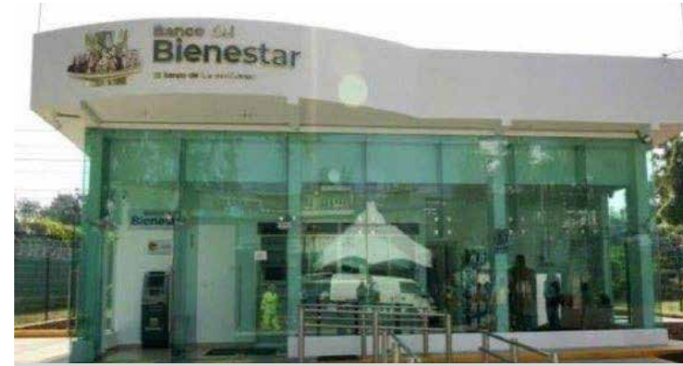
Al llegar a la sucursal, los oficiales encontraron la puerta abierta y varios vidrios rotos

abierta y varios vidrios rotos, los responsables al percatarse de la presencia policiaca huyeron el lugar, lo que evitó que cumplieran su objetivo. De igual forma, en el lugar se localizó una barreta, presumiblemente utilizada para causar los daños e intentar sustraer el efectivo del cajero automático.