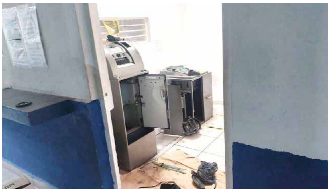
Grupo de sujetos que portaban armas de fuego asaltan la empresa.

Luego del atraco, la policía local implementó un operativo para intentar dar con el paradero de los autores del asalto, sin embargo, fue imposible ubicarlos.