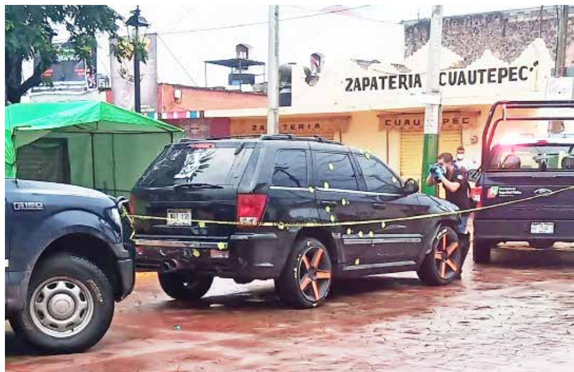
Por estos hechos tres personas fueron trasladadas a un hospital el municipio de Tulancingo.

Cuautepec de Hinojosa.- El domingo 19 de septiembre se registró una balacera en el municipio de Cuautepec de Hinojosa, estado de Hidalgo, que dejó como saldo tres personas heridas de bala. Según los reportes los hechos sucedieron en la zona centro, en el lugar se visualizaba una camioneta marca Jeep tipo Cherokee color negra, la cual presenta múltiples impactos de proyectil de arma de fuego. Por estos hechos tres personas fueron trasladadas a un hospital el municipio de Tulancingo. El lugar de los hechos fue acordonado por la policía local y se solicitó la presencia de la Procuraduría General de Justicia del estado de Hidalgo para los trámites legales correspondientes.