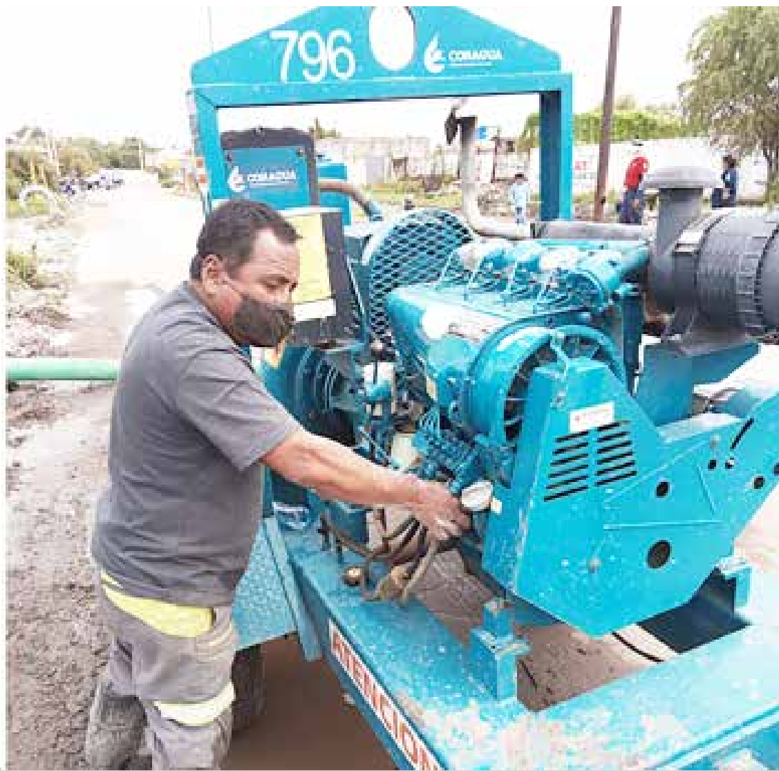
Conagua monitorea de manera permanente los embalses a su cargo,

Para lo anterior, la Comisión mantiene estrecha y oportuna comunicación con las direcciones municipales de Protección Civil de Tepeji del Río de Ocampo, Tula de Allende, Tepetitlán, Tlaxcoapan, Tlahuelilpan, Tezontepec de Aldama, Mixquihuala, Chilcuautla, Ixmiquilpan y Tasquillo, a fin de que las autoridades locales estén en posibilidad de implementar oportunamente los protocolos de prevención, que incluyen