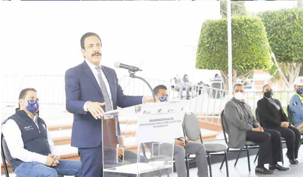
Hidalgo cumple una misión fundamental: dotar del vital líquido al Valle de México

Hidalgo si se me permite la perforación de pozos agrícolas”, pero no se admite, por ley está vedada dicha acción.