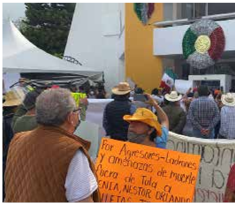
Manifestantes fuera de la Presidencia Municipal.