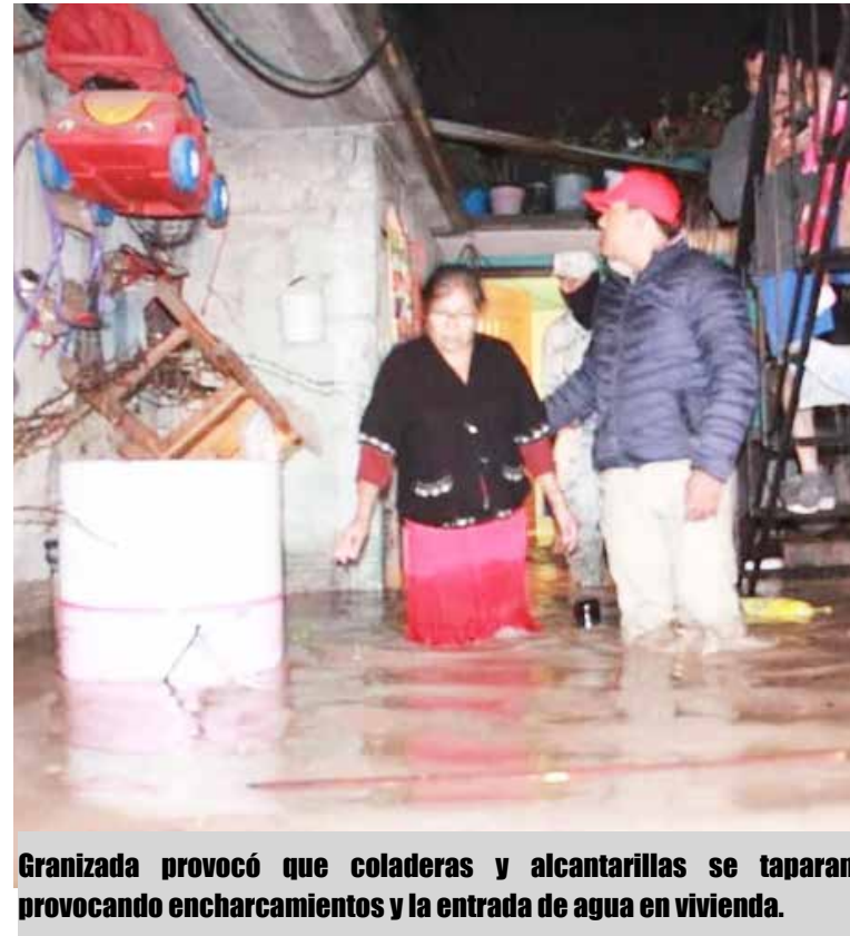
Granizada provocó que coladeras y alcantarillas se taparan provocando encharcamientos y la entrada de agua en vivienda.

Las tareas de limpieza y desazolve inclusive con equipos Vector continuaban al cierre de la presente edición, además el alcalde ha anunciado que ya se trabaja en la realización un censo y evaluación de los daños y afectaciones dejadas.