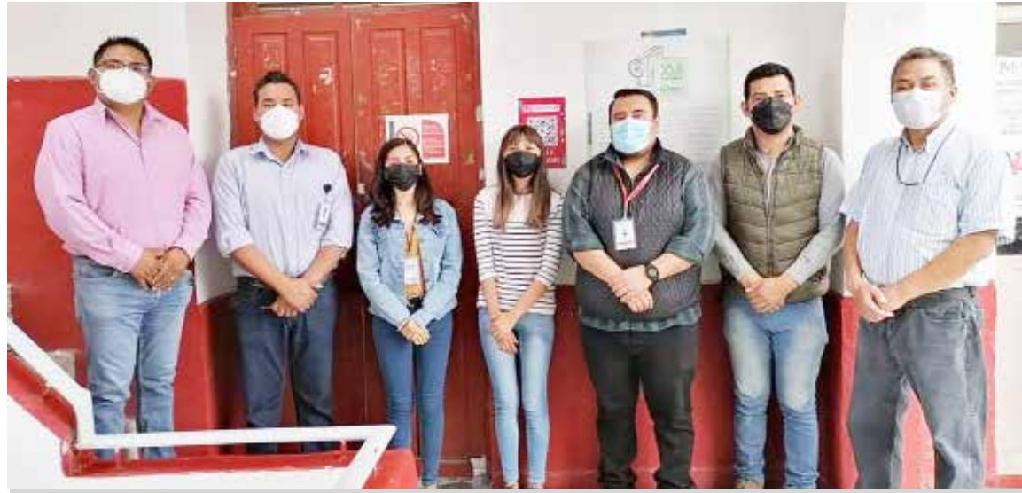
Equipo de Contraloría del municipio de Mixquiahuala.