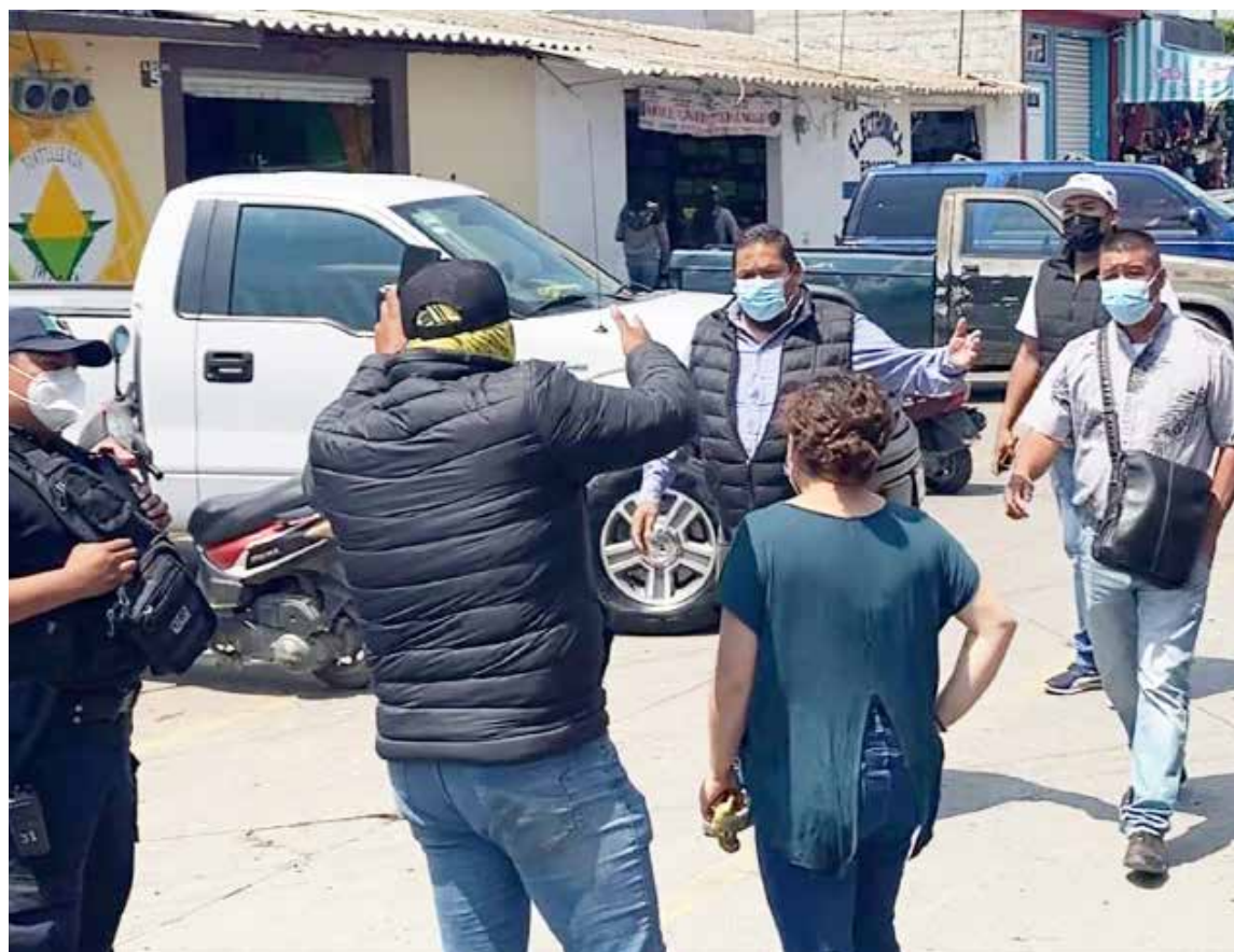
PRODEBIDA ya tiene a los caninos, los cuales ya se encuentran bajo su resguardo sanos y salvos

ocurridos el pasado martes, lamentaron la actitud del Presidente Municipal quien dijeron, llegó al lugar en una actitud prepotente y agresiva y ordenando que su vehículo les fuera detenido, solo por hacer uso de su libertad de expresión y manifestación pacífica pues con documentos en mano evidenciaron que tuvieron que pagar una multa de 900 pesos al municipio y 600 pesos de grúa, dinero que dijeron “bien pudo haberse utilizado en alimento o esterilizaciones