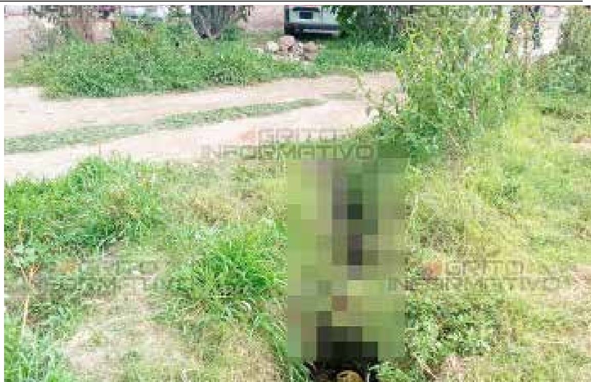
Junto al cadáver se localizó una bicicleta

La zona fue acordonada por elementos de la policía municipal. Personal de la Procuraduría General de justicia del Estado de Hidalgo acudió al lugar del hallazgo para realizar las diligencias correspondientes.