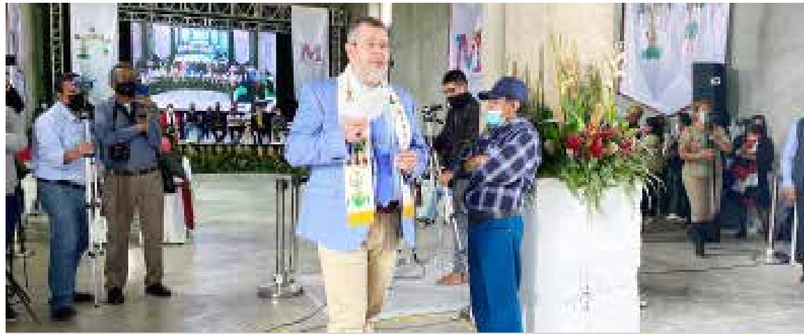
Decidimos realizar este primer informe en El Gavillero, el cual fue uno de los graneros más grandes de la región, porque este lugar representa nuestra esencia campesina.