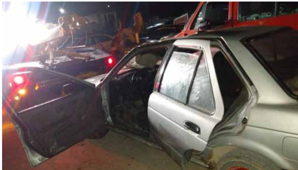
Actualmente los indicadores muestran una reducción de un 33 por ciento de los índices delictivos,

Los constantes operativos así como los recorridos de seguridad y vigilancia en colonias y comunidades han impactado de forma positiva en los índices delictivos que mantienen una tendencia a la baja.