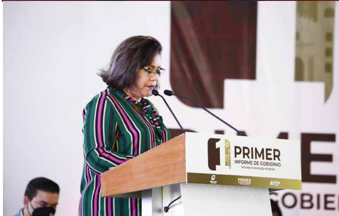
Implementó la aplicación “Actopan en Red”, por la cual el municipio obtuvo el premio especial por la implementación de proyectos innovadores

Presidente de la República Andrés Manuel López Obrador, reduciendo los salarios y dietas de la Presidenta Municipal, Síndicos y Regidores respecto