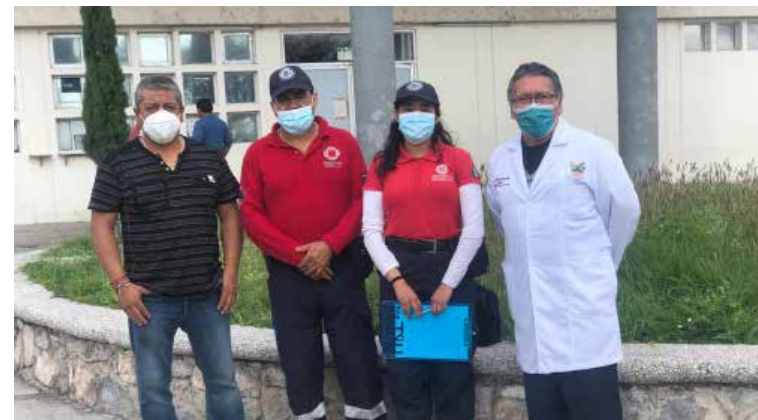
Clínicas y hospitales públicos, tiendas de autoservicio y una tienda departamental, se unieron al simulacro.

El área de Protección Civil recomendó, en caso de sismo, llevar una mochila de emergencia que contenga un directorio telefónico, botiquín, documentos importantes, víveres enlatados y agua, radio, linterna, pilas, alguna chamarra e incluso puedes añadir algunas herramientas básicas, definir las salidas de emergencia y los sitios seguros