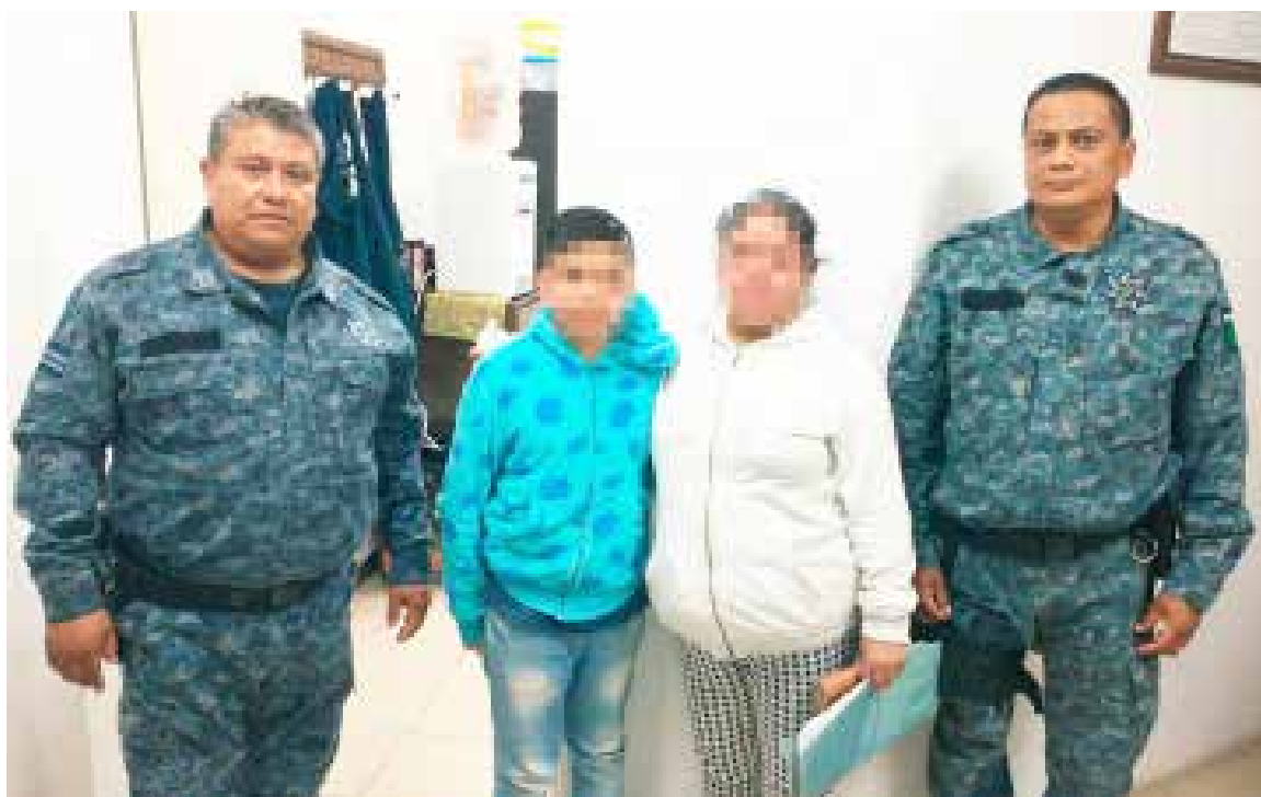
En la colonia Cuxtitla, agentes estatales detectaron al pequeño

Horas después, en la colonia Cuxtitla, agentes estatales detectaron al pequeño, por lo que notificaron a sus padres, lo trasladaron a la delegación regional de la Policía Estatal para su resguardo y finalmente entregado mediante los protocolos que marca el procedimiento legal.