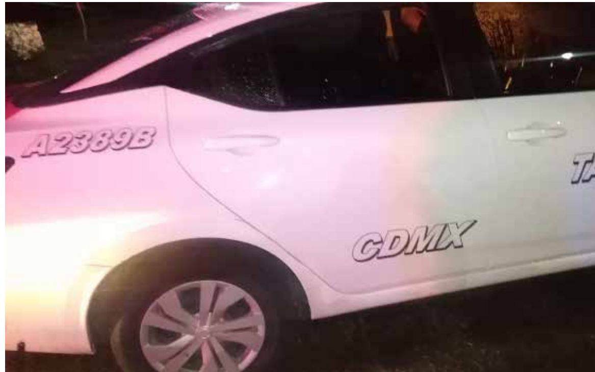
Asalto por dos sujetos vestidos de negro y portando cuchillos, realizaban a clientes y propietarios del establecimiento